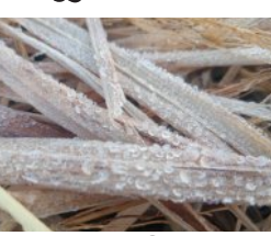
କାଡ଼ରେ ଅଧୁନି କଳମାଳ

■ ଦାରିଙ୍ଗପାଡ଼ି/ଜି.ଉଦୟଗିରି/ ବାରିପଦା/ରାଇରଙ୍ଗପୁର, ୧୨।୧୨ (ସମ୍ବିଧ): ରାଜ୍ୟରେ ଶୀତର ପ୍ରକୋପ ଜାରି ରହିଥିବା ବେଳେ ଓଡ଼ିଶାର କଣ୍ଟାର କୁହାଯାଉଥିବା ଦାରିଙ୍ଗପାଡ଼ିରେ ଗୁରୁବାର ଚଳିତ ବର୍ଷର ପ୍ରଥମ ତୁଷାରପାତ ଦେଖିବାକୁ ମିଳିଛି। ଗୁରୁବାର ସକାଳୁ ଦାରିଙ୍ଗପାଡ଼ିରୁ ଉତ୍ପତ୍ତି ହେଉଥିବା ଆର୍ଦ୍ରତା ଯୋଗୁଁ ଉଚ୍ଚ ମାଧ୍ୟମିକ ବିଦ୍ୟାଳୟ ସମ୍ପୂର୍ଣ୍ଣ ପାଣିପାଗ ନିକଟ ଏବଂ ଆଖ୍ୟାନ୍ତରାଣ ଇଲାକାରେ ତୁଷାରପାତ ହୋଇଥିବା ଦେଖାଯାଇଛି। ଚଳିତବର୍ଷର ପ୍ରଥମ ତୁଷାରପାତକୁ ଦେଖି ଅଞ୍ଚଳବାସୀ ଖୁସି ବ୍ୟକ୍ତ କରିଛନ୍ତି। ଗୁରୁବାର ୧୨।୧୨