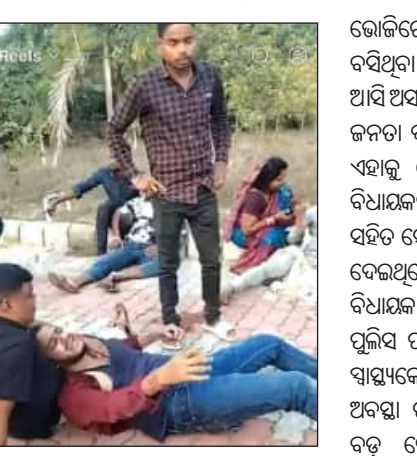
ସହିତ ବିକୃତ ଜନତା ଦଳର ସାମାଜିକ ଗଣମାଧ୍ୟମର ମହିଳା ଏବଂ ଯୁବ କର୍ମକର୍ତ୍ତାଙ୍କ ମାଡ଼ ମାରିଥିଲେ।

ଜେନାପୁର, ୧୪।୧୨(ସମ୍ପାଦକ): ଧର୍ମଶାଳା ନିର୍ବାଚନ ମଣ୍ଡଳୀରେ ପୂର୍ଣ୍ଣ ରାଜନୈତିକ ଗୋଷ୍ଠୀ ସଂଘର୍ଷ ଦେଖିବାକୁ ମିଳିଛି। ଶାସକ ବିଜେପି ଦଳର ଗୁଣ୍ଡାମାନଙ୍କ ଦ୍ୱାରା ବିଜେଡି କର୍ମୀଙ୍କ ଉପରେ ସଂଘବନ୍ଧ ଆକ୍ରମଣ ହୋଇଥିବା ଜଣାପଡ଼ିଛି। ଏ ନେଇ କୌଣସି ପକ୍ଷ ଆନାର ବାବଦ ହୋଇନାହାନ୍ତି।