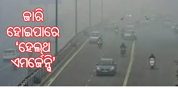
ଜାରି ହୋଇପାରେ 'ହେଲିକପ୍ଟର ଏମ୍ବେଡ୍ଡିଂ'

■ ନୂଆଦିଲ୍ଲୀ, ୧୪।୧୨ (ଏଜେନ୍ସି): ପ୍ରଦୂଷଣରେ କେନ୍ଦ୍ରୀୟ ହେଲିକପ୍ଟର ରାଜଧାନୀ ନୂଆଦିଲ୍ଲୀ ଏବଂ ଏନ୍.ସି.ଆର. ପ୍ରଦୂଷଣ ମାତ୍ରା ଏତେ ବଢ଼ିଯାଇଛି ଯେ ନିଃଶ୍ୱାସ ନେବାକୁ ମଧ୍ୟ କଷ୍ଟ ଲାଗୁଛି । ପ୍ରବଳ କୁହୁଡ଼ି ସହିତ ଧୂଆଁର ଚାବର ଦିଲ୍ଲୀବାସୀଙ୍କୁ କଳକଳ କରୁଛି । ଦିଲ୍ଲୀରେ ଏଘର କାଲିଟି ଇଣ୍ଡେକ୍ସ ବା ପ୍ରଦୂଷଣ ମାତ୍ରା ୪୯୧ରେ ପହଞ୍ଚିଛି, ଯାହାକି ବିପଦ ସ୍ତର ରୂପେ ବିବେଚିତ କରାଯାଏ । ଆଜି ସକାଳ ୬ଟାରେ ଏହା ୪୬୨ ସ୍ତରରେ ପହଞ୍ଚିଥିଲା ବୋଲି ପ୍ରଦୂଷଣ ନିୟନ୍ତ୍ରଣ ବୋର୍ଡ ପକ୍ଷରୁ ଜଣାପଡ଼ିଛି । ଦିଲ୍ଲୀର ସବୁ ୪୦ଟି ମିନିଟରୀ ଷ୍ଟେସନରେ ଲାଲ ରଙ୍ଗ ଦେଖିବାକୁ ମିଳିଛି । ଏକ୍ସଆଇ ଉଦ୍ଦେଶ୍ୟକ ଛୁଇଁଲେ