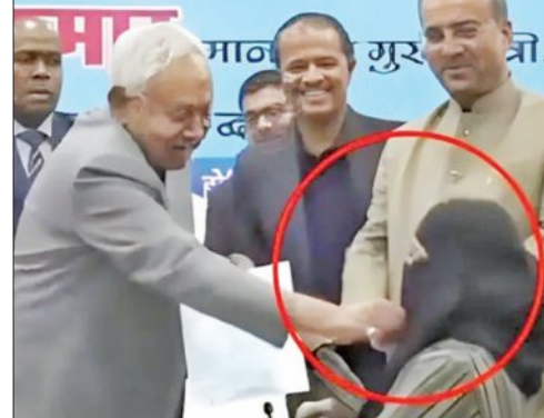
ରାଜ୍ୟରେ ମହିଳାମାନେ କେତେ ସୁରକ୍ଷିତ ରହିବେ ତିଡ଼ି କରନ୍ତୁ। ଏହି ଘଣ୍ଟା କାର୍ଯ୍ୟ ପାଇଁ ସେ ଭୂତର ଇସ୍ତଫା ଦେବା ଉଚିତ। ଏହି ଅଧିକାରୀ ଅଧିକାରୀଙ୍କୁ କଂଗ୍ରେସ କହିଛି।