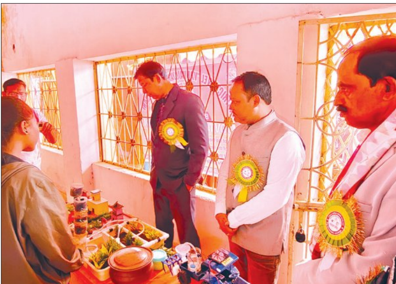
ନବରଙ୍ଗପୁର ଜିଲ୍ଲାସ୍ତରୀୟ ବିଜ୍ଞାନ ଓ ଶିଶୁ ବୈଜ୍ଞାନିକ ପ୍ରଦର୍ଶନୀ

କୋରାପୁଟ, ୧୬/୧୨ (ସମ୍ପାଦକ): ଯାଶ୍ରୀଶ୍ରୀଙ୍କ ଜନ୍ମଦିନ ବା ବଡ଼ଦିନ ପାଳିତ ହେବା ପୂର୍ବରୁ ଖୁସିରେ ଖ୍ରୀଷ୍ଟିଆନ ଧର୍ମର ଯୁବକ ଯୁବତୀ ନିଜକୁ ସାନ୍ତାକୁଳ ବେଶରେ ସଜାଇ ସହର ପରିକ୍ରମା କରିଛନ୍ତି। ମଙ୍ଗଳବାର ରାତିରେ କୋରାପୁଟରେ ସ୍ଥାନୀୟ ମିଶନ କମ୍ପାଉଣ୍ଡର ଶତାଧିକ ଯୁବକ ଯୁବତୀ ସାନ୍ତାକୁଳ ବେଶରେ ନାଟଗୀତ ସହ କୋରାପୁଟ ସହର ପରିକ୍ରମା କରି ପ୍ରଭୁ ଯାଶ୍ରୀଶ୍ରୀଙ୍କ ଆଗମନର ବାର୍ତ୍ତା ଦେଇଥିଲେ। ସେହିପରି ଜୟପୁର, ସୁନାବେଡ଼ା, ସେମିଲିଗୁଡ଼ା, ଭୁମ୍ଭୁରିପୁରରେ ମଧ୍ୟ ପ୍ରାୟ ଖ୍ରୀଷ୍ଟମାସ ପାଳନ ଆରମ୍ଭ ହୋଇଛି। ପ୍ରତ୍ୟେକ ଦିନ ଚର୍ଚ୍ଚ ରୂପରେ ବିଭିନ୍ନ ପ୍ରକାର ପ୍ରତିଯୋଗିତା କରାଯାଉଥିବାବେଳେ ପ୍ରତି ସନ୍ଧ୍ୟାରେ ସାଂସ୍କୃତିକ କାର୍ଯ୍ୟକ୍ରମମାନ ଆୟୋଜିତ ହେଉଛି।