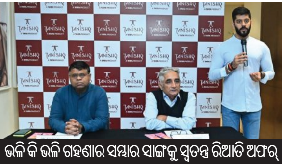
ଭଳି କି ଭଳି ଗହଣାର ସମ୍ପର୍କ ସାଜିବାକୁ ସ୍ୱତନ୍ତ୍ର ରିଆଡି ଅଫର୍

କଟକ, ୧୦/୧୨ (ସମ୍ବିଧ): ଦେଶର ଅନ୍ୟତମ ବୃହତ୍ ଗହଣା ରିଟେଲ୍ ଗ୍ରାଣ୍ଟ ତନିୟା ଏହାର କଟକ କ୍ୟାଣ୍ଟନ୍ମେଣ୍ଟ ରୋଡ଼ ଷ୍ଟୋରର ୨୦ତମ ବର୍ଷ ପୂର୍ତ୍ତୀ ପାଳନ କରୁଛି । ଭରସା, କାରିଗରୀ ଏବଂ କାଳକ୍ରମେ ସୁନ୍ଦରତାର ପରିଚୟ ହେଉଛି ତନିୟା । କଟକରେ ହୁଇ ଦଶନ୍ଧି ଧରି ଏହା ଗ୍ରାହକଙ୍କ ଭରସା ପାଇଛି । ତନିୟା ଗ୍ରାମ ପିଛା ସୁନା ଗହଣା ଉପରେ ୬୦୦ ଟଙ୍କା ପର୍ଯ୍ୟନ୍ତ ରିହାତି ପ୍ରଦାନ କରୁଛି । ସେହିଭଳି ହାରା ମୂଲ୍ୟ ଉପରେ ୨୦% ପର୍ଯ୍ୟନ୍ତ ରିହାତି ଏବଂ ଯେକୌଣସି ଗହଣା ଷ୍ଟୋରକୁ କିଣାଯାଇଥିବା କୌଣସି ବ୍ୟାଚ୍‌ରେଟ୍‌ର ପୁରୁଣା ସୁନା ବଦଳରେ ଶତପ୍ର