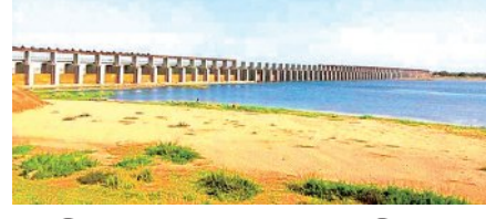
ଛତିଶଗଡ଼ ସହ ଜଳବିବାଦ