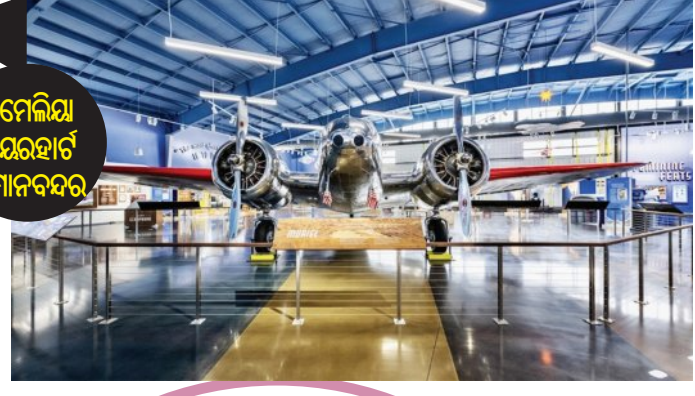
ଅମେଲିୟା ଇନ୍ଦରହାର୍ଟ ବିମାନବନ୍ଦର