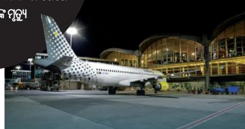
କୋର୍ଡାନ ଆଲିୟା ବାହାଉଦ୍ଦିନ୍ ବିମାନବନ୍ଦର