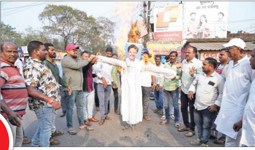
ଦଳ ପକ୍ଷରୁ ସ୍ଵାଧୀନ ବିଜୁ ପଟ୍ଟନାୟକ କଲ୍ୟାଣ ମଣ୍ଡଳରେ ଏକ ସାମ୍ବାଦିକ ସମ୍ମିଳନୀ ଆୟୋଜିତ ହୋଇଛି । ଦକ୍ଷିଣ ଦେଶୀୟ ଅଭିଯୋଗ କରିଛନ୍ତି