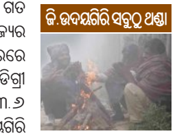
ଜି.ଉଦୟଗିରି ସବୁଠୁ ଥଣ୍ଡା

■ ଭୁବନେଶ୍ୱର, ୨୯ ଡିସେମ୍ବର: ରାଜ୍ୟରେ ଅସହ୍ୟ ଶୀତ ଜାରି ରହିଛି। ନୂଆବର୍ଷ ପର୍ଯ୍ୟନ୍ତ ଏପରି ସ୍ଥିତି ଲାଗି ରହିବ। ଗତ ୨୪ ଘଣ୍ଟାରେ ରାଜ୍ୟର ୧୫ଟି ସହରରେ ତାପମାତ୍ରା ୧୦ ଡିଗ୍ରୀ ତଳେ ରହିଛି। ୩.୬ ଡିଗ୍ରୀ ସହ ଜି.ଉଦୟଗିରି ପୁଣିଥରେ ରାଜ୍ୟର ସବୁଠୁ ଥଣ୍ଡା ସହର ପାଲଟିଛି। ସୁଇଚ୍‌ଡିନ ହେବ ଜି.ଉଦୟଗିରିରେ ପାରଦ ୩ ଡିଗ୍ରୀକୁ ଖସି ଆସିଥିବାରୁ ଏଠାରେ ପ୍ରବଳ ଶୀତ ଅନୁଭୂତ ହେଉଛି। ସେମିଳଗୁଡ଼ାରେ ୫.୨, ପୁଲବାଣୀରେ ୫.୫, ଦାରିଙ୍ଗବାଡ଼ିରେ ୬, କୋରାପୁଟରେ ୬.୫, ଝାରସୁଗୁଡ଼ାରେ ୬.୫, ରାଉରକେଲାରେ ୬.୬, ଅନୁଗୋଳରେ ୮, ନବରଙ୍ଗପୁରରେ ୮.୬, କିରୋଲରେ ୮.୬, ଭାବନାପାଟଣାରେ ୯, ବଲାଙ୍ଗିରରେ ୯.୫, ସୁନ୍ଦରଗଡ଼ରେ ୯.୫ ଏବଂ ସୋନପୁର ଓ କେନ୍ଦୁଝରରେ ୯.୮ ଲେଖାଏଁ ରେକର୍ଡ ହୋଇଛି। ଅପରପକ୍ଷେ, ୬.୫ ଡିଗ୍ରୀ ସହ ଝାରସୁଗୁଡ଼ାରେ ଗତ ୧୫ ବର୍ଷରେ (୨୦୧୦ରୁ ଏଯାବତ୍) ମଧ୍ୟରେ ଡିସେମ୍ବର ମାସରେ ଏହା ଚତୁର୍ଥ ସର୍ବନିମ୍ନ। ମୁଖ୍ୟ-୭