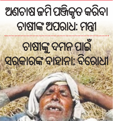
ଯେଉଁ ଚାଷୀମାନେ ଚାଷ ଜମି ଭାବେ ଦର୍ଶାଇଛନ୍ତି, ସେମାନଙ୍କୁ ନୋଟିସ୍ କରିବାକୁ ନିଷ୍ପତ୍ତି ହୋଇଛି। ଧାନ କିଣା ପ୍ରକ୍ରିୟାରେ ମିଥ୍ୟା ତଥ୍ୟ ଦେଇଥିବା ଚାଷୀଙ୍କୁ କାରଣ ଦର୍ଶାଏ ନୋଟିସ୍ ଜାରି କରିବ।

■ ଭୁବନେଶ୍ୱର, ୨୯ ଡିସେମ୍ବର: ମଣ୍ଡି ଅବ୍ୟବସ୍ଥା, ଧାନ କିଣାରେ ବିରୁଦ୍ଧକୁ ନେଇ ଚାଷୀ ସରକାରଙ୍କ ଉପରେ ଖରାପ ମତାମତ। ବିଭିନ୍ନ ସ୍ଥାନରେ ଚାଷୀମାନେ ରାସ୍ତା ଅବରୋଧ କରିବା ସହ ଆନ୍ଦୋଳନ ଚଳାଇଛନ୍ତି। ଏହି ସମୟରେ ଚାଷୀଙ୍କୁ ଦମନ କରିବାକୁ ସରକାର ଆରମ୍ଭ କରିଛନ୍ତି ପାଇଁ ଯୋଜନା। ରାଜ୍ୟର ବିଭିନ୍ନ ଜିଲ୍ଲାରେ ଧାନ କିଣାରେ ଅବ୍ୟବସ୍ଥା ଯୋଗୁଁ ସରକାରଙ୍କ ଅନୁଧ୍ୟାନ କରାଯାଉଛି। ଚାଷୀଙ୍କ ଏହି ଆକ୍ରମଣମୁକ ପଛକୁ ପ୍ରତିହତ କରିବା ପାଇଁ ସରକାର ଛାଡ଼ିଛନ୍ତି 'ନୋଟିସ୍' ଅର୍ଥାତ୍ ଧାନ ବିକ୍ରି ନିମନ୍ତେ ଚାଷୀମାନେ ଯେଉଁ ଚାଷ ଜମିକୁ ପଞ୍ଜିକରଣ କରିଛନ୍ତି, ତାହାକୁ ଜାଲ ବା ତୁଟିପୁର୍ଣ୍ଣ ବୋଲି ଦର୍ଶାଇ ସରକାର ଚାଷୀଙ୍କ ଉପରେ ଦାବି ସାଧୁବାକୁ ଯୋଜନା କରିଛନ୍ତି। ରାଜ୍ୟ ସାଧାରଣ ବନ୍ଧନ ନିଗମ ପକ୍ଷରୁ ସମବାୟ ସଂସ୍ଥାର ରେକର୍ଡକୁ ଏ ସମ୍ପର୍କରେ ଚିଠି ଲେଖାଯାଇଛି। ମୁଖ୍ୟତଃ ଅଣଚାଷ ଜମିକୁ