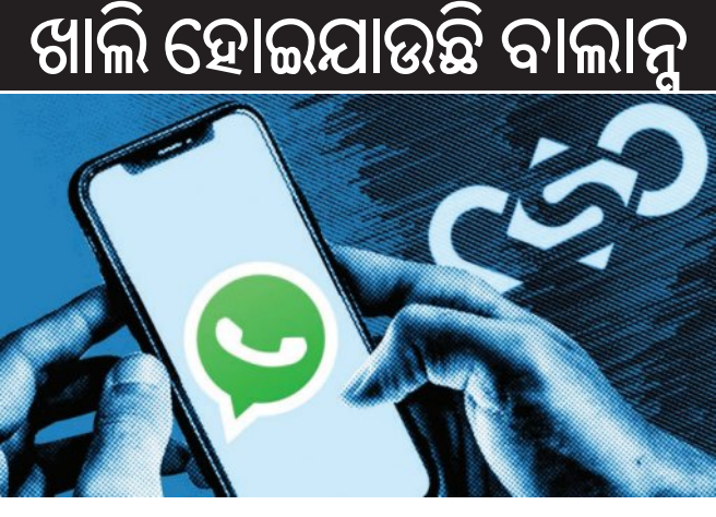
ସର୍ବକ୍ରିୟ ଦେଖିପାରିବେ ଏବଂ ବ୍ୟବହାର କରିପାରିବେ। ଆପଣଙ୍କ ଡିଭାଇସ୍ ଲିଙ୍କ୍ ହେବା ପରେ ହ୍ୟାକର୍‌ମାନେ ପୁରୁଣା ମେସେଜ୍ ପଢ଼ିପାରିବେ, କାହାକୁ ମେସେଜ୍ ପଠାଇପାରିବେ, ଫଟୋ, ଭିଡିଓ ଏବଂ ଉପର ସମସ୍ତ ଦେଖିପାରିବେ ଏବଂ ଆପଣଙ୍କ ଯୋଗାଯୋଗ ଏବଂ ଗୋପ୍ୟତା ମେସେଜ୍ ମଧ୍ୟ ପଠାଇପାରିବେ। ସବୁଠାରୁ ଗୁରୁତ୍ୱପୂର୍ଣ୍ଣ କଥା ହେଉଛି ବ୍ୟବହାରକାରୀ ଏହା ବିଷୟରେ କିଛି ଜାଣିନାହାନ୍ତି, କାରଣ ଏହା ସବୁ ପୃଷ୍ଠଭୂମିରେ ଘଟେ।