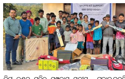
କିଟ୍ ବଣ୍ଟନ ସହିତ ସମ୍ପ୍ରଦାୟ ସ୍ତରୀୟ ପୁସ୍ତକ ଏବଂ କ୍ରିକେଟ୍ ଗୁମ୍‌ମେଣ୍ଟ ନିୟମିତ ଭାବରେ ଆୟୋଜନ କରାଯିବ। ସହ ଯୁବ ଖେଳାଳିମାନଙ୍କୁ ପ୍ରତିଯୋଗିତା କରିବା, ଦକ୍ଷତା କାର୍ଯ୍ୟ ନିର୍ମାଣ କରିବା ଏବଂ ସେମାନଙ୍କର କ୍ରୀଡା ଦକ୍ଷତା ବିକାଶ କରିବା ପାଇଁ ଏକ ସମ୍ପର୍କିତ ପ୍ରୋଗ୍ରାମ ପ୍ରଦାନ କରୁଛି। ବେଦାନ୍ତ ଆଲୁମିନିୟମ୍‌ର ସିଲ୍‌ଓ ରାଜ୍ୟାଧିକାରୀଙ୍କୁ ମଧ୍ୟରେ ଅଧିକ ଅଂଶଗ୍ରହଣକୁ ଉତ୍ସାହିତ କରିବା ସହିତ ଦକ୍ଷତା କାର୍ଯ୍ୟ ଏବଂ କ୍ରୀଡା ମନୋଭାବ ସୃଷ୍ଟି କରିବାକୁ ଲକ୍ଷ୍ୟ ରଖୁଛି।

ଭୁବନେଶ୍ୱର, ୨୩ ଡିସେମ୍ବର: ବେଦାନ୍ତ ଆଲୁମିନିୟମ୍ ଓଡ଼ିଶାର ଜାମଖାନି, ଘୋରଗଡ଼ ପାଇଁ ଏବଂ କୁରାଲୋଇ ଅଞ୍ଚଳରେ ୧୦୦୦ ରୁ ଅଧିକ ଯୁବକଙ୍କୁ କ୍ରୀଡା ଉପକରଣ (କିଟ୍) ବଣ୍ଟନ କରିଛି। ଏହି ପଦକ୍ଷେପର ଉଦ୍ଦେଶ୍ୟ ସ୍ଥାନୀୟ ସମ୍ପ୍ରଦାୟମାନଙ୍କ ମଧ୍ୟରେ କ୍ରୀଡା କାର୍ଯ୍ୟକ୍ରମକୁ ପ୍ରୋତ୍ସାହନ ଦେବା ସହ କ୍ରୀଡାମନୋଭାବର ସଂସ୍କୃତିକୁ ପୋଷଣ କରିବା। କାର୍ଯ୍ୟକ୍ରମର ଅଂଶ ଭାବରେ ୨୫ ଟି ଗ୍ରାମର କ୍ରୀଡା କିଟ୍ ଏବଂ ଷ୍ଟୁଡେଣ୍ଟଙ୍କୁ ପୁସ୍ତକ, କ୍ରିକେଟ୍, ଭଲିବଲ୍, ବ୍ୟାଡମିଣ୍ଟନ୍, କ୍ୟାମରା ଏବଂ ଯୋଗ୍ୟମାଟ୍ ପାଇଁ କ୍ରୀଡା କିଟ୍ ପ୍ରଦାନ କରାଯାଇଛି।