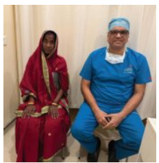
ଏହା ପୂର୍ବ ଭାରତର ଉନ୍ନତ ହାର୍ଟ ସର୍ଜରୀ ଚିକିତ୍ସା କ୍ଷେତ୍ରରେ ଏକ ଗୁରୁତ୍ୱପୂର୍ଣ୍ଣ ମାଲକ୍ଷ୍ମଣ୍ଡ ବୋଲି କୁହାଯାଇଛି। ବାର୍ଦ୍ଧି ୬୨-୬୩ ବର୍ଷୀୟ ମହିଳାଙ୍କୁ ଏହା ଉପରେ ସର୍ଜରୀ କରାଯାଇଥିଲା। ଏହା ପୂର୍ବ ଭାରତର ଉନ୍ନତ ହାର୍ଟ ସର୍ଜରୀ ଚିକିତ୍ସା କ୍ଷେତ୍ରରେ ଏକ ଗୁରୁତ୍ୱପୂର୍ଣ୍ଣ ମାଲକ୍ଷ୍ମଣ୍ଡ ବୋଲି କୁହାଯାଇଛି।

ଭୁବନେଶ୍ୱର, ୨୩ ଡିସେମ୍ବର: ମଣିପାଲ୍ ହୃଦ୍‌ଚିକିତ୍ସା ଉନ୍ନତକରଣ ପାଇଁ ଏକ ଅତ୍ୟନ୍ତ ଜଟିଳ ଟ୍ରିପଲ୍ ଭାଲଭ୍ ରିଭ୍ୟୁସନ୍‌ରେ ହାର୍ଟ ସର୍ଜରୀ ସମ୍ପର୍କରେ ସହ କରାଯାଇଛି। ଏହି ସର୍ଜରୀ ଗ୍ୟାଙ୍ଗ୍‌ର ୪୫ ବର୍ଷୀୟ ଜଣେ ମହିଳାଙ୍କ ଉପରେ କରାଯାଇଥିଲା। ଏହା ପୂର୍ବ ଭାରତର ଉନ୍ନତ ହାର୍ଟ ସର୍ଜରୀ ଚିକିତ୍ସା କ୍ଷେତ୍ରରେ ଏକ ଗୁରୁତ୍ୱପୂର୍ଣ୍ଣ ମାଲକ୍ଷ୍ମଣ୍ଡ ବୋଲି କୁହାଯାଇଛି। ବାର୍ଦ୍ଧି ୬୨-୬୩ ବର୍ଷୀୟ ମହିଳାଙ୍କୁ ଏହା ଉପରେ ସର୍ଜରୀ କରାଯାଇଥିଲା। ଏହା ପୂର୍ବ ଭାରତର ଉନ୍ନତ ହାର୍ଟ ସର୍ଜରୀ ଚିକିତ୍ସା କ୍ଷେତ୍ରରେ ଏକ ଗୁରୁତ୍ୱପୂର୍ଣ୍ଣ ମାଲକ୍ଷ୍ମଣ୍ଡ ବୋଲି କୁହାଯାଇଛି। ବାର୍ଦ୍ଧି ୬୨-୬୩ ବର୍ଷୀୟ ମହିଳାଙ୍କୁ ଏହା ଉପରେ ସର୍ଜରୀ କରାଯାଇଥିଲା। ଏହା ପୂର୍ବ ଭାରତର ଉନ୍ନତ ହାର୍ଟ ସର୍ଜରୀ ଚିକିତ୍ସା କ୍ଷେତ୍ରରେ ଏକ ଗୁରୁତ୍ୱପୂର୍ଣ୍ଣ ମାଲକ୍ଷ୍ମଣ୍ଡ ବୋଲି କୁହାଯାଇଛି।