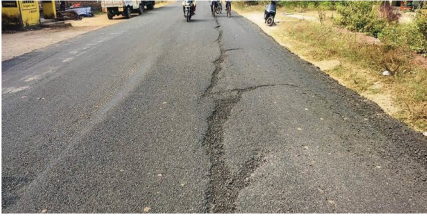
ପିରୁ ଉଠିଯାଉ ପୁଣି ପୂର୍ବ ବିଭାଗ କାର୍ଯ୍ୟଶୈଳୀ ସମେହ ଘେରରେ ଚାଲିଛି। ପୂର୍ବ ବିଭାଗର କାର୍ଯ୍ୟଶୈଳୀ ଏବେ ସମେହ ଘେରରେ ଚାଲିଛି।

ତିରିଆ, ୨୩।୧୨ (ସମ୍ପାଦକ): କଟକ ଜିଲ୍ଲା ତିରିଆ ବ୍ଲକରେ ପୂର୍ବ ବିଭାଗର କାର୍ଯ୍ୟଶୈଳୀ ଏବେ ସମେହ ଘେରରେ। ରାଜ୍ୟ ସରକାରଙ୍କ ତତ୍ତ୍ୱାବଳୀରେ କୋଟି କୋଟି ଟଙ୍କା ବ୍ୟୟରେ କଟକ-ନରସିଂହପୁର ୬୫ ନମ୍ବର ରାଜ୍ୟ ରାଜପଥର ନବୀକରଣ କାର୍ଯ୍ୟ ଚାଲିଥିବା ବେଳେ,