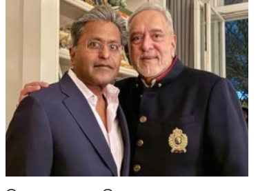
ଡିକାଉନ ମନୋବିରାଜ ଷ୍ଟୋରୀର ବ୍ୟବସାୟ ଲଳିତ ମୋଦି ଏବଂ ବିଜୟ ମାଲ୍ୟାଙ୍କ ଯୋଗରେ ଧୂମଧାମ୍ ରେ ପାର୍ଟି ମନାଉଛନ୍ତି। ଏଥିରେ ଭିତ୍ତିରେ ଲଳିତ ମୋଦୀ କହୁଛନ୍ତି ଯେ, 'ହମ୍ ଦୋ ଭଗୋଡେ ହେ, ଭାରତ କେ ସବେ ସବେ କରୋଗେ'।

ଦୁଇ ପଳାତକଙ୍କ ଫଟୋ ଭାଇରାଲ୍ ନୂଆଦିଲ୍ଲୀ, ୨୩ ଡିସେମ୍ବର: ଦେଶର ଦୁଇ ପଳାତକ ବ୍ୟବସାୟ ଲଳିତ ମୋଦି ଏବଂ ବିଜୟ ମାଲ୍ୟା ଏବେ ଏକାଠି। ଭାରତରେ ପଳାତକ ଯୋଗେ ଏହି ଦୁଇ ବଡ଼ ବେସରାଜ୍ କ୍ଷଣିକରେ ଏକାଠି ପାର୍ଟି ମନାଉଥିବାର ଦେଖାଯାଇଛି। ସୋସିଆଲ ମିଡିଆରେ ଏହି ପାର୍ଟିର ଫଟୋ ଏବେ ଭିତ୍ତି ଓ ଏବେ ଭାଇରାଲ୍। ଅବଧର ଥିଲା ବିଜୟ ମାଲ୍ୟାଙ୍କ ଜନ୍ମଦିନ। ଉଭୟଙ୍କ ଯୋଗରେ ଧୂମଧାମ୍ ରେ ପାର୍ଟି ମନାଉଛନ୍ତି। ଏଥିରେ ଭିତ୍ତିରେ ଲଳିତ ମୋଦୀ କହୁଛନ୍ତି ଯେ, 'ହମ୍ ଦୋ ଭଗୋଡେ ହେ, ଭାରତ କେ ସବେ ସବେ କରୋଗେ'। ଲଳିତ ମୋଦିଙ୍କ ବେକଗ୍ରେଣ୍ଡ୍ ଷ୍ଟୋରୀର ବାସ୍ତବ୍ୟରେ ଆୟୋଜିତ ଏହି ପାର୍ଟିରେ ବାୟୋକମ୍ ପ୍ରତିଷ୍ଠାତା କିରଣ ମଜୁମଦାର-ଶ, ଅଭିନେତା ଜୟଦିପ୍ ଏଲ୍‌ବା ଏବଂ ପ୍ୟାଣ୍ଟ