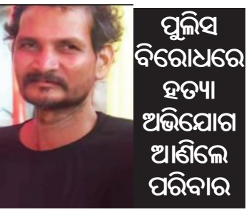
ପୁଲିସ୍ ବିରୋଧରେ ହତ୍ୟା ଅଭିଯୋଗ ଆଣିଲେ ପରିବାର

■ ବାଣପୁର, ୧୪।୧୨ (ସମ୍ବାଦ): ଖୋର୍ଦ୍ଧା ଜିଲ୍ଲା ବାଣପୁର ଥାନା ଅଞ୍ଚଳରେ ଚୋରା ମଦ ବିକ୍ରି କରୁଥିବା ଅଭିଯୋଗରେ ଜଣେ ଅଭିଯୁକ୍ତଙ୍କୁ ବାଣପୁର ପୁଲିସ୍ ଥାନାରେ ରାତିରେ ଉଠାଇ ନେଇ ଥାନା ହାଜତରେ ରଖି ପଚରା ଉତ୍ତରା କରୁଥିବା ବେଳେ ରବିବାର ଉକ୍ତ ଅଭିଯୁକ୍ତଙ୍କ ମୃତ୍ୟୁ ଘଟିଛି। ଅଭିଯୁକ୍ତଙ୍କ ପରିବାର ଲୋକେ ପୁଲିସ୍ ବିରୋଧରେ ହତ୍ୟା ଅଭିଯୋଗ ଆଣିଛନ୍ତି।