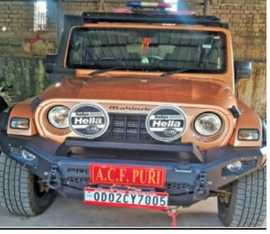
ବିଶେଷଜ୍ଞମାନେ ବିଭାଗର ଗାଡ଼ିକିଣାକୁ ନେଇ ବିଭାଗକୁ ଅନୁମତି ନିବେଶ କରିଛନ୍ତି। ବନାମାତ୍ରା ଓ ଜଙ୍ଗଲ ସମ୍ପର୍କରେ ଜ୍ଞାନ ରଖିଥିବା ବିଶେଷଜ୍ଞମାନେ କହିଛନ୍ତି ଯେ ଥର୍ ଗାଡ଼ିରେ ଡ୍ରାଇଭରଙ୍କ ବ୍ୟତୀତ ମାତ୍ର ୩ ଜଣ ଲୋକେ ବସିବେ। ସେହିପରି ଗାଡ଼ିରେ