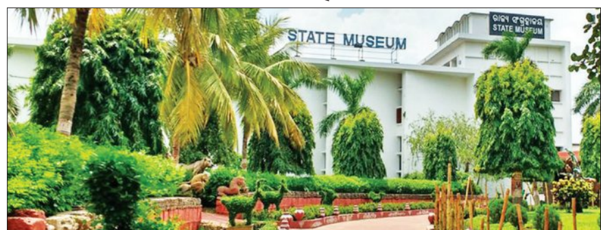
ରାଜ୍ୟ ସଂଗ୍ରହାଳୟର ପୂର୍ଣ୍ଣ ପାଳନ କରାଯିବ। ସାଙ୍ଗକୁ ଚକ କରାଯିବ। ଏହି ଉପଲକ୍ଷେ ସଂଗ୍ରହାଳୟରେ ରହିଥିବା ବିଭିନ୍ନ ରଥ ଚକରେ ପୁଷ୍ପ ଅର୍ପଣ କରାଯିବ।