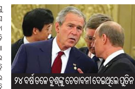
୨୪ ବର୍ଷ ଠଳେ ବୁଶ୍ଙ୍କୁ ଚେତାବନା ଦେଇଥିଲେ ପୂର୍ତ୍ତିନ

ନ୍ୟୁଆର୍କ, ୨୬।୧୨ (ଏକେନ୍ଦ୍ରି): ପାକିସ୍ତାନର ପରମାଣୁ ଅସ୍ତ୍ର ଯାତା ବିକ୍ଷପ୍ରତି ବିପଦ ସୃଷ୍ଟି କରିଛି। ଏନେଇ ବିଶ୍ୱ ନେତୃତ୍ୱରେ ବାହାମାସ ପରୋକ୍ଷରେ ଚର୍ଚ୍ଚା ଓ ଆଲୋଚନା ହୋଇ ଆସୁଛି। କିନ୍ତୁ ୨୪ ବର୍ଷ ଠଳେ ରୁଷିଆର ରାଷ୍ଟ୍ରପତି ଭୁଦିନିର ପୂର୍ତ୍ତିନ ଏ ନେଇ ଚିନ୍ତା ପ୍ରକଟ କରିଥିବା କଥା ଏବେ ସାମ୍ବାକୁ ଆସିଛି। ୨୦୦୧ରୁ ୨୦୦୮ ମଧ୍ୟରେ ଦୁଇ ଦେଶ ମଧ୍ୟରେ ହୋଇଥିବା କଥାବାର୍ତ୍ତା ଦଳିଲରୁ ଏହି ସୂଚନା ମିଳିଛି। ସୂଚନା ସାଧନତା ଆଇନ ଅଧୀନରେ ଆମେରିକୀୟ ଜାତୀୟ ସୁରକ୍ଷା ଅଭିଲେଖାଗାର ଦ୍ୱାରା ଏହି ଦଳିଲଗୁଡ଼ିକ ପ୍ରକାଶିତ ହେବା ପରେ ଏହି ତଥ୍ୟ ସାମ୍ବାକୁ ଆସିଛି। ପରମାଣୁ ଅସ୍ତ୍ରଗଣ୍ଠରେ ସଜିତ ଏକ ଅଗଣତାନ୍ତ୍ରିକ ଦେଶର ଅସ୍ତିତ୍ୱ ବିଶ୍ୱ ସୁରକ୍ଷା ପାଇଁ ବିପଦ ସୃଷ୍ଟିକରିପାରେ ବୋଲି ସେତେବେଳେ ପୂର୍ତ୍ତିନ ହୃଦୟଙ୍ଗମ କରିଥିଲେ। ପୂର୍ତ୍ତିନ ୨୦୦୧ରେ ଆମେରିକାର ତତ୍କାଳୀନ ରାଷ୍ଟ୍ରପତି ଜର୍ଜ୍ଜ୍ ତତ୍ତ୍ୱେ ବୁଶ୍ଙ୍କୁ ନିଜର ପ୍ରଥମ ସାକ୍ଷାତରେ ପାକିସ୍ତାନକୁ