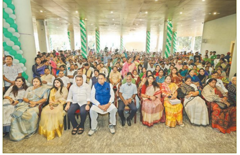
ଶୁକ୍ରବାର ଶଙ୍କ ଭବନରେ ବିଜେଡିର ୯ତମ ପ୍ରତିଷ୍ଠା ଦିବସ ପାଳନ ଅବସରରେ ଦଳର ସଭାପତି ନବୀନ ପଟ୍ଟନାୟକଙ୍କୁ ନେତା ଓ କର୍ମୀମାନେ ସ୍ୱାଗତ କରୁଛନ୍ତି