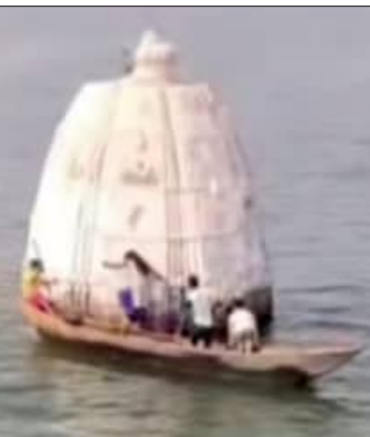
କାଣିଥିବାରୁ ଅକାତକାତ ପାଣିରେ ପ୍ରାଣ ବିକଳରେ ପହଞ୍ଚି ପହଞ୍ଚି ନିକଟରେ ଥିବା ଏକ ଜଳମଗ୍ନ ହରିହର ମନ୍ଦିର ପିଠୁକୁ