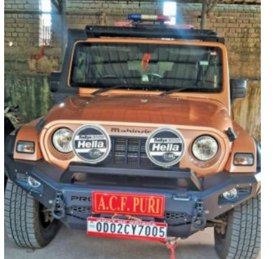
୧୪ ଲକ୍ଷର ଗାଡ଼ିରେ ୧୦ ଲକ୍ଷ ଟଙ୍କା ଖର୍ଚ୍ଚକରି ହୋଇଥିଲା ମୋଡ଼ିଫିକେସନ୍