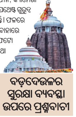
ବଡ଼ଦେଉଳର ସୁରକ୍ଷା ବ୍ୟବସ୍ଥା ଉପରେ ପ୍ରଶ୍ନବାଚୀ

■ ପୁରୀ, ୧୭।୧୨ (ସମ୍ବାଦ): ଶ୍ରୀମନ୍ଦିର ଭିତରକୁ ମୋବାଇଲ ଫୋନ୍, କ୍ୟାମେରା ନେବା ଉପରେ କଟକଣା ରହିଛି। ସୁରକ୍ଷା ଦୃଷ୍ଟିକୋଣରୁ ଏହାର ଯଥେଷ୍ଟ ଗୁରୁତ୍ୱ ରହିଥିଲେ ହେଁ ଏହି କଟକଣାକୁ ଅନେକ ନାଲିଆଖି ଦେଖାଉଛନ୍ତି। ଫଳରେ ବିଭିନ୍ନ ସମୟରେ ଶ୍ରୀମନ୍ଦିର ଭିତରର ସମ୍ପୂର୍ଣ୍ଣଦର୍ଶନ ଫଟୋ ବାହାରେ ବୁଲୁଛି। ଏବେ ଗର୍ଭଗୃହ ଏବଂ ଗର୍ଭସୂତ୍ରାସନରେ ମହାପ୍ରଭୁଙ୍କ ଫଟୋ ଏ ମୋବାଇଲରୁ ସେ ମୋବାଇଲକୁ ଘୁରି ବୁଲୁଛି। ଗୁରୁତ୍ୱପୂର୍ଣ୍ଣ କଥା ହେଉଛି ଶ୍ରୀମନ୍ଦିରକୁ ନେଇ କୌଣସି କଟକଣା କିମ୍ବା ନିୟମ ହେଲେ କିଛିଦିନ ଧରଣର ହୋଇଥାଏ। ଧାରଣ ଧାରଣ ଚା' ଉପରୁ ନଜର ହଟିବା ପରେ ପୁଣି ପୂର୍ବାବସ୍ଥାକୁ ସ୍ଥିତି ପେରିଆସେ। ମୋବାଇଲ କଟକଣା ବର୍ତ୍ତମାନ ସେହିଭଳି ସ୍ଥିତିରେ ରହିଥିବା ଚର୍ଚ୍ଚା ହେଉଥିବା ବେଳେ ବଡ଼ ଦେଉଳର ସୁରକ୍ଷା ବ୍ୟବସ୍ଥା ଉପରେ ପ୍ରଶ୍ନବାଚୀ ସୃଷ୍ଟି