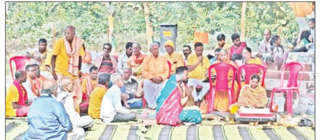
ପୋଲସରା, ୨୯।୧୨(ସମ୍ବିଧ): ପୋଲସରା ବ୍ଲକ ମଥୁରା ପଞ୍ଚାୟତ ଅନ୍ତର୍ଗତ ଶରଣ ଶ୍ରୀକ୍ଷେତ୍ର ମାରଦା ପୀଠରେ ମାରଦା ମନ୍ଦିରର ୨୯୩ ତମ ପ୍ରତିଷ୍ଠା ଉତ୍ସବ ପାଳିତ

ହୋଇଯାଇଛି। ଗାୟତ୍ରୀ ପରିବାର, ନିରଞ୍ଜନ ପ୍ରଧାନ ମେମୋରିୟଲ ଚାରିଟେବୁଲ ଟ୍ରଷ୍ଟ ଓ ମାରଦା ମହିମା ପ୍ରଚାର ସମିତିର ମିଳିତ ଆନୁକୂଲ୍ୟରେ ଏହି ଉତ୍ସବ ଆୟତ୍ତ ହୋଇଛି।