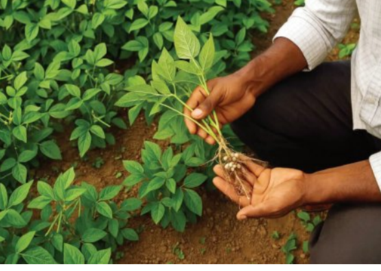
ବିଭିନ୍ନ ଭୂଖଣ୍ଡର ଉତ୍ପାଦକତା

ଡାଲି ଏକ ପୁଷ୍ଟିସାର ଜାତୀୟ ଖାଦ୍ୟ। ଡାଲି ଜାତୀୟ ଫସଲ ମଧ୍ୟରେ ମୁଗ, ବିରି, ହରଡ଼, ଚଣା, ବୁଟ, ମଟର, କୋଳଥ ଆଦି ମୁଖ୍ୟ ହୋଇଥାଏ। ଧାନ ପରେ ରାଜ୍ୟରେ ଦ୍ୱିତୀୟ ସର୍ବାଧିକ ଚାଷ କରାଯାଉଥିବା ଫସଲ ହେଉଛି ଡାଲି ଜାତୀୟ ଫସଲ। ହେଲେ ଏବେ ଡାଲି ଜାତୀୟ ଖାଦ୍ୟ ଉତ୍ପାଦନ କମୁଛି। ଡାଲି ଜାତୀୟ ଫସଲରେ ସମନ୍ୱିତ ସାର ପରିଚାଳନା କରା ନ ଯିବା ଏହାର ଏକ ପ୍ରମୁଖ କାରଣ। ତେଣୁ ଡାଲି ଉତ୍ପାଦନ ବୃଦ୍ଧି ପାଇଁ ଫସଲରେ ଜୀବାଣୁସାର ଓ ଅଣୁସାରର ଉପଯୋଗ ନିହାତି ଆବଶ୍ୟକ।