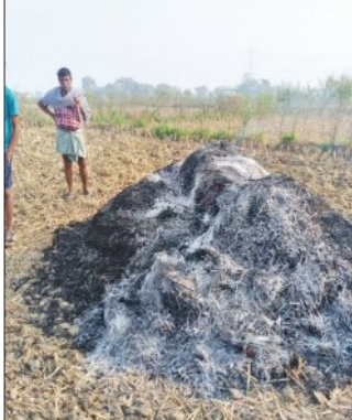
ସାନଖେମୁଣ୍ଡି, ୨୯।୧୨(ସମ୍ବିଧ): ଶତ୍ରୁତା କରି ଧାନ ଗଦାରେ ଲାଗାଇଲେ ଦୁର୍ଭୂତ। ନିଆଁରେ

ବର୍ଷ ତମାମର କଷ୍ଟ ଅର୍ଜିତ ଧାନ ଫସଲ ଜଳି ପୋଡି ପାଉଁଶ। ଗଞ୍ଜାମ ଜିଲ୍ଲା ସାନଖେମୁଣ୍ଡି ବ୍ଲକ ପାଟଣା ଧାନା ଅନ୍ତର୍ଗତ ଗୁଣାସାଗର ଗ୍ରାମର କର୍ମ ସାଙ୍ଗିଙ୍କ ବିଲରେ ଏଭଳି ଦୁର୍ଘଟଣା ଘଟିଥିଲା।