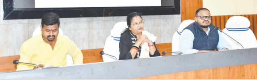
ଆସନ୍ତା ଜାନୁଆରୀ ପହିଲାଠାରୁ ଜନଗଣନା କାର୍ଯ୍ୟ ଆରମ୍ଭ ହେବାକୁ ଥିବାବେଳେ ଏହାପୂର୍ବରୁ ଅର୍ଥାତ୍ ଡିସେମ୍ବର ୩୧ତାଙ୍କୁ ପ୍ରଶାସନିକ ସ୍ତରରେ ତଦ୍ୱାରା ପ୍ରକାଶ ପାଇଛି।

ଗ୍ରେଟର ବ୍ରହ୍ମପୁର ପ୍ରତିଷ୍ଠା ପାଇଁ ବାଟ ଫିଟିଲା। ଦୂର ହେଲା ବନ୍ଧୁ। ବ୍ରହ୍ମପୁର ସହର ଉପକଣ୍ଠ ବଡ଼କୁଶସ୍ଥଳୀ ପଞ୍ଚାୟତର ସମ୍ପୂର୍ଣ୍ଣ ଅଂଶକୁ ଗ୍ରହଣ କରିବା ପାଇଁ ଗ୍ରେଟର ବ୍ରହ୍ମପୁର ପ୍ରତିଷ୍ଠା ପାଇଁ ବିଲ୍ ଏମ୍ବିଏର ସ୍ୱତନ୍ତ୍ର କର୍ପୋରେସନ ବୈଠକରେ ସମ୍ମତ ହୋଇଥିଲା।