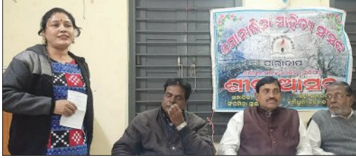
ସାହିତ୍ୟ ସର୍ବଜନ କରିବାର ଆବଶ୍ୟକତା ଅଛି ବୋଲି ମୋନାଲିସା ସାହିତ୍ୟ ସଂସଦର ଶୀତ ଆସରରେ ଉପସ୍ଥିତ ଅତିଥିମାନେ ମତ ପ୍ରକାଶ କରିଛନ୍ତି।

ପାରାଦୀପର ଅଗ୍ରଣୀ ସାହିତ୍ୟ ସଂସଦର ଶୀତ ଆସର ପ୍ରସ୍ତୁତ ହେଉଛି। ଶୀତ ଆସର ପ୍ରସ୍ତୁତ ହେଉଛି। ଶୀତ ଆସର ପ୍ରସ୍ତୁତ ହେଉଛି।