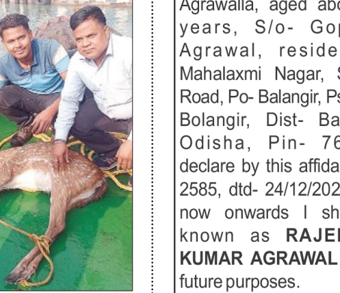
ପାରାଦୀପ ବନ୍ଦର ନିଷିଦ୍ଧାଞ୍ଚଳ ମଧ୍ୟରେ ଥିବା ଜେଟି ନିକଟସ୍ଥ ବୁଲୁଣ୍ଡି ହରିଣ ପହଞ୍ଚିଥିବା ବେଳେ ଉଦ୍ଧାର କରାଯାଇଛି। ଉଦ୍ଧାର ବୁଲୁ ହରିଣକୁ ଉଦ୍ଧାର କରାଯାଇ କୁଜଙ୍ଗ ବନ ବିଭାଗକୁ ହସ୍ତାନ୍ତର କରାଯାଇଛି।

ପାରାଦୀପ, ୨୪ତମ (ସମ୍ବିଧ): ପାରାଦୀପ ବନ୍ଦର ନିଷିଦ୍ଧାଞ୍ଚଳ ମଧ୍ୟରେ ଥିବା ଜେଟି ନିକଟସ୍ଥ ବୁଲୁଣ୍ଡି ହରିଣ ପହଞ୍ଚିଥିବା ବେଳେ ଉଦ୍ଧାର କରାଯାଇଛି। ଉଦ୍ଧାର ବୁଲୁ ହରିଣକୁ ଉଦ୍ଧାର କରାଯାଇ କୁଜଙ୍ଗ ବନ ବିଭାଗକୁ ହସ୍ତାନ୍ତର କରାଯାଇଛି। ସୁତରାଂ ପ୍ରାଚୀନ ସମୟରୁ ପାରାଦୀପ ବନ୍ଦର ନିଷିଦ୍ଧାଞ୍ଚଳ ମଧ୍ୟରେ ଥିବା ମେରାଇନ୍ ଡକ୍ରେ ବୁଲୁଣ୍ଡି ହରିଣ ପହଞ୍ଚିଥିବାର କିଛି ମେରାଇନ୍ ବିଭାଗର କର୍ମଚାରୀ ଦେଖିବାକୁ ପାଇଥିଲେ। ଖବରପାଇ ପାରାଦୀପ ବନ୍ଦର ସିଆଇଏସ୍‌ଏଫ୍‌ର ଅଧିକାରୀ ବିଭାଗ ଗୋଟିଏ ହରିଣକୁ ଉଦ୍ଧାର କରିଥିବା ବେଳେ ଅନ୍ୟ ହରିଣଟିକୁ ପାରାଦୀପ ମେରାଇନ୍ ବିଭାଗ ଚାରିଶା ବୋର୍ଡ କର୍ମଚାରୀ ମାନଙ୍କ ଦ୍ୱାରା ଉଦ୍ଧାର କରି ସିଆଇଏସ୍‌ଏଫ୍‌କୁ ହସ୍ତାନ୍ତର କରିଥିବା ଜଣାପଡ଼ିଛି। ତରବୋଟ୍ରେ ମାଷ୍ଟର ଓ ସାଇଲ୍ ସହାୟତାରେ ପୁଷ୍ପିକା ଦତ୍ତ ସାହାଯ୍ୟରେ କର୍ମଚାରୀମାନେ ବହୁ ପରିଶ୍ରମ କରି ହରିଣଟିକୁ କୁଜଙ୍ଗ ଆଣିବା ପରେ କୁଜଙ୍ଗ ବନବିଭାଗକୁ ବୁଲୁ ହରିଣ କୁ ହସ୍ତାନ୍ତର କରିଛନ୍ତି। ତେବେ ନିକଟସ୍ଥ କୌଣସି ଜଙ୍ଗଲ ବୁଲୁଣ୍ଡି ଚିକାଇ ଆସିଥିବା ପରେ ବୋଲି ଅନୁମାନ କରାଯାଇଛି। ଏହିପରି ବୁଲୁଣ୍ଡି ମଧ୍ୟ ବୁଲୁଣ୍ଡିର ସମସ୍ତ ହରିଣ ଉଦ୍ଧାର କରାଯାଇ ପରେ। ତେବେ ଉଦ୍ଧାର ହୋଇଥିବା ବୁଲୁ ହରିଣ କୁ କୁଜଙ୍ଗ ବନବିଭାଗ ପ୍ରଥମେ ଚିକିତ୍ସା କରିବା ପରେ ତତ୍ତ୍ୱା ଜଙ୍ଗଲରେ ଛାଡି ଦିଆଯିବ ବୋଲି ବନବିଭାଗ ତରଫରୁ ସୂଚନା ମିଳିଛି।