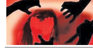
ସିଖି, ମହିଳା କାର୍ଯ୍ୟନିର୍ବାହୀ ମୁଖ୍ୟ ଓ ତାଙ୍କ ପତିଙ୍କ ବିରୋଧରେ ଅଭିଯୋଗ