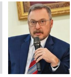
ଭାରତ ପାଇଁ ବାଂଲାଦେଶ ଗଠନ ହେଲା ସେହି ଭାରତ ବିରୋଧୀ ଖଡ଼ମୁଦ୍ରା କରାଯାଇଛି। ବିନା ଦୋଷରେ ଭାରତକୁ ବଦଳାଏ କରାଯାଇଛି। ଏବେ ବାଂଲାଦେଶରେ ଚାଲିଥିବା ହିନ୍ଦୁଙ୍କୁ ଗୁଣ୍ଡା ଚାବୁ ନିୟା କରିଛି। ବାଂଲାଦେଶରେ ରୁଷ ଆରମ୍ଭରୁ ଆଲୋଚନା କରାଯାଇଛି। ବିନା ଦୋଷରେ ଭାରତକୁ ବଦଳାଏ କରାଯାଇଛି। ଏବେ ବାଂଲାଦେଶରେ ଚାଲିଥିବା ହିନ୍ଦୁଙ୍କୁ ଗୁଣ୍ଡା ଚାବୁ ନିୟା କରିଛି। ବାଂଲାଦେଶରେ ରୁଷ ଆରମ୍ଭରୁ ଆଲୋଚନା କରାଯାଇଛି। ବିନା ଦୋଷରେ ଭାରତକୁ ବଦଳାଏ କରାଯାଇଛି। ଏବେ ବାଂଲାଦେଶରେ ଚାଲିଥିବା ହିନ୍ଦୁଙ୍କୁ ଗୁଣ୍ଡା ଚାବୁ ନିୟା କରିଛି।