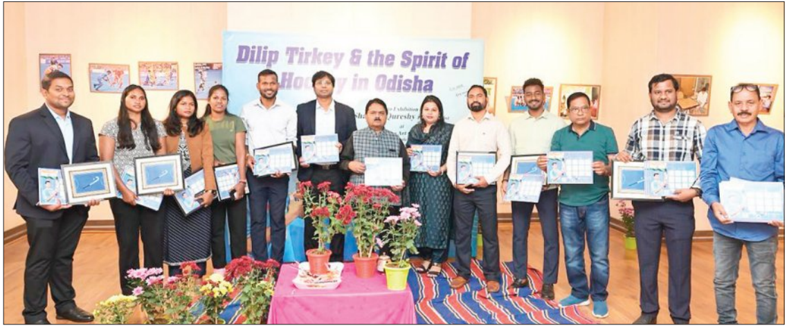
ଭୁବନେଶ୍ୱର କନିଜ ଆର୍ଟ୍‌ସ୍‌ କଲେଜରେ ମଙ୍ଗଳବାର କିଟ୍‌ଦଳରୁ ହିଲି ଖେଳାଳି ପଦ୍ମଶ୍ରୀ ଦିଲୀପ ଚିର୍କାଙ୍କ ଖେଳ ଜୀବନକୁ ନେଇ 'ଦିଲୀପ ଚିର୍କା ଆଣ୍ଡ୍‌ ଦି ସ୍ପିରିଟ୍‌ ଅଫ୍‌ ହିଲି ଇନ୍‌ ଓଡ଼ିଶା' ପତେ ପ୍ରଦର୍ଶନୀ ଉଦ୍‌ଘାଟିତ ହୋଇଯାଇଛି । ପତେ ସାମ୍ପାଦିକ ସମିତି କୁମ୍ଭାବଳୀ ଦ୍ୱାରା ଏହା ଆୟୋଜିତ ହୋଇଛି ।