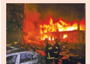
ସଂସଦରେ ଉପଦ୍ରବୀଙ୍କ ଲୁଟ୍‌ପାଟ୍, ସରକାରଙ୍କୁ ଦେଲେ ୨୪ ଘଣ୍ଟା କଷ୍ଟ ହିସାବୀୟ ପଛରେ ଆଇଏସ୍‌ଆଇର 'କାକା ସେଲ୍' ଭାରତ-ବାଂଲାଦେଶ ସେନାମୁଖ୍ୟଙ୍କ ଆଲୋଚନା