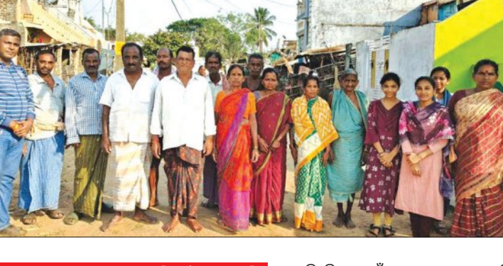
ମେଳି ବାନ୍ଧିଲେ ଅଞ୍ଚଳବାସୀ, ତୁରନ୍ତ ରାସ୍ତା ନିର୍ମାଣ ଦାବି

ଗୋଷାଣି ବୁକ୍ ଚାଟିପାଟି ପଞ୍ଚାୟତ ଆଡ଼ବା ଗ୍ରାମ୍ୟ ରାସ୍ତା ଶୋଚନୀୟ ହୋଇପଡ଼ିଛି । ଏହି ଗ୍ରାମ ପୂର୍ବ ବିଭାଗ ମୁଖ୍ୟରାସ୍ତା ଠାରୁ ମାତ୍ର ଏକ କିମି ଦୂରତାରେ ରହିଛି । ଗ୍ରାମ୍ୟ ଉନ୍ନୟନ ବିଭାଗ ଦ୍ଵାରା ନିର୍ମିତ ଏହି ୧ କିମି ରାସ୍ତା ଏବେ ମରଣାନ୍ତର ପାଲଟିଛି । ଅଣଓସାରିଆ ରାସ୍ତାର ବିଭିନ୍ନ ସ୍ଥାନ ଖାଲଖମା ଭରି ହୋଇଥିବା ବେଳେ ସ୍ଥାନେ ସ୍ଥାନେ ପିନ୍ଧୁ ଉଠିପଡ଼ିଛି । ସେହିପରି ରାସ୍ତାର ବିଭିନ୍ନ ସ୍ଥାନ ଦବିଯାଇଛି । ଏହି