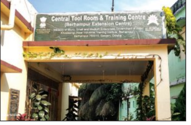
କାରିଗର ନିକଟକୁ ଡ୍ରାକିଭିକାର କରିଆରେ ଟୁଲ କିଟ୍ ଯୋଗାଇ ଦିଆଯାଇଥାଏ । ଏହା ବ୍ୟତିତ ତାଲିମପ୍ରାପ୍ତ କାରିଗରଙ୍କୁ ରଖି ପ୍ରଦାନର ବ୍ୟବସ୍ଥା ମଧ୍ୟ ରହିଛି । ତେବେ ଏହି ଯୋଜନାରେ ପ୍ରଶିକ୍ଷଣ କେବଳ ପାଇଁ ଗଞ୍ଜାମ ଜିଲ୍ଲାରେ ମୋଟ ୬୨ହଜାର ଆବେଦନକାରୀଙ୍କ ମଧ୍ୟରୁ ମାତ୍ର ୧୨ହଜାର ଶିବିରରେ ପ୍ରଥମ ଦିନକୁ ଜିରୋ ଦିବସ ଏବଂ

ଶେଷ ଦିନକୁ ଆବେଦନକାରୀଙ୍କ ଦିବସ ଭାବେ ପାଳନ କରାଯାଇଥାଏ । ପ୍ରଶିକ୍ଷଣ ନେଉଥିବା ଜଣେ କାରିଗର ପଛା ୬ହଜାର ୨୫୦୦ଟଙ୍କାର ଆର୍ଥିକ ସହାୟତା ସହିତ ଅତ୍ୟାଧୁନିକ ଟୁଲ କିଟ୍ ସରକାରଙ୍କ ପକ୍ଷରୁ ପ୍ରଦାନ କରାଯାଇଛି । ତାଲିମ ଗ୍ରହଣ ପରେ ଯୋଜନାରେ ସାମିଲ କରାଯାଇଛି । ଅନ୍ୟମାନଙ୍କୁ ବିଭିନ୍ନ କାରଣ ଦର୍ଶାଇ ବାଦ୍ ଦିଆଯାଇଛି । ସେହିଭଳି ତାଲିମପ୍ରାପ୍ତ କାରିଗରଙ୍କ ମଧ୍ୟରୁ କେବଳ ୨୦୮୫ଜଣଙ୍କୁ ରଖି ମିଳିଥିବା ଜଣାପଡ଼ିଛି । ଅନ୍ୟପକ୍ଷରେ ପୂର୍ବରୁ କିଛି ଘରୋଇ ଫର୍ଣ୍ଣାସର ସହଭାଗିତାରେ ଜିଲ୍ଲାର ୨୩ଟି ସ୍ଥାନରେ ପ୍ରଶିକ୍ଷଣ ଶିବିର ଆୟୋଜିତ ହେଉଥିଲା । ଯାହା ବର୍ତ୍ତମାନ କେବଳ ବୁଦ୍ଧପୁରର ଗୋଟିଏ କେନ୍ଦ୍ରରେ ହେଉଛି । କେନ୍ଦ୍ରରେ ରହିବା ନିମନ୍ତେ କୌଣସି ବ୍ୟବସ୍ଥା ନଥିବା ବେଳେ ଦୂରଦୂରାନ୍ତରୁ ଆବେଦନକାରୀ ଏଠାକୁ ଆସି ପ୍ରଶିକ୍ଷଣ ନେବାକୁ ଆଗ୍ରହ ପ୍ରକାଶ କରୁଥିବା ବେଶ୍‌ବାକୁ ମିଳୁଛି । ଏଭଳି ଭାବେ ସଚେତନତା ଅଭାବ ସାଙ୍ଗକୁ ଆବଶ୍ୟକ ଭିତ୍ତିକୁ ନିର୍ମୂଳକ କାରଣରୁ ଜିଲ୍ଲାରେ ଥିବା ଏକମାତ୍ର ପ୍ରଶିକ୍ଷଣ କେନ୍ଦ୍ରରେ ମଧ୍ୟ ପ୍ରତି ବ୍ୟାଚରେ ହାତଗଣତି କାରିଗର ପ୍ରଶିକ୍ଷଣ ନେଉଥିବା ଜଣାପଡ଼ିଛି । ତେଣୁ ଏଥିପ୍ରତି ଜିଲ୍ଲା ପ୍ରଶାସନ ଗୁରୁତ୍ୱ ଦେବା ସହ ଏହି ଯୋଜନାର ପ୍ରଚାର ପ୍ରସାର କରିବା ସହ ତୃଣମୂଳ ସ୍ତରରେ କାରିଗରଙ୍କ ନିକଟରେ ଯୋଜନାର ଲାଭ ସମ୍ପର୍କରେ ଅବଗତ କରିବା ଜରୁରୀ ହୋଇପଡ଼ିଛି ।