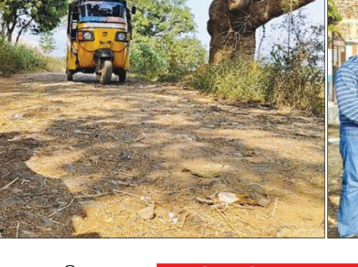
ଗୋଷାଣି, ୧୪।୧୨ (ସମ୍ପାଦକ):