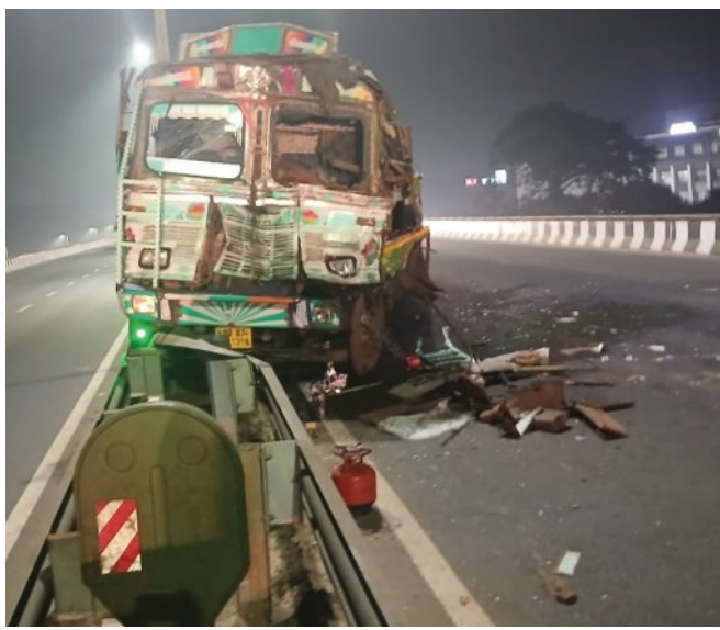
ପାଠ୍ୟାଳୟ ସ୍ୱେଚ୍ଛା ସ୍ୱାଧୀନ ଉପରେ ମର୍ତ୍ତ୍ୟୁର ଦୁର୍ଘଟଣାରେ ୨ ଗୁରୁତର