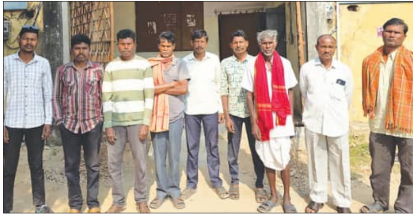
ପେରାଦ ହେବା ସହ ଆଗକୁ ଆୟୋଜନା କେ ପଛ ନୁହେଁ ଅବଲମ୍ବନ କରିବେ ବୋଲି ଚେତାବନୀ ଦେଇଛନ୍ତି।

ସରକାର ସବୁକ୍ଷେତ୍ରକୁ ଜଳସେଚନ ଫେଲ୍ କରାଯାଇଥିବା ସମ୍ବନ୍ଧରେ ଚାଷୀଙ୍କୁ ଜଳସେଚନ ବିଭାଗ ନିର୍ବାହୀ ଯନ୍ତ୍ରୀଙ୍କୁ ଭେଟିଲେ ଚାଷୀ