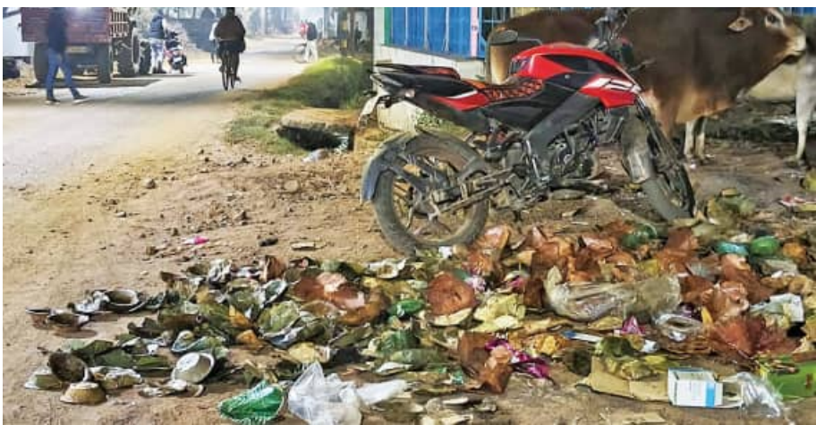
ଉଦଳା, ୧୬/୧୨(ସମ୍ପାଦକ): ମୟୂରଭଞ୍ଜ ଜିଲ୍ଲା କର୍ମଚାରୀ ସ୍ୱଚ୍ଛ ଓ ସୁସ୍ଥ ପରିମଳ ବ୍ୟବସ୍ଥା ପ୍ରତ୍ୟେକ ଉପଖଣ୍ଡର ଉଦଳା ସହର ପୌରପାଳିକା ମାନ୍ୟତା ପାଇଁ ବିଜ୍ଞାପିତ ଅଞ୍ଚଳର ନୌଲିକ ଦାୟିତ୍ୱ । ଏ ସେତୁରେ ଉଦଳା ଅଣା ଭିତ୍ତିପ୍ରଦାନବେଳେ ରାସ୍ତା କଡ଼ରେ ପକା ହେଉଛି ଅଧିକା ବିଜ୍ଞାପିତ ଅଞ୍ଚଳର ଅବହେଳା ପରିଲକ୍ଷିତ ହେଉଥିବା

ଦେଖିବାକୁ ମିଳୁଛି । ଅପରପକ୍ଷ ଉଦଳା ବିଜ୍ଞାପିତ ଅଞ୍ଚଳ ପରିଷଦର ଏହି ଆଜିମୁଖ୍ୟ ପାଇଁ ସହରର ପରିବେଶ ଓ ବାୟୁ ପ୍ରଦୂଷିତ ହେଉଛି । ରାଜ୍ୟ ପ୍ରଦୂଷଣ ନିୟନ୍ତ୍ରଣ ବୋର୍ଡ଼ର ନିୟମକୁ ଉଲ୍ଲଙ୍ଘନ କରାଯାଉଥିବା ଅଭିଯୋଗ ହେଉଛି । ଉଦଳା ବିଜ୍ଞାପିତ ଅଞ୍ଚଳରେ ଅସାମ୍ଭାବିକ ପରିବେଶ ସୃଷ୍ଟି ହେଉଥିବାବେଳେ ସ୍ୱଚ୍ଛତା ଓ ସୌନ୍ଦର୍ଯ୍ୟ ଯେମିତି ଦିଗହରା ହୋଇଯାଉଛି । ପରିଷଦଟା ନାଁରେ ଖର୍ଚ୍ଚ ହେଉଛି ଲକ୍ଷାଧିକ ଟଙ୍କା । ଏପରି ଅଧିକା ପଡ଼ୁଥିବା ଦୃଶ୍ୟ ଦେଖିବାକୁ ମିଳୁଛି ଉଦଳା ଅଂଶରୀ ଫାୟୋଗ କରୁଥିବା ରାସ୍ତା ବସ୍ତୁଶାଳ ନିକଟରେ । ବସ୍ତୁଶାଳ ନିକଟରେ ଥିବା ବିଭିନ୍ନ ଦୋକାନ ପାଇଁ ଲୌଣସି ଆବର୍ଜନା କୁଣ୍ଡ ନ ଥିବା ଭଳି ଦୃଶ୍ୟମାନ ହେଉଛି । ରାସ୍ତା କଡ଼ ହେବେଲେ ଅର୍ଦ୍ଧ ଖଲିପତ୍ର ପଡ଼ୁଥିବା କାରଣରୁ ଯାତାୟତରେ ଅସୁବିଧା ହେଉଛି । ଉଦଳା ବିଜ୍ଞାପିତ ଅଞ୍ଚଳ ପରିଷଦ ପକ୍ଷରୁ ନିୟୋଜିତ ସଫେଦ ଠିକା ଫାୟୋଗ ଅବହେଳା ନା ବିଜ୍ଞାପିତ ଅଞ୍ଚଳ ପରିଷଦର ତଦାରଖର ଅବହେଳା ପ୍ରଶ୍ନବାଚୀ ସୃଷ୍ଟି କରୁଥିବାବେଳେ କେବେ ସୁଧରିବ ବିଜ୍ଞାପିତ ଅଞ୍ଚଳର ପରିବେଶ ଦେଖିବାକୁ ବାକି ରହିଲା ।