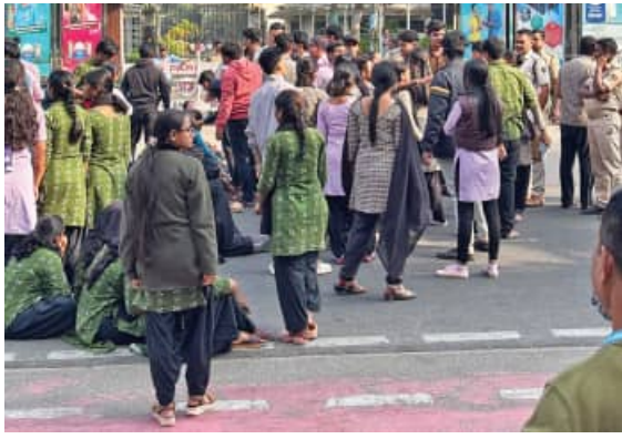
କରିଥିବା ବାର୍ତ୍ତାକାର ଏକ ଅତିଥି ଭାବରେ ଉଦ୍ଘୋଷଣା ପରେ କ୍ୟାମ୍ପସରେ ତାଙ୍କ ବିରୋଧରେ ଅଭିଯୋଗ ଉତ୍ତରୁ ପ୍ରାୟ ୫୦ ଜଣ ଛାତ୍ରୀଙ୍କୁ ଗିରଫ କରାଯାଇଛି। ଏହାସହ ତାଙ୍କ ଗୋଟିଏ ପରେ ଗୋଟିଏ କଳାକାରମାନା ପଦାରେ ପଡ଼ିଥିଲା। ପିଲାମାନେ ଅନୁଗଣରେ ବସିବାସହ ରାସ୍ତାକୁ ଓହ୍ଲାଇଥିଲେ। ଗୁରୁବାର କଲେଜ ସମ୍ମୁଖରେ କୋରଦାର ହଜାମା ଦେଖିବାକୁ ମିଳିଥିଲା। ଏମିତି କି କ୍ୟାମ୍ପସରେ ଉଦ୍ଘୋଷଣା

ଅଭିଯୋଗ ପ୍ରତ୍ୟାକ୍ତ, ଶତ୍ରୁତ୍ୱ ବିଭିନ୍ନ ସମୟରେ ଛାତ୍ରାମ୍ବାନଙ୍କୁ ଟାର୍ଗେଟ କରୁଥିଲେ। ଛାତ୍ରାମ୍ବାନଙ୍କୁ ବିଅର୍ଥ ବୋଧକ କଥାବାର୍ତ୍ତା କରିବା ସହ ପ୍ରେମ ନିବେଦନ ମଧ୍ୟ କରୁଥିଲେ। ଏମିତି କି ଅନେକ ଛାତ୍ରୀଙ୍କୁ ବାରମ୍ବାର ଫୋନ୍ କରି ବିରକ୍ତ କରୁଥିବା ଅଭିଯୋଗ ହୋଇଛି। ହେଲେ ଇଣ୍ଡିଆ ଅଧ୍ୟାପକ