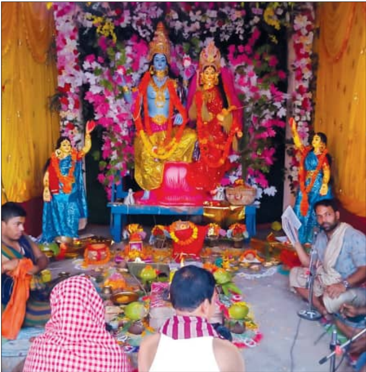
ବାଇରୋଇରେ ଲକ୍ଷ୍ମୀ ନାରାୟଣଙ୍କ ପୂଜା