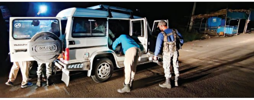
ରକ୍ତକୃତ, ଛତିଶଗଡ଼ ସୀମାରେ ବ୍ଲାଷ୍ଟ୍ କରାଯାଇଛି। ସେହିପରି ଲେପ୍ଟିପଡ଼ା ଥାନା ଅନ୍ତର୍ଗତ ଏବଂ ତେଲିଯୋଗ ସୀମାରେ ପୁଲିସ ପକ୍ଷରୁ ଯାଞ୍ଚ ସରପଞ୍ଚତ ଯିବା ରାସ୍ତା ଛତିଶଗଡ଼ ସୀମାରେ ମଧ୍ୟ

ନୂଆଦିଲ୍ଲୀ ଲାଲକିଲ୍ଲା ସ୍ଥିତ ମେଟ୍ରୋ ସ୍ଵେଚ୍ଛା ୬ ନମ୍ବର ଗେଟ ନିକଟରେ ଏକ ଚଳଚ୍ଚିତ୍ର କାରରେ ଭୟଙ୍କର ବ୍ଲାଷ୍ଟ୍ ପରେ ସୁନ୍ଦରଗଡ଼ ପୁଲିସ ପକ୍ଷରୁ ହାଲୁ ଆଲର୍ଟ ଜାରି କରାଯିବା ସହ ବ୍ୟାପକ ଯାଞ୍ଚ ଆରମ୍ଭ କରାଯାଇଛି।