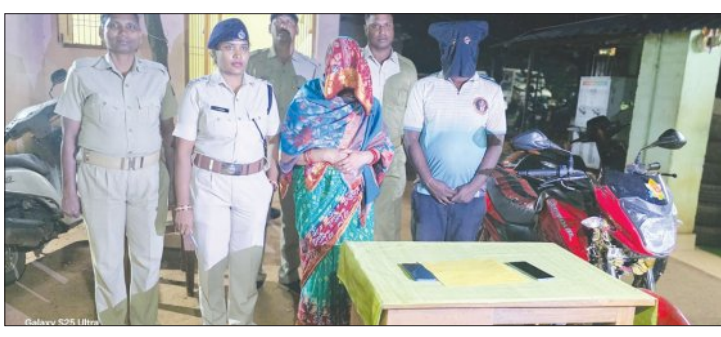
ଉପସାଧାରଣ ସଭାରେ ସଭାପତିଙ୍କ ସମ୍ବୋଧନ

ଖୋର୍ଦ୍ଧା, ୧୦/୧୧ (ସମ୍ପାଦକ): ଲୁକ୍ଷ୍ମୀ ଶିକ୍ଷା ମହାବୀର ଆଞ୍ଚଳିକ ଆୟୋଜିତ ପୁସ୍ତକ ପ୍ରଦର୍ଶନୀ ଆୟୋଜନ କରାଯାଇଛି । ଡିସେମ୍ବର ୧୮ ରୁ ୨୮ ତାରିଖ ପର୍ଯ୍ୟନ୍ତ ଖୋର୍ଦ୍ଧା ଲୁକ୍ଷ୍ମୀ ଶିକ୍ଷା ମହାବୀର କପୁ ପୁସ୍ତକ ଗ୍ରନ୍ଥାଳୟରେ ପୁସ୍ତକ ପ୍ରଦର୍ଶନୀ ଆୟୋଜନ କରାଯାଇଛି ।