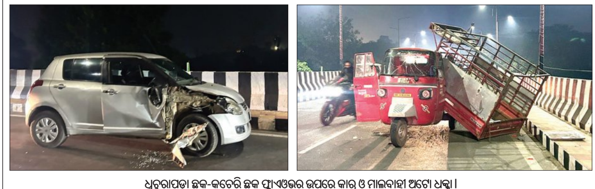
ଧୁରୁପାଡ଼ା ଛକ-କଟେରି ଛକ ପୁାଏଓଜର ଉପରେ କାର୍ ଓ ମାଲବାହୀ ଅଟୋ ଧକ୍କା।