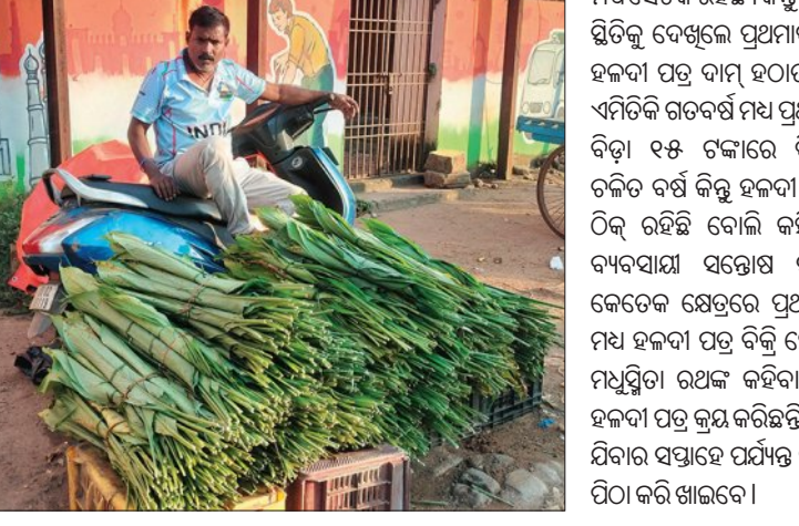
ମହକୁଛି ଖୋର୍ଦ୍ଧା ସହର

ଖୋର୍ଦ୍ଧା, ୧୦/୧୧ (ସମ୍ପାଦକ): ଲୁକ୍ଷ୍ମୀ ଶିକ୍ଷା ମହାବୀର ଆଞ୍ଚଳିକ ଆୟୋଜିତ ପୁସ୍ତକ ପ୍ରଦର୍ଶନୀ ଆୟୋଜନ କରାଯାଇଛି । ଡିସେମ୍ବର ୧୮ ରୁ ୨୮ ତାରିଖ ପର୍ଯ୍ୟନ୍ତ ଖୋର୍ଦ୍ଧା ଲୁକ୍ଷ୍ମୀ ଶିକ୍ଷା ମହାବୀର କପୁ ପୁସ୍ତକ ଗ୍ରନ୍ଥାଳୟରେ ପୁସ୍ତକ ପ୍ରଦର୍ଶନୀ ଆୟୋଜନ କରାଯାଇଛି ।