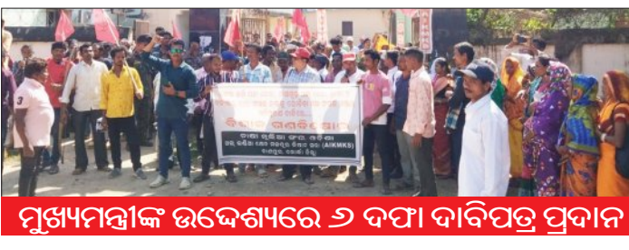
ମୁଖ୍ୟମନ୍ତ୍ରୀଙ୍କ ଉଦ୍ଦେଶ୍ୟରେ ୬ ଦିନା ଦାବିପତ୍ର ପ୍ରଦାନ

ବାଣପୁର, ୧୦/୧୧ (ସମ୍ପାଦକ): ବାଣପୁର ଲୁକ୍ଷ୍ମୀ ଶିକ୍ଷା ମହାବୀର ଆଞ୍ଚଳିକ ଆୟୋଜିତ ପୁସ୍ତକ ପ୍ରଦର୍ଶନୀ ଆୟୋଜନ କରାଯାଇଛି । ଡିସେମ୍ବର ୧୮ ରୁ ୨୮ ତାରିଖ ପର୍ଯ୍ୟନ୍ତ ଖୋର୍ଦ୍ଧା ଲୁକ୍ଷ୍ମୀ ଶିକ୍ଷା ମହାବୀର କପୁ ପୁସ୍ତକ ଗ୍ରନ୍ଥାଳୟରେ ପୁସ୍ତକ ପ୍ରଦର୍ଶନୀ ଆୟୋଜନ କରାଯାଇଛି ।