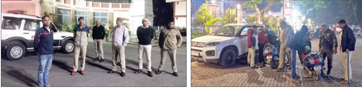
ଭୁବନେଶ୍ୱର, ୧୦୧୧ (ସମ୍ବିଧ)

ଦୁଆରିଲୁଚା ଲାଲକିଲରେ କାର୍ ବିସ୍ଫୋରଣରେ ୮ ଜଣଙ୍କ ମୃତ୍ୟୁ ହେବାପରେ ଓଡ଼ିଶାର ବିଭିନ୍ନ ସ୍ଥାନରେ ହାଇଆଲର୍ଟ କାରି ହୋଇଛି। ବିଶେଷକରି ପୁରୀ ଓ ସମ୍ବଲପୁରକୁ ହାଇଆଲର୍ଟରେ ରଖାଯାଇଛି।