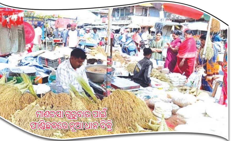
ମାଣବସା ଗୁରୁବାର ପାଇଁ ପାଣ୍ଡି ଛକରେ ନୂଆଧାର ବିକ୍ରି

ସଦର ବୁକ୍ସରାୟ ମସ୍ତୁରାସ ଓ ପ୍ରାଣୀ ସମ୍ପଦ ମେଳାରେ ବିଭିନ୍ନ ବିଭାଗର ଲୋକ ୧୪ଟି ପ୍ରଦର୍ଶନୀ ଷ୍ଟାଲ୍ ସ୍ଥାପିତ ହୋଇଥିଲା। ପ୍ରାଣୀ ସମ୍ପଦ ବିକାଶ ବିଭାଗର ୪, ମସ୍ତୁ ବିଭାଗର ୪, ପଞ୍ଜିକରଣ ୨, କୃଷି ବିଭାଗ ୧, ଉପାଦାନ କୃଷି ବିଭାଗ ୧, ମିଶନ ଜିଲ୍ଲା ପରିଷଦ ଅଧିକାରୀଙ୍କ ପ୍ରଧାନ ଚେରୁଣୀ ବିଦ୍ୟାୟକ ପ୍ରତିନିଧି ଲମ୍ବେଦର ପ୍ରଧାନ, ପଞ୍ଚାୟତ ସମିତି ସଦର ଅଧିକାରୀ