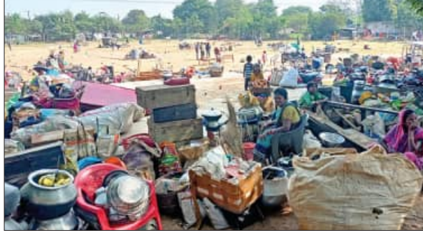
ବସ୍ତିବାସିନ୍ଦାଙ୍କ ତାକୁ ବିରୋଧ, ବୁଲ୍‌ଡୋଜର ଆଗରେ ଧାରଣା ୬୦୦ ବର୍ଗଫୁଟ ଜମି ଦେବାକୁ କହିଥିଲେ, ଏବେ ଠକିଦେଲେ

■ ଭୁବନେଶ୍ୱର, ୧୮।୧୧ (ସମିସ): ରାଜଧାନୀର ପ୍ରମୁଖ ବସ୍ତି ସାଲିଆସାହିରେ ମଙ୍ଗଳବାର ବୁଲିଲା ବୁଲ୍‌ଡୋଜର। ଏକାମ୍ରକାଳୀନରୁ ଅଧାରୁଆ ୧୩ କିଲୋମିଟର ନୂତନ ରାସ୍ତା ନିର୍ମାଣ ପାଇଁ ପର୍ଯ୍ୟାୟକ୍ରମେ ପ୍ରାୟ ୫-୨୧୧ର ଉତ୍ତରାଧିକାରୀଙ୍କୁ ଥିବା ବେଳେ ଆଜି କିଛି ଘରକୁ ଭାଙ୍ଗି ଦିଆଯାଇଛି। ପ୍ରବଳ ଶୀତବେଳେ ବିନା ଅଧ୍ୟାୟନରେ ଉତ୍ତରାଧିକାରୀ ବିରୋଧ କରି ବସ୍ତିବାସିନ୍ଦା ରାସ୍ତାକୁ ଓହ୍ଲାଇଛନ୍ତି। ଫଳରେ ପୁଲିସ୍‌ସହ ବସ୍ତିବାସିନ୍ଦା ମୁହାଁମୁହିଁ ହୋଇଛନ୍ତି ଏବଂ ଖଣ୍ଡସୂତ୍ର ସମ ପରିସ୍ଥିତି ସୃଷ୍ଟି ହୋଇଛି। ଘର ଭାଙ୍ଗିବା ପରେ କେଉଁଆଡ଼େ ଯିବୁ, ଛୋଟ ଛୋଟ ପିଲାଙ୍କୁ ନେଇ ଶୀତ ରାତିରେ କିଭଳି ବସ୍ତିକୁ ବୋଲି ସେମାନେ ପ୍ରଶ୍ନାସନକୁ ପ୍ରଶ୍ନ କରିଛନ୍ତି। ଏପରିକି ଘର ଭଙ୍ଗା ବେଳେ କିଛି ଲୋକ