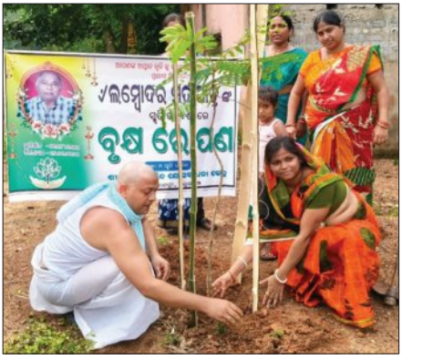
ଶ୍ରଦ୍ଧାଞ୍ଜଳି ରୂପେ ବୃକ୍ଷରୋପଣ।

ମାଣସପୁର, ୨୪।୯ (ସମ୍ପାଦକ): ମାଣସପୁରରେ ଘଟିଥିବା ଏକ ଦୁର୍ଘଟଣାରେ ମୃତ୍ୟୁ ପାଇଥିବା ପରିବାରକୁ ସହାୟତା ପ୍ରଦାନ କରିବା ପାଇଁ କେନ୍ଦ୍ରୀୟ ଶାସନ ସହାୟତା ପ୍ରଦାନ କରିଛନ୍ତି।