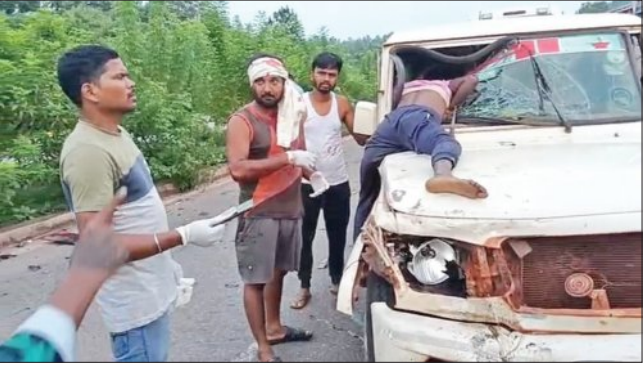
କଣ୍ଠେନରରେ ଘଟିଥିବା ଦୁର୍ଘଟଣାର ଚିତ୍ରାଙ୍କନ।

୨୦ ନଂ ଜାତୀୟ ରାଜପଥ କୋଳିମାଟି ଓ ଘସିପୁରାରେ ପୃଥକ ପୃଥକ ଦୁର୍ଘଟଣା ଘଟିଛି। ଏଥିରେ ପରିବାରର ଦୁଇ ଜଣଙ୍କ ମୃତ୍ୟୁ ଘଟିଥିବା ବେଳେ ଆଉ ୪ ଜଣ ଗୁରୁତର ଆହତ ହୋଇଥିବା ଜଣାପଡ଼ିଛି।