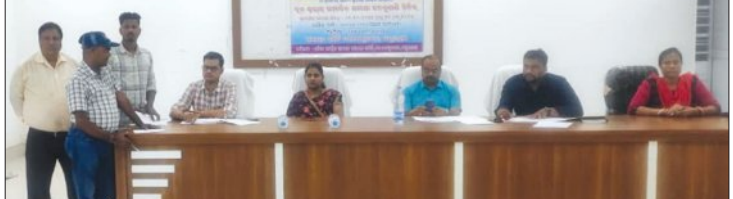
ସାମାଜିକ ସମାକ୍ଷା ସମୟରେ।

ଜୁଆନପୁର, ୨୪।୯ (ସମ୍ପାଦକ): ଜୁଆନପୁରରେ ଘଟିଥିବା ଏକ ଦୁର୍ଘଟଣାରେ ମୃତ୍ୟୁ ପାଇଥିବା ପରିବାରକୁ ସହାୟତା ପ୍ରଦାନ କରିବା ପାଇଁ କେନ୍ଦ୍ରୀୟ ଶାସନ ସହାୟତା ପ୍ରଦାନ କରିଛନ୍ତି।