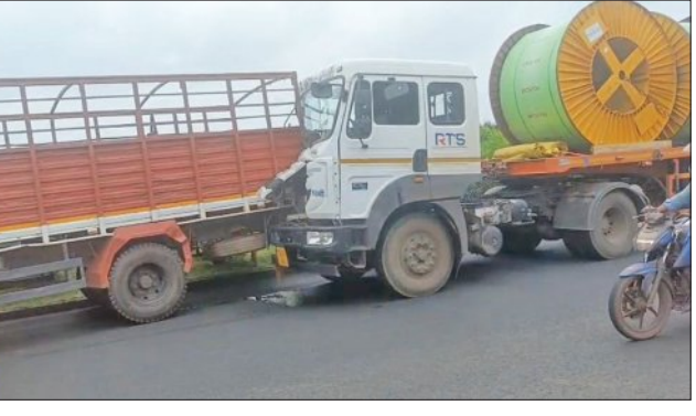
କଣ୍ଠେନରରେ ଘଟିଥିବା ଦୁର୍ଘଟଣାର ଚିତ୍ରାଙ୍କନ।