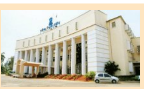
ବିନା ବିରୋଧରେ ବିଶ୍ୱବିଦ୍ୟାଳୟ ବିଧାନସଭାରେ ଗୃହୀତ

ପୂର୍ବରୁ ପ୍ରଦର୍ଶନ ସହ ରାଜ୍ୟ ସରକାର ରାଜ୍ୟର ପଞ୍ଚାୟତିରାଜ ବ୍ୟବସ୍ଥାରେ ତତ୍ତ୍ୱ ଦିପ୍ତିପଦା ଘୋରାନ ଦେଇ ଗୃହ କମିଟିରେ ଅନୁରୂପ ଭାବରେ ବୋଲି ନାରାଦେଇ ଗୃହ କମିଟିରେ ବିଜେଡି ସଦସ୍ୟ। ସେହିପରି କଂଗ୍ରେସ ବିଧାନସଭାରେ ମଧ୍ୟ ନିଜ ନିଜ ଆସନରେ ଛିଡ଼ା ହୋଇ ପ୍ରତିବାଦ କରିଥିଲେ। ପ୍ରଥମାର୍ଦ୍ଧ ମାତ୍ର ୨୦ ମିନିଟ୍ ଚାଲିଥିବା ବେଳେ ଅପରାହ୍ଣରେ ମଧ୍ୟ ସମାନ ଚୁଷ୍କା ଦେଖିବାକୁ ମିଳିଛି। ଦିନଟମାମ ଉଭୟ ବିରୋଧୀ ଗୃହକାର୍ଯ୍ୟରେ ଭାଗ ନେବା ବେଳେ ଆଗତ ବିଶ୍ୱ ବିଦ୍ୟାଳୟ ଫଣ୍ଡୋଧନ ବିଧାନସଭା ଆଲୋଚନାରେ ଗୃହୀତ ହୋଇଛି।