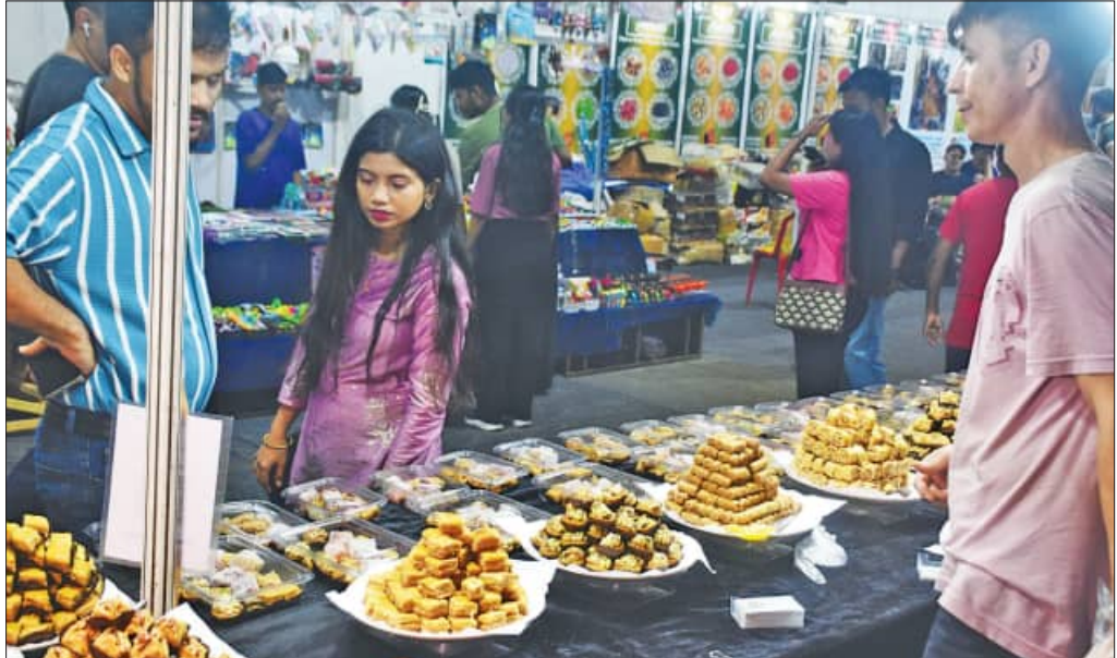
ଜନତା ମଇଦାନରେ ଚାଲିଥିବା ଭଣ୍ଡର ନ୍ୟାସନାଳ ଗ୍ରେଡ଼ ଫେୟାରରେ ଆକର୍ଷଣୀୟ ମିଷ୍ଟାନ