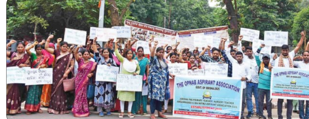
ଶିଶୁ ବାଚିକାରେ ଶିଶୁ ସେବିକା ନିୟୁତ୍ତି ଦେବା ସମ୍ବନ୍ଧରେ ଓଡ଼ିଶା ପ୍ରି-ପ୍ରାଇମେରୀ ଆସୋସିଏସନ ପକ୍ଷରୁ ପିଏମଜିରେ ବିରୋଧ