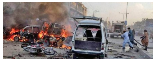
ଏକଲି ଏକ ଆତ୍ମହତ୍ୟା ବିସ୍କୋରଣ ଘଟିଥିଲା। ତେବେ ଘଟଣା ପାଇଁ କୌଣସି ସଂଗଠନ ନିଜକୁ ଦାୟୀ କରିନାହାନ୍ତି। ଜଣେ ୩୫ରୁ ୪୦ ବର୍ଷର ବ୍ୟକ୍ତି ୮ କେଜିର ବିସ୍କୋରକ ନେଇ ଏହି କାଣ୍ଡ ଘଟାଇଥିବା ବୋଲି ପ୍ରତ୍ୟକ୍ଷଦର୍ଶୀ କହିଛନ୍ତି।