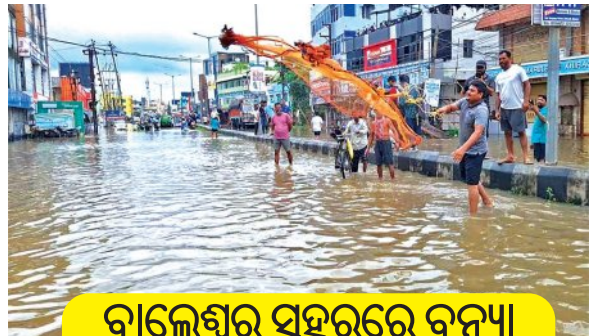
ବାଲେଶ୍ୱର ସହରରେ ବନ୍ୟା

ପୁଣି ଉତ୍ତରରେ ପୁଲିସ୍ ନଦୀ ହାଟିଡିହିରେ ସର୍ବାଧିକ ୨୨୫.୧ ମିମି ବର୍ଷା ରେକର୍ଡ