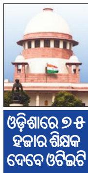
ଓଡ଼ିଶାରେ ୨୫ ହଜାର ଶିକ୍ଷକ ଦେବେ ଓଡ଼ିଇଟି

■ ନୂଆଦିଲ୍ଲୀ/ଭୁବନେଶ୍ୱର, ୧୯ (ସମ୍ବିଧ): ଶିକ୍ଷକଙ୍କ ପାଇଁ ଯୋଗ୍ୟତା ପରୀକ୍ଷା (ଟିଇଟି) ବାଧ୍ୟତାମୂଳକ କରାଯାଇଛି। ଯେଉଁମାନେ ଟିଇଟି ପରୀକ୍ଷାରେ ଉତ୍ତୀର୍ଣ୍ଣ ହୋଇ ନାହାନ୍ତି, ସେମାନଙ୍କୁ ହୁଇବର୍ଷ ମଧ୍ୟରେ ଉତ୍ତୀର୍ଣ୍ଣ ହେବାକୁ ପଡ଼ିବ; ଅନ୍ୟଥା ସେମାନଙ୍କୁ ଆଉ ପଦୋନ୍ନତି ମିଳିବ ନାହିଁ। ଏପରିକି ସେମାନଙ୍କୁ ବାଧ୍ୟତାମୂଳକ ଅବସର ଦିଆଯାଇ ପାରିବ। ଏନେଇ ସର୍ବୋଚ୍ଚ ନ୍ୟାୟାଳୟରେ ଦାୟର ହୋଇଥିବା ଏକାଧିକ ମାମଲାରେ ଶୁଣାଣି କରି ଜଷ୍ଟିସ୍ ଦାପକର ଦତ୍ତା ଓ ଅଗଷ୍ଟିନ ଜର୍ଜ ମସିହକୁ ନେଇ ଗଠିତ ଖଣ୍ଡପୀଠ ସୋମବାର ରାୟ ଦେଇଛନ୍ତି। ହୁଇ ଜଣିଆ ଖଣ୍ଡପୀଠ ଆହୁରି କହିଛନ୍ତି ଯେ ଯେଉଁ ଶିକ୍ଷକ/ଶିକ୍ଷୟିତ୍ରା ଚାକିରି କାଳ ଆଉ