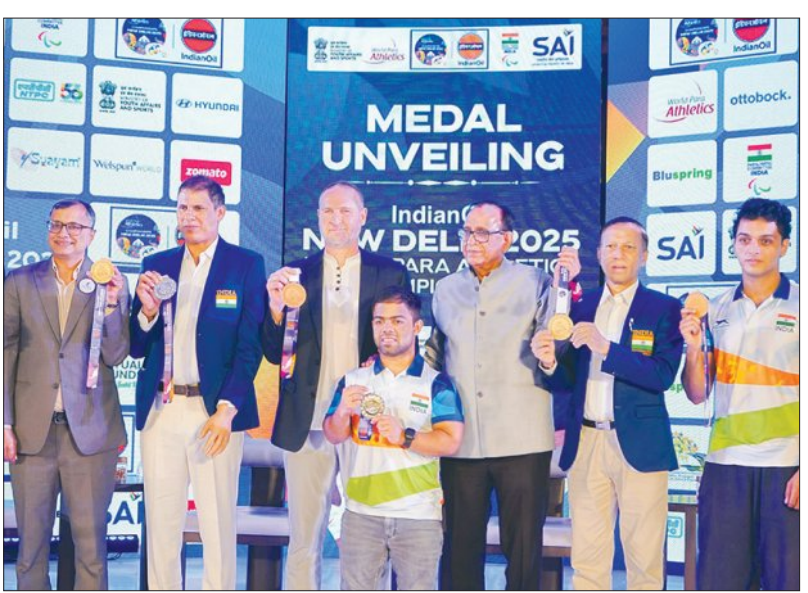
ବିଶ୍ୱ ପାଠ୍ୟ ଆଧିକାରୀଙ୍କ ଦ୍ୱାରା ନୂଆଦିଲ୍ଲୀରେ ଗୁରୁବାର ପଦକ ଉନ୍ମୋଚନ ଉତ୍ସବରେ ଉପସ୍ଥିତ କର୍ମଚାରୀ ଓ ପାଠ୍ୟ ଆଧିକାରୀମାନେ

ପାଳିରେ ସେ ୧୦ ଟୋକା ମାରିଥିଲେ। ଅନ୍ୟମାନଙ୍କ ମଧ୍ୟରେ କୁଶଲ ପେରେରା ୨୮, ଅଧିନାୟକ ରାଜିଥ ଆସିଆ କପ୍ ୧୭ ଓ କାମିନୁ ମେଣ୍ଡିସ୍ ଅପରାଜିତ ୨୬ ରନ କରିଥିଲେ। ପୂର୍ବରୁ ଏହି ମ୍ୟାଚ୍‌ରେ ଟ୍ୱେଣ୍ଟି ଲିଟ୍ ବ୍ୟାଟି କରିଥିବା ଆସିଆ କପ୍ ୨୦ ଓମାନରେ ୮ ଓମାନ ହରାଇ ୧୨.୯ ରନ କରିଥିଲା। ବ୍ୟାଟିଙ୍ଗିର ୭ମ ସ୍ଥାନରେ ଆସିଥିବା ୪୨ ବର୍ଷୀୟ ନବି ୨୨ ବଲରେ ୬୦ ରନର ବିଶ୍ୱାସରେ ଅର୍ଦ୍ଧଶତକୀୟ ପାଳି ଖେଳି ଇନିଂସର ଶେଷ ବଲରେ ରନଆଉଟ୍ ହୋଇଥିଲେ। ଅଧିକ ଓଭର ବୋଲି କରିଥିବା ବାମହାତୀ ସ୍ଥିତିର ଦୁନିଅ ସେନେଲାରାକୁ ନବି ୫ଟି ବିଶାଳ ଛକା ମାରିଥିଲେ। ଶ୍ରୀଲଙ୍କା ପକ୍ଷରୁ ନୂଆନ ପୁଷ୍ପା ସର୍ବାଧିକ ୪ଟି ଓଭର ସଫଳତା ପାଇଥିଲେ। କୁଶଲ ମେଣ୍ଡିସ୍ ମ୍ୟାଚ୍‌ରେ ଶ୍ରେଷ୍ଠ ଖେଳାଳି ହୋଇଥିଲେ।