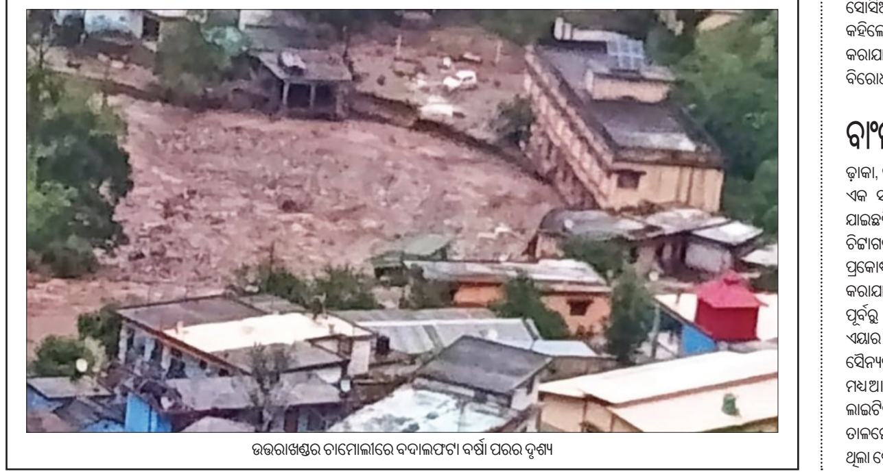
ଉତ୍ତରାଖଣ୍ଡର ଚାମୋଲୀରେ ବଦଳାଯିବା ବର୍ଷା ପରେ ଦୃଶ୍ୟ

ଦୀର୍ଘବର୍ଷ ଧରି ସହଯୋଗ ବଜାୟ ରଖିବା ପାଇଁ ଏହି ବୃତ୍ତମଣ୍ଡଳ ସାକ୍ଷରିତ ହୋଇଛି ବୋଲି ଜଣେ ଅଧିକାରୀ କହିଛନ୍ତି । ଉଲ୍ଲେଖଯାଉ କି, ଇସ୍ରାଏଲ ସେପ୍ଟେମ୍ବର ୯ରେ କାହାରା ରାଜଧାନୀ ଦୋହା ଉପରେ ଆକ୍ରମଣ କରିବା ପରେ ପାକିସ୍ତାନ ସବୁ ଇସ୍ରାଏଲି ଦେଶଗୁଡ଼ିକୁ ନାଟୋ ଭଳି ସାମରିକ ସଂଗଠନ ସୃଷ୍ଟି କରିବାକୁ ପରାମର୍ଶ ଦେଇଥିଲା । ତେବେ ଏହା ଏକ ଔପଚାରିକ ସୂଚନା ନୁହେଁ ବୋଲି ଆମେରିକାଠାରେ ପାକିସ୍ତାନର ପୂର୍ବତନ ରାଷ୍ଟ୍ରପତି କହିଛନ୍ତି । କିନ୍ତୁ ଏହା ଏକ ବଡ଼ ରଣନୈତିକ ବୃତ୍ତମଣ୍ଡଳ ବୋଲି ସେ ସ୍ୱୀକାର କରିଛନ୍ତି । ଭାରତ ଏନେଇ ଚା'ର ପ୍ରତିକ୍ରିୟା ପ୍ରକାଶ କରିଛି । ବିଦେଶିକ ବିଭାଗ କହିଛି, ଆମେ ଅବଗତ ଅଛୁ । ଭାରତ ଉପରେ ପ୍ରଭାବ ଦେଇ ଅନୁଧ୍ୟାନ କରାଯାଇଛି ।