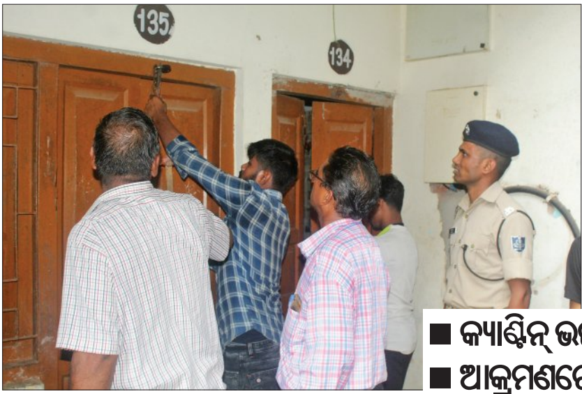
■ କ୍ୟାଣ୍ଟିନ୍ ଭଙ୍ଗାକୁ ନେଇ ଥାନାରେ ମାମଲା ■ ଆକ୍ରମଣରେ ଛାତ୍ର ଗୁରୁତର