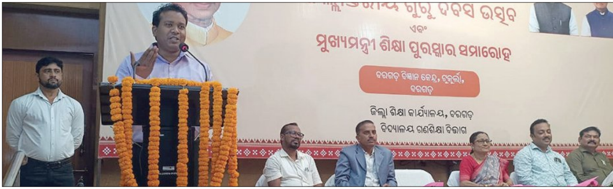
ବରଗଡ଼, ୫.୧ (ସମ୍ପାଦକ)

ବରଗଡ଼ ବିଜ୍ଞାନ କେନ୍ଦ୍ର, ଗୁରୁକାଠାରେ ଜିଲ୍ଲାସ୍ତରୀୟ ଗୁରୁ ଦିବସ ଓ ପୁସ୍ତକାଳୟ ପ୍ରଦାନ ଉତ୍ସବ ଅନୁଷ୍ଠିତ ହୋଇଯାଇଛି।