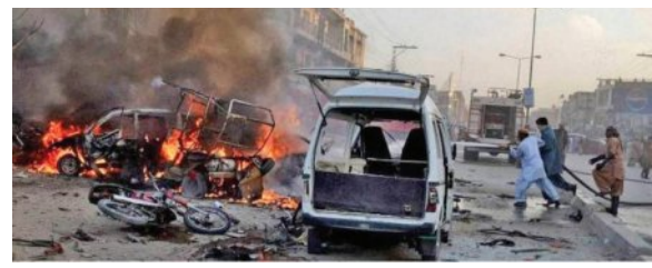
ଆତ୍ମହତୀ ବିସ୍ଫୋରଣ ଘଟିଥିଲା । ତେବେ ଘଟଣା ପାଇଁ କୌଣସି ସଂଗଠନ ନିଜକୁ ଦାୟୀ କରିନାହାନ୍ତି । ଜଣେ ୩୫ରୁ ୪୦ ବର୍ଷର ବ୍ୟକ୍ତି ୮ କେଜିର ବିସ୍ଫୋରକ ନେଇ ଏହି କାଣ୍ଡ ଘଟାଇଥିବା ପ୍ରତ୍ୟକ୍ଷବାଣୀ କହିଛନ୍ତି ।