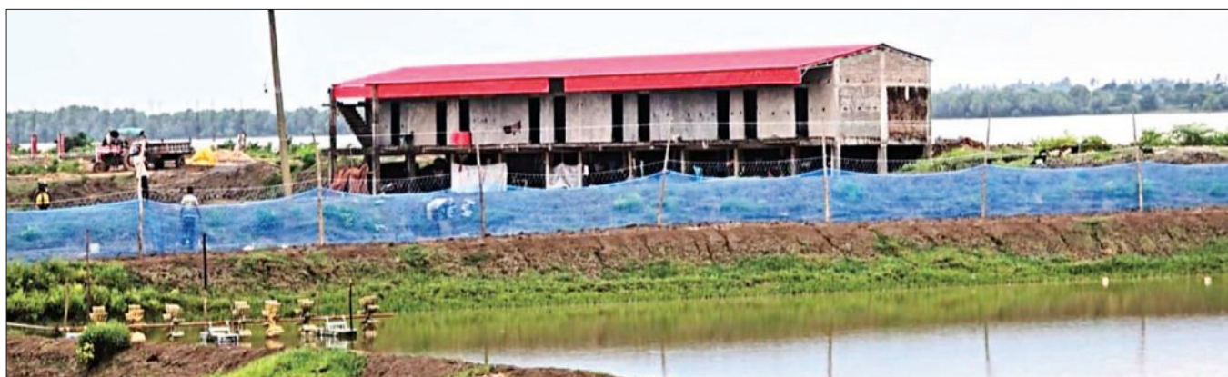
ରାଜନଗର, ୨୬।୯ (ସମ୍ବିଧ)

ଭିତରକନିକା ଜାତୀୟ ଉଦ୍ୟାନର ଅତ୍ୟନ୍ତ ପରିବେଶ ସମ୍ବେଦନଶୀଳ ଅଞ୍ଚଳରେ ରାଜନଗର ନିର୍ମାଣ ନଦୀପଠାକୁ ଚାଡ଼ି ନଦୀ କୁଆର ଅଟକାଇ ବେଧକତ ଭାବେ ବାଲିଖି ନିର୍ମାଣକାମ । କେବି ବିଧିଧାରା ସୁରକ୍ଷା ପାଇଁ ଆଇନ ଥିବାବେଳେ ବୃକ୍ଷ ବିଧାବଲୋକରେ ବେଆଇନ ନିର୍ମାଣ କାର୍ଯ୍ୟ ଜାରି ରହିଛି । ଭିତରକନିକା ଅଭୟରଣ୍ୟ, ସିଆରଜେଡ୍ ଓ ଇକୋ ସେନସେଟିଭ ଜୈନ ଆଇନକୁ ଉଲ୍ଲଙ୍ଘନ କରି ବେଆଇନ ନିର୍ମାଣ କରାଯାଇଛି । ନଦୀର କୁଆରକୁ ଅଟକାଇ ଏହି ନିର୍ମାଣ କରାଯିବା ସହିତ ସରକାରୀ ଜମିରେ ବେଆଇନ