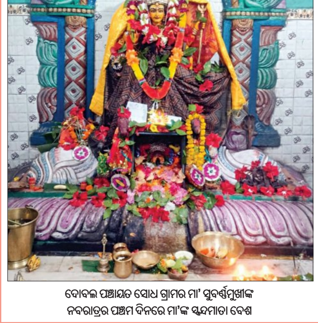
ଦୋବଲ ପଞ୍ଚାୟତ ସୋପ ଗ୍ରାମର ମା' ସୁବର୍ଣ୍ଣପୁଷ୍ପାଙ୍କ ନବରାତ୍ରର ପଞ୍ଚମ ଦିନରେ ମା'ଙ୍କ ସୁନ୍ଦରୀ ବେଶ