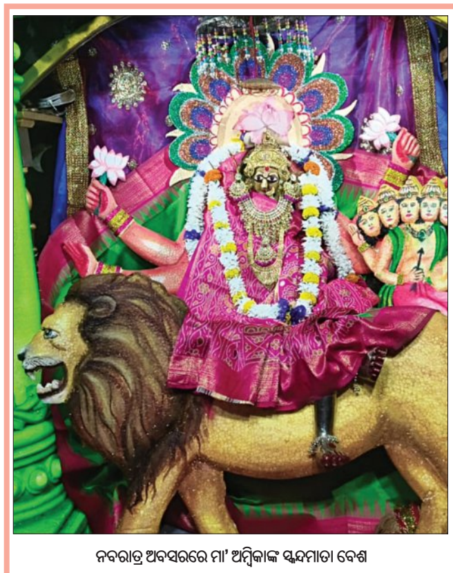
ନବରାତ୍ର ଅବସରରେ ମା' ଅମ୍ବିକାଙ୍କ ସୁନ୍ଦରତା ବେଶ