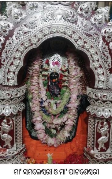
ମା' ସମଲେଶ୍ୱରୀ ଓ ମା' ପାଟଣେଶ୍ୱରୀ