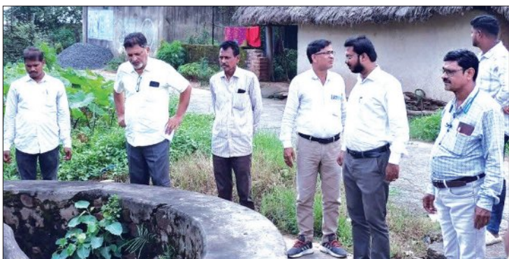
ଆଲୋଚନା କରିଥିଲେ। ଅନୁଗୋଳ ଜିଲ୍ଲାର ୫୦ ପ୍ରତିଶତରୁ ଅଧିକ ଆଦିବାସୀ ଥିବା ୫୯ଟି ଗ୍ରାମରେ ଓ କିଶୋରନଗର ବ୍ଲକର ୬ଟି ଗ୍ରାମରେ ଉକ୍ତ ଯୋଜନା କାର୍ଯ୍ୟକାରୀ କରାଯିବ। ଆଦିବାସୀ

କିଶୋରନଗର ବ୍ଲକ ପ୍ରଶାସନ ସହାୟତାରେ ଭାରତ ସରକାରଙ୍କ ପ୍ରସ୍ତାବ ଆଦି କର୍ମଯୋଗୀ ଯୋଜନା କାର୍ଯ୍ୟକାରୀ କରିବା ସମ୍ପର୍କରେ ଆଲୋଚନା ପଞ୍ଚାୟତ ଅଧିକାରୀଙ୍କ ଗ୍ରାମରେ ସଚେତନତା ଓ ଯୋଜନା ପ୍ରସ୍ତୁତି ସହାୟତା ପ୍ରଦାନ କରାଯାଇଛି। ବ୍ଲକ ଅଧ୍ୟକ୍ଷ ସଭାରେ ଯୋଜନା ଅଧିକାରୀଙ୍କ ସହାୟତାରେ ଅନୁଗୋଳ ସରକାରଙ୍କ ଦ୍ଵାରା ପ୍ରସ୍ତୁତ ଯୋଜନାକୁ ପ୍ରମୋଦିତ କରିବା ପାଇଁ ଯୋଜନା ପ୍ରସ୍ତୁତି କରିବା ପାଇଁ ବିଭିନ୍ନ