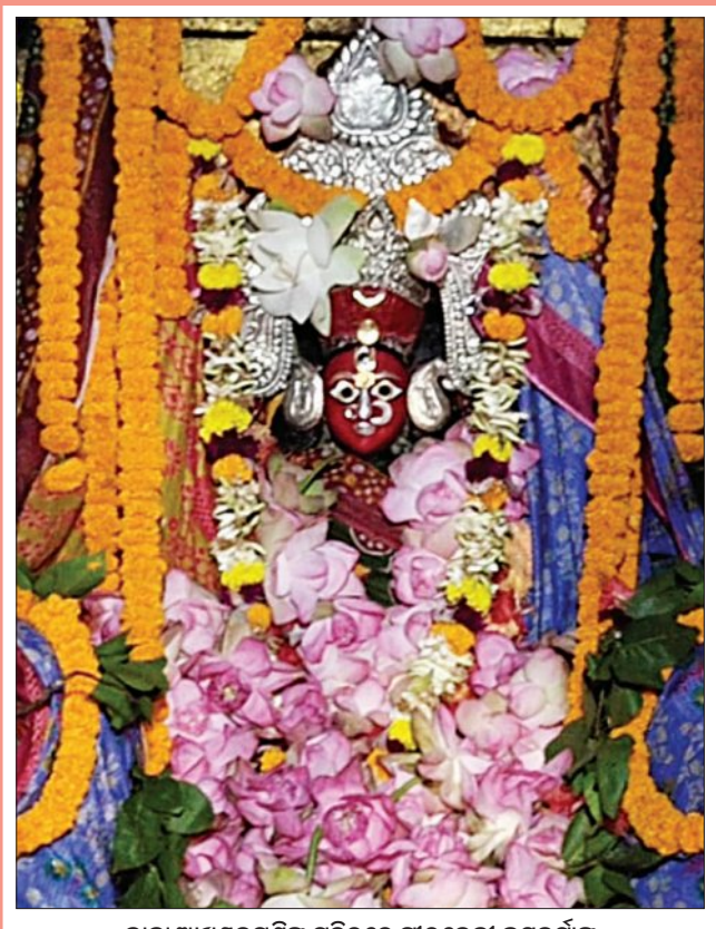
ବାବା ଆଖଣ୍ଡକମଣିଙ୍କ ମନ୍ଦିରରେ ପାଠଦେବା ଜୟହୃଦୀଙ୍କ ସ୍ତୋତ୍ରଗଦ୍ୟପାଠ ପୂଜା ଅବସରରେ ମା'ଙ୍କ ପାର୍ବତୀ ବେଶ