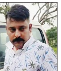
ଅର୍ଥୀ ଓ ପୁଲିସ ଯୋଗାଯୋଗ ଜବତ ହୋଇଛି। କାର ସହ ବନ୍ଧୁକ ଜବତ ହେବା ସହ ଅନେକ ପୁଲିସ ବ୍ୟାଗ୍ ମଧ୍ୟ ଜବତ ହୋଇଛି। କେଉଁଠି ପୁଲିସ, ଅର୍ଥୀ, ଆଇପିଏସ୍ ଜବତ ହୋଇଛି। ଏସପି ପରିଚୟ ଦେଉଥିବା ସୂଚନା ଭିନ୍ନ ଭିନ୍ନ ନାମ ଦିଆ ଜଣାପଡ଼ିଛି। ଏଭଳି ଏକ ଅଭିଯୋଗ ଠକକୁ