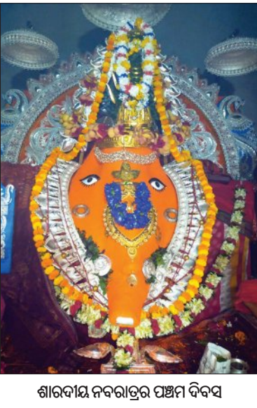
ଶାରଦାୟ ନବରାତ୍ରର ପଞ୍ଚମ ଦିବସ

ଝାଡ଼ଖଣ୍ଡରେ ଠକେଇର ଟେର ମୁଖ୍ୟ ଆକାରଖ୍ୟ ଖୋଲି ଚାଲିଥିବା କାରବାର ବ୍ୟାଙ୍କ ଦେଶନେଶୀ ୫୦ ଲକ୍ଷରୁ ଉର୍ଦ୍ଧ୍ୱ