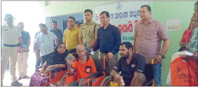
ବରା, ୨୨।୯ (ସମ୍ପାଦକ)