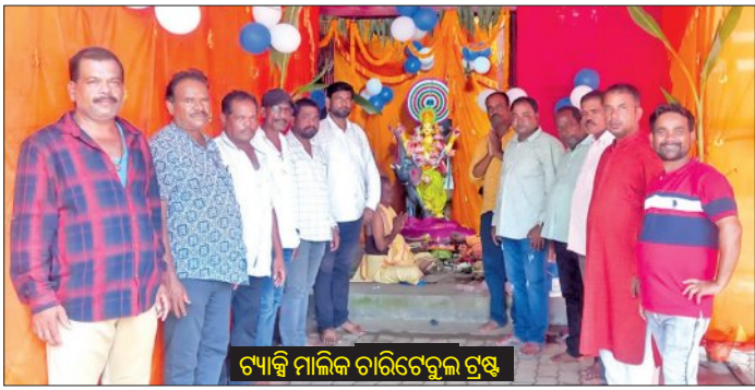
ଟ୍ୟାକ୍ସି ମାଲିକ ଚାରିଟେବୁଲ ଟ୍ରଷ୍ଟ