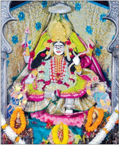
କଟକ ଚଣ୍ଡାଳ ସିଦ୍ଧେଶ୍ୱରୀ ବେଶ