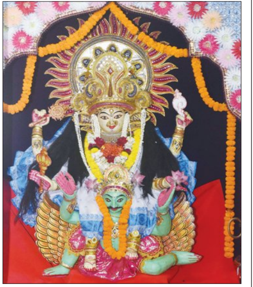
ଧାନ୍ତଲେଙ୍କା ବୈଷ୍ଣବୀ ବେଶ