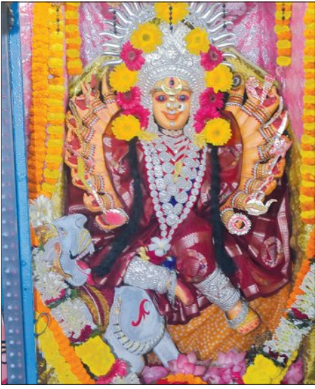
ବାସନ୍ତୀ ଦୁର୍ଗାଙ୍କ ତ୍ରିପୁରା ସୁନ୍ଦରୀ ବେଶ