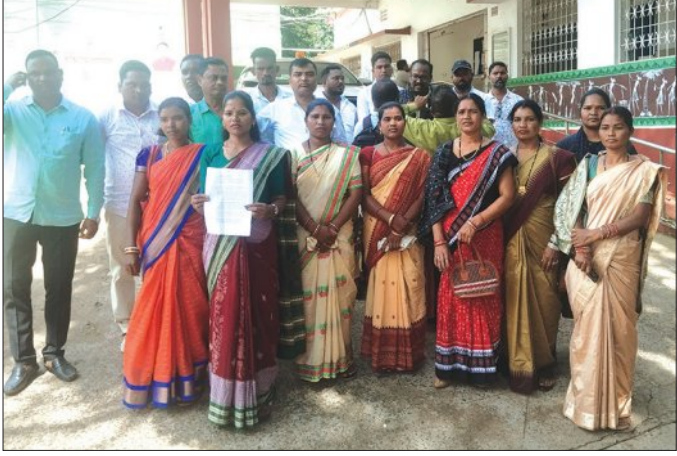
ଶିକ୍ଷକ ନିୟୁତ୍ତି ଏବଂ ଚିକିତ୍ସାକୁ ସୁଦୃଢ଼ କରିବା, ସ୍କୁଲ ଓ ଗଣଶିକ୍ଷା ଏବଂ ଏସଏସଡି ବିଭାଗ ଉଭୟ ଅଧୀନରେ ଅନେକ ଶିକ୍ଷକ