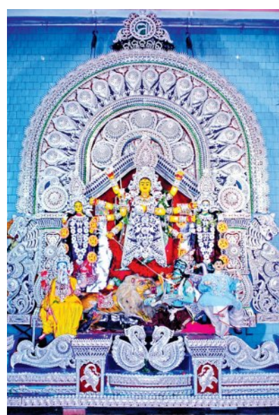
ବିନୋଦ ବିହାରୀ-ବାଲୁବଜାର ପୂଜା କମିଟି

କଟକ, ୧୬।୯ (ସମ୍ପାଦକ): କଟକର ପ୍ରଥମ ତଥା ସର୍ବପୁରାତନ ପୂଜା ମଣ୍ଡପ ରହିଛି ବିନୋଦ ବିହାରୀ-ବାଲୁବଜାରରେ । କୁହାଯାଏ, ୧୫୦୯ ମସିହାରୁ ଏଠାରେ ପୂଜାର୍ଚ୍ଚନା କରାଯାଇ ଆସୁଛି । ବିନୋଦ ବିହାରୀ-ବାଲୁବଜାର ପୂଜା କମିଟିର ଦୁର୍ଗାଙ୍କୁ ବଡ଼ ଭଜଣ ଆଖ୍ୟା ଦିଆଯାଇଛି । କିମ୍ବଦନ୍ତୀ ଅନୁସାରେ, ନଦୀର ନବଦୀପରୁ ପୁରୀ ଯିବା ବାଟରେ ମହାପ୍ରଭୁ ଶ୍ରୀଚୈତନ୍ୟ ମହାନଦୀର ଗଡ଼ଗଡ଼ିଆ ଘାଟରେ ଓହ୍ଲାଇଥିଲେ । ତତ୍କାଳୀନ ରାଜା ପ୍ରତାପରୁଦ୍ର ଦେବ ସାଗର କରିବା ସହ ରାଜବାଟିକାକୁ ଶ୍ରୀଚୈତନ୍ୟଙ୍କୁ ନିମନ୍ତ୍ରଣ କରିଥିଲେ । ଶ୍ରୀଚୈତନ୍ୟ ବିନୋଦବିହାରୀ ମନ୍ଦିରରେ ଅବସ୍ଥାନ କରିବାକୁ ଚାହୁଁଥିଲେ । ରହିଣ ସମୟରେ ଶରତକାଳୀନ ଦୁର୍ଗା ପୂଜା ପଡ଼ିବାରୁ ଶ୍ରୀଚୈତନ୍ୟ ନିଜ ହାତରେ ମା'ଙ୍କ ମୂର୍ତ୍ତି ଗତି ଦୁର୍ଗା ପୂଜା ଆରମ୍ଭ କରିଥିଲେ । ପୂଜା ମଣ୍ଡପରେ ମା'ଙ୍କ ବଜ୍ରୀୟ ପରମ୍ପରାରେ ପୂଜାର୍ଚ୍ଚନା କରାଯାଏ । ୧୦୮୯ ଉତ୍କଳ ବିଶିଷ୍ଟ ମା'ଙ୍କ ମୂର୍ତ୍ତିକୁ ବାମନାଜୀ ପରିବାରର ପୂଜକ ନିମାଣ କରିବାରେ