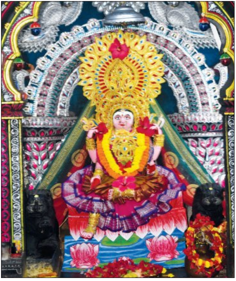
ଝଞ୍ଜିରାମଙ୍ଗଳାଙ୍କ ଲୁବନେଶ୍ୱରୀ ବେଶ