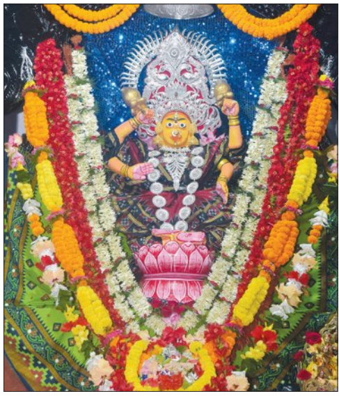
ଗଡ଼ୁଚଣ୍ଡାଳ କମଳା ବେଶ