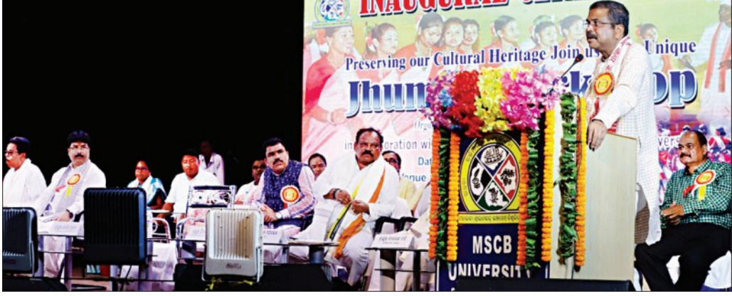
ବାର୍ତ୍ତାପତ୍ର, ୧୫।୯।୨୫ (ସମ୍ପାଦକ)

ବାର୍ତ୍ତାପତ୍ର ମହାରାଜା ଶ୍ରୀରାମଚନ୍ଦ୍ର ଭଞ୍ଜଦେଓ ବିଶ୍ୱବିଦ୍ୟାଳୟ କନଭେନସନ ହଲରେ ସୋମବାର ଓଡ଼ିଶା ଝୁମର ଏକାଡେମୀ ଆନୁକୂଲ୍ୟରେ ପୁରୀ ବିଶ୍ୱବିଦ୍ୟାଳୟରେ ଝୁମର କର୍ମଶାଳା ଉଦ୍ଘାଟିତ ହୋଇଛି। ଏଥିରେ ପୁଣ୍ୟାତ୍ମିୟ ଭାବରେ କେନ୍ଦ୍ର ଶିକ୍ଷାମନ୍ତ୍ରୀ ଧର୍ମେନ୍ଦ୍ର ପ୍ରଧାନ ଯୋଗଦେଇ କର୍ମଶାଳାକୁ ଉଦ୍ଘାଟନ କରି ଝୁମର ଅଞ୍ଚଳବାସୀଙ୍କ ସଂସ୍କାରର ଆଇନା ବୋଲି କହିଥିଲେ। ସେହିପରି ଉଚ୍ଚଶିକ୍ଷା ଉପସଚିବ କେନ୍ଦ୍ର ବିଶ୍ୱବିଦ୍ୟାଳୟରେ ଶ୍ରୀରାମଚନ୍ଦ୍ର ଭଞ୍ଜଦେଓ ପାଇଁ ରାଷ୍ଟ୍ରପତି ଭବନରେ ଆମେ ଏକତ୍ରିତ ହୋଇ କୁ-ପ୍ରିକ୍ସ ପ୍ରସ୍ତୁତ କରିବା ବୋଲି ଶ୍ରୀ ପ୍ରଧାନ ପ୍ରକାଶ କରିଥିଲେ।