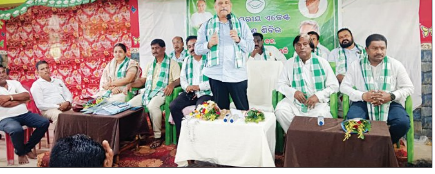
ବିଜେଡି ବୁଥ୍ ଏଜେଣ୍ଟ ତାଲିମ ଶିବିରରେ କର୍ମୀଙ୍କୁ ତାଲିମ ଦେବା ପାଇଁ ଯତ୍ନ କରାଯାଇଛି।

ଦଳିତ ମାଧ୍ୟମିକ ସ୍ତରରେ ବିଜେଡି କର୍ମୀଙ୍କୁ ତାଲିମ ଦେବା ପାଇଁ ପଟ୍ଟାମୁଣ୍ଡାଇରେ ବିଜେଡି ବୁଥ୍ ଏଜେଣ୍ଟ ତାଲିମ ଶିବିର ଅନୁଷ୍ଠାନ କରାଯାଇଛି।