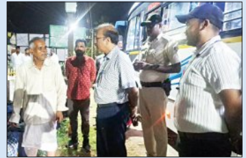
କେନ୍ଦ୍ରୀୟପଡ଼ାରେ ତୀର୍ଥଯାତ୍ରୀଙ୍କୁ ଯାତ୍ରା ପାଇଁ ପ୍ରସ୍ତୁତ କରିବା ପାଇଁ ବିନାମୀ ଯାତ୍ରା କର୍ମୀଙ୍କୁ ସ୍ୱାଗତ କରିଥିଲେ।

କେନ୍ଦ୍ରୀୟ, ୧୫:୦୯(ସମ୍ପାଦନା): ୧୦ ତାରିଖରେ ଭୁବନେଶ୍ୱରରୁ ଏକ ସ୍ୱଚ୍ଛ ଟ୍ରେନ ଯୋଗେ ଅଯୋଧ୍ୟା-ବାରଣାସୀ ଅଭିଯୁକ୍ତ ଯାତ୍ରୀଙ୍କୁ କେନ୍ଦ୍ରୀୟପଡ଼ାର ୧୦୮ ଜଣ ବରିଷ୍ଠ ନାଗରିକ ଆଜି ସଞ୍ଜ ୮ ଟାରେ କେନ୍ଦ୍ରୀୟପଡ଼ାରେ ପହଞ୍ଚିଛନ୍ତି।