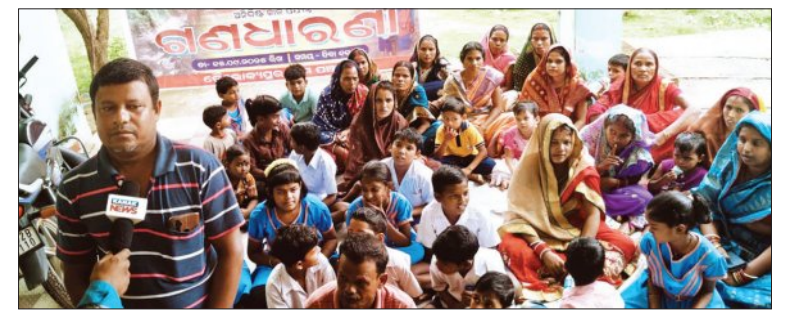
ବିଦ୍ୟାର୍ଥୀଙ୍କୁ ଅବରୋଧ ହଟାଇବାକୁ ଧାରଣା କରାଯାଇଛି। ଛାତ୍ରଛାତ୍ରୀଙ୍କୁ ସୁରକ୍ଷା ଦେବା ପାଇଁ ଯତ୍ନ କରାଯାଇଛି।

ରାଜକନିକା, ୧୫:୦୯(ସମ୍ପାଦନା): ରାଜକନିକା ପ୍ରାଥମିକ ବିଦ୍ୟାଳୟରୁ ଅବରୋଧ ହଟାଇବାକୁ ଛାତ୍ରଛାତ୍ରୀଙ୍କ ଧାରଣା କରାଯାଇଛି।