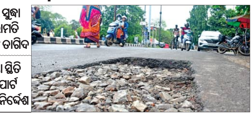
ଦୁରବସ୍ଥା ପାଇଁ ବିଭାଗ ମଧ୍ୟରେ ସମନ୍ୱୟର ଅଭାବ ରହିଥିବା ଶନିବାର ହୋଇଥିବା ଏକ ସମାକ୍ଷରୁ ସ୍ପଷ୍ଟ ଜଣାପଡ଼ିଛି। ରାଜ୍ୟରେ ରାସ୍ତାଘାଟ ମରାମତିକୁ ନେଇ ପୂର୍ଣ୍ଣ ମନ୍ତ୍ରୀ ପୂର୍ଣ୍ଣାଙ୍ଗ ହରିଚନ୍ଦନଙ୍କ

୨୦ ସେପ୍ଟେମ୍ବର ସୁଦ୍ଧା ସବୁ ରାସ୍ତା ମରାମତି ସାରିବାକୁ ମନ୍ତ୍ରୀଙ୍କ ତାରିଖ ୨ ଦିନରେ ରାସ୍ତା ସ୍ଥିତି ସମ୍ପର୍କରେ ରିପୋର୍ଟ ଦେବାକୁ ଯତ୍ନକୁ ନିର୍ଦ୍ଦେଶ ଦେବାକୁ ଯତ୍ନକୁ ନିର୍ଦ୍ଦେଶ