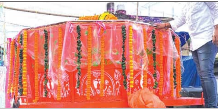
ଡାକ୍ତରଙ୍କ ସହ/ ଡାକ୍ତରଙ୍କ, ୨।୯ (ସମ୍ପାଦନା)

ଡାକ୍ତରଙ୍କର ଗଣପତି ଶ୍ରୀଗଣେଶ ପୂଜା ୨୭ରୁ ଆରମ୍ଭ ହୋଇଥିବା ବେଳେ ଆସନ୍ତା ୨ ତାରିଖ ଉପଯାପିତ ହେବା ଏହି ଉପଲକ୍ଷେ ଶନିବାର କେନ୍ଦ୍ରୀୟ ଗଣେଶ ପୂଜା କମିଟି ପକ୍ଷରୁ ଗଜାୟାଜ୍ଞ ଅଧିକାରୀଙ୍କୁ ନିଲାମ କାର୍ଯ୍ୟକ୍ରମ ରଖାଯାଇଥିଲା। ତେବେ ଏହି ନିଲାମ ସମାରୋହ ବର୍ଷ ସମ୍ପୂର୍ଣ୍ଣ ଫିକା ପଡ଼ିଯାଇଥିଲା। ବିଭ୍ରାଟ କାରଣରୁ ଅସମ୍ଭବ ହୋଇ କେନ୍ଦ୍ରୀୟ ଗଣେଶ ପୂଜା କମିଟି ସଭାପତି ତଥା ଡାକ୍ତରଙ୍କ ଉପକ୍ରମାୟକ କମିଟି ସଭାପତି ପଦରୁ ଉସ୍ତାଫା ଦେବାନେଇ ଖୋଲା ମଞ୍ଚରେ ପ୍ରକାଶ କରିଛନ୍ତି। ଲଢ଼ୁ ଗଣେଶ ମନ୍ଦିର ପାଖରୁ ଆସି