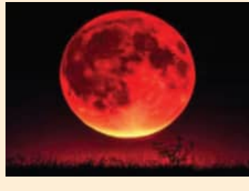
ମଧ୍ୟାହ୍ନ ୧୨.୫୭ରୁ ପାଳକାଳ ରାତି ୯.୫୭ରୁ ଗ୍ରହଣ ଆରମ୍ଭ ୧.୨୭ ମିନିଟ୍ରେ ସର୍ବମୋକ୍ଷ

ଚଳିତ ବର୍ଷର ଭାବେ ଶୁକ୍ଳ ପୂର୍ଣ୍ଣିମାରେ ଆକାଶରେ 'ରୁଦ୍ଧ ମୁନ' ଦୃଶ୍ୟମାନ ହେବ। ଚନ୍ଦ୍ରଗ୍ରହଣ ପାଇଁ ଶ୍ରୀମନ୍ଦିର ପ୍ରଶାସନ ପକ୍ଷରୁ ସ୍ୱତନ୍ତ୍ର ନାଟିନିର୍ଦ୍ଦେଶ କରାଯାଇଛି। ଏହି ଦିନ ଶ୍ରୀମନ୍ଦିରରେ ବିଶେଷ ନାଟି ଉତ୍ସବୋଦିତ ହେବ। ଗ୍ରହଣ ସ୍ୱର୍ଣ୍ଣ ପରେ ଶ୍ରୀମନ୍ଦିରରେ ଗ୍ରହଣ ମହାସ୍ନାନ ଓ ଗ୍ରହଣ ଭୋଗ ନାଟି ସରି ଅନ୍ୟାନ୍ୟ ନାଟି କରାଯିବ। ଶ୍ରୀମନ୍ଦିର ପ୍ରଶାସନ ପକ୍ଷରୁ ଗ୍ରହଣ ପାଇଁ ହୋଇଥିବା ସ୍ୱତନ୍ତ୍ର ନାଟି ଅନୁଯାୟୀ, ଶନିବାର ରାତି ୯ଟା ୫୭ ମିନିଟ୍ ୨୨ ସେକେଣ୍ଡରେ ଗ୍ରହଣ ଆରମ୍ଭ ହେବ। ଶ୍ରୀମନ୍ଦିର ପ୍ରଶାସନ ନାଟିକାଳି ତାଲିକା ଗ୍ରହଣ ସ୍ୱର୍ଣ୍ଣ ପରେ ଗ୍ରହଣ ମହାସ୍ନାନ, ଗ୍ରହଣଭୋଗ ଓ ଅନ୍ୟାନ୍ୟ ନାଟି ହେବ।