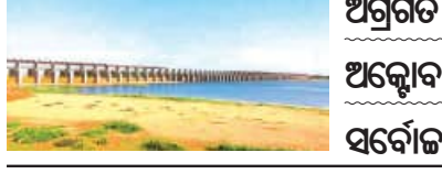
ଅଗ୍ରଗତି ତଥ୍ୟ ଦେବାକୁ ତ୍ରିତ୍ରୁ୍ୟନାଳ ନିର୍ଦ୍ଦେଶ ଅକ୍ଟୋବର ୧୧ ତାରିଖରେ ପରବର୍ତ୍ତୀ ଶୁଣାଣି ସର୍ବୋଚ୍ଚ ମନ୍ତ୍ରୀସଭା ଆଲୋଚନା ଆରମ୍ଭ

ସାରିଛନ୍ତି। ଗତ ୩୦ ତାରିଖରେ ଉଭୟ ରାଜ୍ୟର ମୁଖ୍ୟ ସଚିବ ନୂଆଦିଲ୍ଲୀରେ ଜଳ ବିବାଦ ଆପୋସ ସମାଧାନ ନେଇ ଆଲୋଚନା କରିଥିଲେ। ଗତକାଳି ଅର୍ଥାତ୍ ଶୁକ୍ଳବାର ଦୁଇ ରାଜ୍ୟର ଜଳ ସମ୍ପଦ ବିଭାଗର ସର୍ବୋଚ୍ଚ ମନ୍ତ୍ରୀ ଏବଂ ଗଠିତ