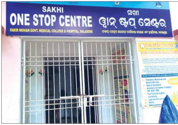
ଉଦ୍ଧାର କରି ଛାଡ଼ିଲା ପୁଲିସ୍, ଖସିଗଲେ ୨ ଅନ୍ତର୍ଭୁକ୍ତା ନିଖୋଜକୁ ୯ ଦିନ ବିତିଲା, ପୁଲିସ୍ ହାତ ଖାଲି

ସଂକ୍ଷିପ୍ତ ଓ ସାର୍ବଜନୀନ ସ୍ଥାନରେ ମହିଳା, ସୁରକ୍ଷା ଏବଂ ନାବାଳିକା ଉପରେ ହୋଇଥିବା ହିଂସାରୁ ସୁରକ୍ଷା ସହ ନାରୀମାନଙ୍କୁ ସାହାଯ୍ୟ ଓ ସମର୍ଥନ ପ୍ରଦାନ, ଚିକିତ୍ସା, ଆଇନ, ମନୋବିଜ୍ଞାନୀଙ୍କ ଓ କାଉନସିଲର ସହ ସ୍ୱଚ୍ଛତା ସେବା ସହ ଅସ୍ଥାୟୀ ସେଲଗର୍ ଭାବେ ବାଲେଶ୍ୱର ଜିଲ୍ଲାର ପକାର ମୋହନ ମେଡିକାଲ ବିଶ୍ୱବିଦ୍ୟାଳୟ କଲେଜରେ 'ସଖା' ଖାନ୍ ଷ୍ଟପ୍ ସେଣ୍ଟର। ଏଠାରେ ମାସିକ ୩୦ରୁ ଉର୍ଦ୍ଧ ନିର୍ଯାତ, ନିଷ୍ପେଷିତ, ଦୁର୍ଘଟଣ ଶିକାର ଆଇନ ସହାୟତା ତଥା ସୁରକ୍ଷା ଦୁର୍ଘଟଣାରୁ ପୁଲିସ୍ ନାବାଳିକାଙ୍କୁ ଶିଶୁ ମଙ୍ଗଳ କର୍ମଚାରୀ ହାଜର ପରେ ଶିଶୁ ମଙ୍ଗଳ କର୍ମଚାରୀ ନିର୍ଦ୍ଦେଶକ୍ରମେ ଖାନ୍ ଷ୍ଟପ୍ ସେଣ୍ଟରରେ ଛଡ଼ା ଯାଆନ୍ତୁ। ସୁରକ୍ଷା ଦୁର୍ଘଟଣା କୋଣାରୁ ସୁରକ୍ଷିତ ସ୍ଥାନ ଭାବି ଏଠାରେ