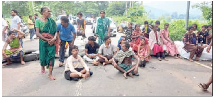
ବୌଦ୍ଧ ଜିଲ୍ଲା ହରଭଙ୍ଗା ବୁକ୍ କିଆଁକଟା ଗାଁରେ ବାଣ ବିସ୍ଫୋରଣ ଓ କ୍ଷତିପୂରଣ ଦାବିରେ ରାସ୍ତା ରୋକ