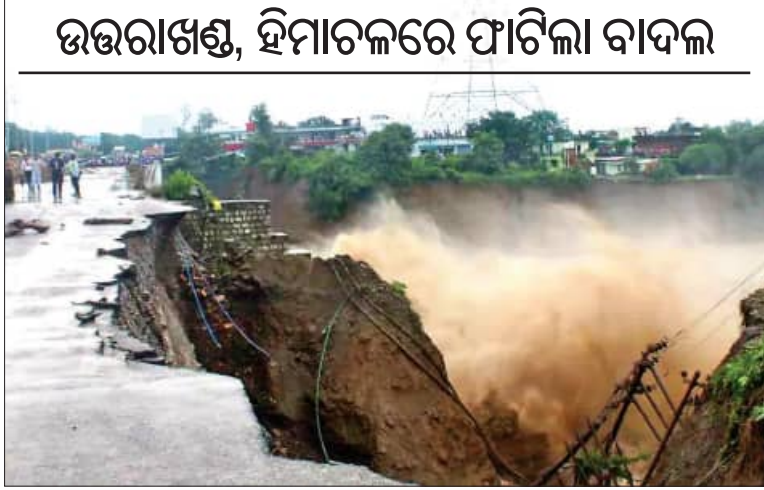
ଉତ୍ତରାଖଣ୍ଡ, ହିମାଚଳରେ ପାଟିଲା ବାଦଳ

■ ଭାରତ, ୧୭।୯ (ସଂକେଦ୍): ପ୍ରାକୃତିକ ବିପର୍ଯ୍ୟୟ ଦେବକୁମ୍ଭି ଉତ୍ତରଭାରତରେ ପଛା ଛାଡ଼ିନାହିଁ। ମୌସୁମୀ ଜନିତ ପ୍ରବଳ ବର୍ଷା ରାଜ୍ୟରେ ବିପର୍ଯ୍ୟୟ ସୃଷ୍ଟି କରିଛି। ଜନଜୀବନକୁ ବିପର୍ଯ୍ୟୟ କରିଦେଇଛି। ଆଜି ସକାଳ ୫ଟାରେ ଭାରତରେ ବାଦଳପତା ବର୍ଷା ଯୋଗୁଁ ତମସା, କାରଳିଗାଡ଼, ଚୋନ୍ଦୁ ଏବଂ ସହସ୍ରଧାରା ନଦୀର ଜଳସ୍ତର ବୃଦ୍ଧି ପାଇଛି। ସହସ୍ରଧାରା ସମେତ ଆଖପାଖ ଅଞ୍ଚଳର ଅନେକ ଘର, ଦୋକାନ ଏବଂ ମନ୍ଦିରରେ ଖୁବ୍ ଧୂଳି ପଡ଼ି ଯାଇଛି। ବିକାଶ ନଗରରେ ଚୋନ୍ଦୁ ନଦୀରେ ଅତୀତ ପାଣି ମାଡ଼ି ଆସିବାରୁ ଶ୍ରମିକଙ୍କୁ ନେଇ ଯାଉଥିବା ଏକ ଟ୍ରାକ୍ଟର-ଟ୍ରଲି ଭାଙ୍ଗି ଯାଇଛି। ଏଥିରେ ୮ ଜଣଙ୍କ ମୃତ୍ୟୁ ହୋଇଛି ଏବଂ ୪ ଜଣ ନିଖୋଜ।