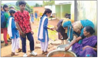
ଦେଖିବାକୁ ମିଳୁଛି। ବିଶେଷ ସ୍ତରରୁ ସୂଚନା ପାଇ ଗଣମାଧ୍ୟମ ପ୍ରତିନିଧିମାନେ ପହଞ୍ଚିବା ପରେ ଚରବରିଆ

କାକିରିଗୁମା, ୧୬।୯ (ସମିପ): ରାଜ୍ୟରେ ସମସ୍ତ ସରକାରୀ ବିଦ୍ୟାଳୟରେ ଦିନ ୧ଟା ସମୟରେ ମଧ୍ୟାହ୍ନଭୋଜନ ଯୋଗାଇବାର ବ୍ୟବସ୍ଥା ରହିଛି। ଦିନ ଅନୁସାରେ ବିଭିନ୍ନ ପ୍ରକାର ପୁଷ୍ଟାକାର ଖାଦ୍ୟ ଛାତ୍ରଛାତ୍ରୀଙ୍କୁ ଦେବାର ବ୍ୟବସ୍ଥା ରହିଛି। କୋରାପୁଟ ଜିଲ୍ଲା ଲକ୍ଷ୍ମୀପୁର ବ୍ଲକ ଅନ୍ତର୍ଗତ ଛତ୍ରପାଳ ସରକାରୀ ଉଚ୍ଚମିଡ଼ି ବିଦ୍ୟାଳୟରେ ଏହାର ବ୍ୟବସ୍ଥାକୁ ଦେଖିବାକୁ ମିଳୁଛି। ମଧ୍ୟାହ୍ନଭୋଜନ ପ୍ରଧାନ ମିଳୁନଥିବାରୁ କୁନିକୁନି ଛାତ୍ରଛାତ୍ରୀ ଭୋକ ଉପବାସରେ ଥାଇ ଧରି ଦୀର୍ଘ ସମୟ ପର୍ଯ୍ୟନ୍ତ ଖାଇବାକୁ ଅପେକ୍ଷା କରି ନିରାଶା ହେଉଥିବା