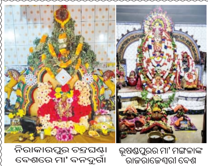
ନିରାକାରପୁର ଚନ୍ଦ୍ରପଣ୍ଡା ବେଶରେ ମା' ବନଦୁର୍ଗା। ଭୃଷ୍ଣପୁରର ମା' ମଙ୍ଗଳାଙ୍କ ରାଜରାଜେଶ୍ୱରୀ ବେଶ

ଦୃଷ୍ଟିରେ ରଖି ଜିଲ୍ଲା ପୂଜା ନିଶା ବେପାରୀଙ୍କୁ ସାବାଡ଼ କରିବାକୁ ଗୋଟିଏ ପରେ ଗୋଟିଏ ଅପରେସନ୍ ଆରମ୍ଭ କରିଛି। ଗତ ୧ ତାରିଖରୁ ଆରମ୍ଭ କରିଥିଲା ଅପରେସନ୍ ପ୍ରହାର। ଯାହା ୧୫ ତାରିଖରେ ଶେଷ ହୋଇଛି। ପ୍ରହାର ଯୋଗୁଁ ଏବେ ନିଶା ବେପାରୀ ଓ ମାଫିଆ ସହର ଛାଡ଼ି ଗାଁ ଗହଳିରେ ପ୍ରତ୍ୟେକ ସମୟରେ ଜାଗା ବଦଳାଉଥିବା କୁହାଯାଇଛି। ଜିଲ୍ଲା ପୂଜା ଅଞ୍ଚଳରେ, ଗତ ୧୬ରୁ ୧୫ ତାରିଖ ମଧ୍ୟରେ ଅପରେସନ୍ ପ୍ରହାରରେ ଜିଲ୍ଲା ପୂଜା ଅଞ୍ଚଳରେ ୧୧ ନିଶା ବେପାରୀ ଗିରଫ ହୋଇଛି। ୧୨ଜଣ ନିଶା ବେପାରୀଙ୍କ ବିରୋଧରେ କେସ୍ ହୋଇଥିବାବେଳେ ୧୧ ଜଣଙ୍କୁ ପୂଜାରେ ଗିରଫ କରିଛି। ଏଥିରେ ୧୮୩.୫୭ ଗ୍ରାମ୍ ବ୍ରାଉନ୍‌ସୁଗର ଜବତ ହୋଇଛି। ଜବତ ବ୍ରାଉନ୍‌ସୁଗର ମୂଲ୍ୟ ପ୍ରାୟ ୧୮ ଲକ୍ଷରୁ ଉର୍ଦ୍ଧ୍ୱ ହେବ। ସେହିପରି ୨୧କେଜି ଗଞ୍ଜୋଇ ଓ ୬ଲିଟର କଫସିରପ ଜବତ ହୋଇଛି। ପୂଜା ଅଞ୍ଚଳରେ ୧୧ ନିଶା ବେପାରୀ ଗିରଫ ହୋଇଛି। ୧୨ଜଣ ନିଶା ବେପାରୀଙ୍କ ବିରୋଧରେ କେସ୍ ହୋଇଥିବାବେଳେ ଅପରେସନ୍ ପ୍ରହାର ସବୁ ସବୁ ୧୬ ତାରିଖରୁ ପୂଜା ଅପରେସନ୍ ଦମନ' ଆରମ୍ଭ କରିଛି।