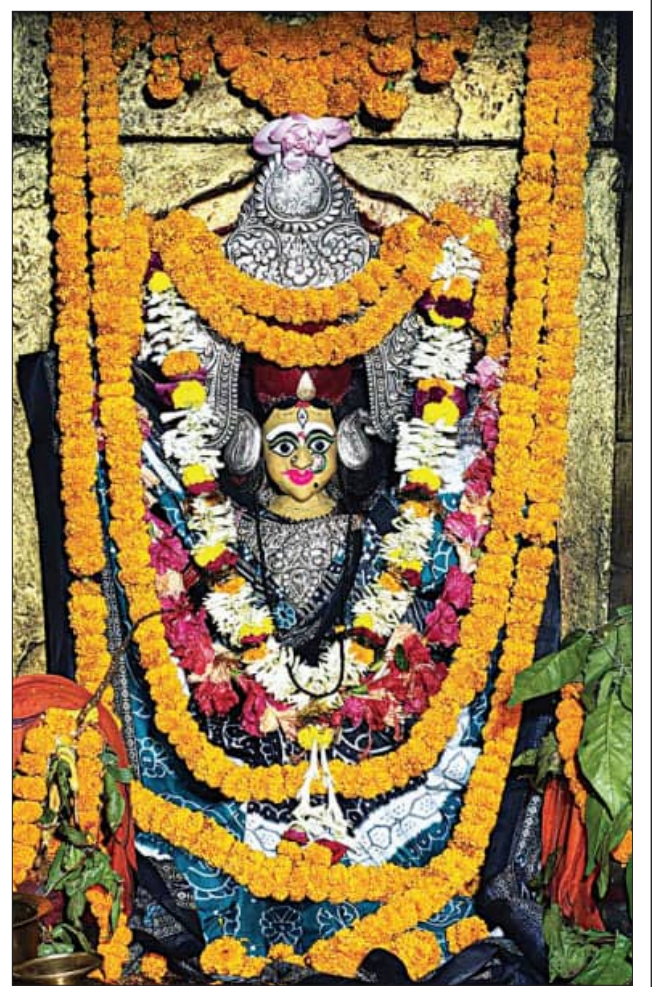
ଆରଡ଼ି ବାବାମଣିଙ୍କ ମନ୍ଦିରରେ ଜୟଦୁର୍ଗାଙ୍କ ଶୋଭାଦ୍ରବ୍ୟ ସଜାଯାଇ ପୂଜାରେ ମା'ଙ୍କ ସର୍ବମଙ୍ଗଳ ବେଶ

ନିମ୍ନମାନର ଏବଂ ଦିନକୁ ଦିନ ପିଚୁ ଉଠି ଯାଇଥିବା ଅଭିଯୋଗ ହୋଇଛି। ଏକି ଯଦି ନିମ୍ନମାନର କାମ ଜାରି ରହେ ଏବଂ ଜିଲ୍ଲା ପ୍ରଶାସନ, ଠିକାଦାର, ବିଭାଗୀୟ ଅଧିକାରୀ ଆମର ଦାବି ନ' ଶୁଣନ୍ତି, ତା ହେଲେ ଆଗାମୀ ଦିନରେ ଭଦ୍ରକ-ଆରଡ଼ି ରାଜ୍ୟ ରାଜପଥକୁ ଅବରୋଧ କରିବୁ ବୋଲି ସ୍ଥାନୀୟ ବାସିନ୍ଦା ଚେତାବନୀ ଦେଇଛନ୍ତି। ପୂର୍ବନାମରେ ଯେ ପୂର୍ବ ସରକାର ଅନୁମୋଦନ ଏହି ରାସ୍ତା କାର୍ଯ୍ୟର ଶିଳାନ୍ୟାସ କରାଯାଇଥିଲା। ଏହି ରାସ୍ତା ପାଇଁ ପ୍ରାୟ ୩୯ କୋଟି ଟଙ୍କା ମଞ୍ଜୁର କରାଯାଇ ଡେଇଁକରି ହୋଇଥିଲା। ପ୍ରାଥମିକ ପର୍ଯ୍ୟାୟରେ ଏହି ରାସ୍ତା ପାର୍ଶ୍ୱରେ ଥିବା ପ୍ରାଚୀନ ତଥା ବିରାଟକାୟ ଶହ ଶହ ଗଛକୁ କାଟି ଦିଆଯାଇଥିଲା। ତେବେ ରାସ୍ତା ନିର୍ମାଣ କାର୍ଯ୍ୟ ନ ହେବାରୁ ହୁଏତ ଚୋରାପତ୍ରି ଖାନାୟ ସଞ୍ଚଳକରାଯାଉ ତଥା ବାବାମଣି ପାଠକୁ ଯାଉଥିବା ପର୍ଯ୍ୟଟକ। ଏ ଦିନରେ ରାଜ୍ୟ ସରକାର ଗୁରୁତର ସହ ଦୃଷ୍ଟି ଦେବାକୁ ସାଧାରଣରେ ଦୃଢ଼ ଦାବି ହେଉଛି।