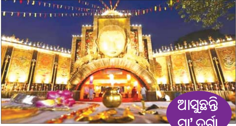
ଆସୁଛନ୍ତି ମା' ଦୁର୍ଗା