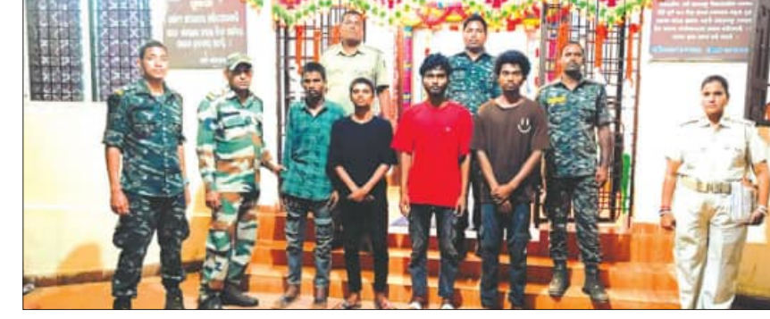
ଆନାରେ ମାଁ ବାରଖୁମ୍ ମୋଟର ଚାଳକ ସଂଘ ଏବଂ ଓଡ଼ିଶା ଡ୍ରାଇଭର ସଂଘ ପକ୍ଷରୁ ଏତଲା ଦିଆଯାଇଥିଲା।

ବୈପାରିଗୁଡ଼ା, ୧୪୧୯ (ସମ୍ପାଦକ): ବିନା ଟେଣ୍ଡରରେ ପାର୍କିଂ ଫି ଆଦାୟ ପଡ଼ିଲା ମହଙ୍ଗା। ବଟି ଆଦାୟ ମାମଲାରେ ୪ ଅଭିଯୁକ୍ତ ଗିରଫ କରି କୋର୍ଟ ଚଳାଣ କରିଛି ପୁଲିସ୍।