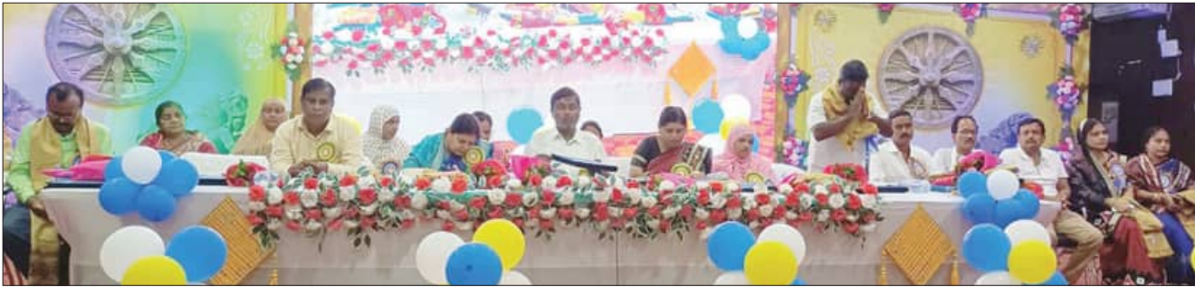
କେନ୍ଦ୍ରାପଡ଼ା, ଶାସନ (ସମିତି)

କେନ୍ଦ୍ରାପଡ଼ା ସ୍ଵାୟତ୍ତ ଶାସନ ଦିବସ ପାଳିତ ହୋଇଯାଇଛି। ସ୍ଵାୟତ୍ତ ଶାସନ ଦିବସ ପାଳିତ ହୋଇଯାଇଛି। ସ୍ଵାୟତ୍ତ ଶାସନ ଦିବସ ପାଳିତ ହୋଇଯାଇଛି।