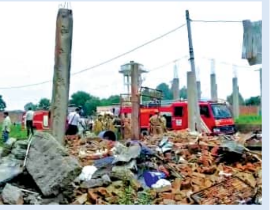
ମାଲିକ ଓ ପତ୍ନୀ ମୃତ

ଲକ୍ଷ୍ମୀ, ୩୧୮ (ସଂକ୍ଷେପ): ରବିବାର ସକାଳେ ଲକ୍ଷ୍ମୀର ଗୁଡ଼ା ଥାନା ଅଞ୍ଚଳରେ ବେହେରା ଗାଁରେ ଏକ ବେଆଇନ୍ ବାଣ କାରଖାନାରେ ବିସ୍ଫୋରଣ ଘଟି ୪ ଜଣ ପ୍ରାଣ ହରାଇଛନ୍ତି। ଏହି ପ୍ରକଣ୍ଠ ବିସ୍ଫୋରଣରେ ପୁରୀ କୋଠା ଉଡ଼ିଯିବା ସହ ପାଖରେ ଥିବା ଦୁଇଟି ଘର ମଧ୍ୟ ଭୁସ୍ଥି ପଡ଼ିଛି। ଆଉ କିଛି ଲୋକ ଆବର୍ଜନା ତଥା ଫସାବଶେଷ ତଳେ ଦବି ରହିଥିବା କୁହାଯାଇଛି। ମୃତକଙ୍କ ସଂଖ୍ୟା ବୃଦ୍ଧିପାଇବ ବୋଲି ଆଶଙ୍କା କରାଯାଇଛି। ଏଥିରେ କାରଖାନାର ମାଲିକ ଓ ତାଙ୍କ ପତ୍ନୀ ମୃତ୍ୟୁବରଣ କରିଛନ୍ତି ବୋଲି ପ୍ରତ୍ୟକ୍ଷଦର୍ଶୀ କହିଛନ୍ତି। ଗୁରୁତରଭାବେ ଆହତ ହୋଇଥିବା ଅନ୍ୟ ଦୁଇଜଣଙ୍କୁ କେକିଏମ୍ ସ୍ତ୍ରୀ ସେକ୍ସରେ ଚିକିତ୍ସା କରାଯାଉଛି। ସେମାନଙ୍କ ଶରୀର ପ୍ରାୟ ୬୦ ପ୍ରତିଶତ ଜଳିଯାଇଛି। ଫୋରେନସିକ ଟିମ୍ ଘଟଣାସ୍ଥଳରୁ ନମୁନା ସଂଗ୍ରହ କରିବା ସହ ପୁଲିସ୍ ତଦନ୍ତ ଜାରି ରଖିଛି।