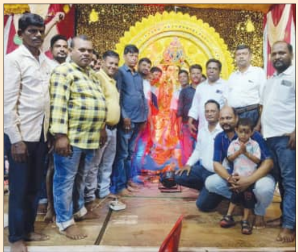
ବଡ଼ଚାଳୀ ସାହି ଶିଶୁପାଳଚନ୍ଦ୍ର ଗଣେଶ ପୂଜା ଭସାଣି ଉତ୍ସବ