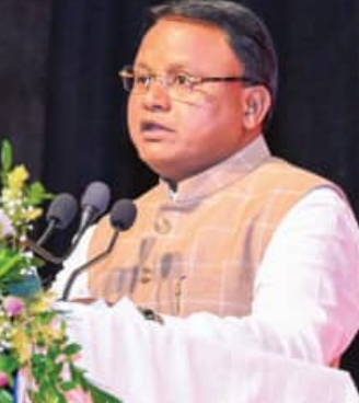
ବୌଦ୍ଧ, ଗଞ୍ଜାମ ଜିଲ୍ଲାର ଭଞ୍ଜନଗର, ଆୟା, ଛତ୍ରପୁର, କବିସୂର୍ଯ୍ୟନଗର, ପୋଲସରା ସହରାଞ୍ଚଳଗୁଡ଼ିକୁ ମ୍ୟୁନିସିପାଲିଟି କରାଯିବ ବୋଲି ମୁଖ୍ୟମନ୍ତ୍ରୀ କହିଛନ୍ତି।

ଭୁବନେଶ୍ୱର, ୩୧୮ (ସମ୍ପାଦକ): ସାଫ୍ତ୍ୟ ଶାସନ ଦିବସ ପାଳନ ଅବସରରେ ମୁଖ୍ୟମନ୍ତ୍ରୀ ମୋହନ ତରଣ ମାତ୍ ରାଜ୍ୟରେ ଆଇ ୧୬ ସହରକୁ ଏନ୍‌ଏସି ଓ ୭ ସହରକୁ ମ୍ୟୁନିସିପାଲିଟି କରାଯିବ ନିମନ୍ତେ ଘୋଷଣା କରିଛନ୍ତି। ବଲାଙ୍ଗୀର ଜିଲ୍ଲାର ଲୋଇଫିଝା, ବରଗଡ଼ ଜିଲ୍ଲାର ସୋହେଲା, କଟକ ଜିଲ୍ଲାର ବଡ଼ପା, ନରସିଂହପୁର, ସାଲେପୁର, ଡେକାନାଲ ଜିଲ୍ଲାର ଚୌଧିଆ, ଗଞ୍ଜାମ ଜିଲ୍ଲାର ପାତ୍ରପୁର ଓ ଜଗନ୍ନାଥ ପ୍ରସାଦ, ସାଲପୁର ଜିଲ୍ଲାର ବଣ୍ଡାଖୋଲ, କଳାହାଣ୍ଡି ଜିଲ୍ଲାର ନର୍ଲା ଓ ଜୟପାଟଣା, ଖୋର୍ଦ୍ଧା ଜିଲ୍ଲାର ଟାଙ୍ଗା, କୋରାପୁଟ୍ ଜିଲ୍ଲାର ବୋରିଗୁମ୍ମା ଏବଂ ମୟୂରଭଞ୍ଜ ଜିଲ୍ଲାର କସ୍ତିପଦା, ଯଶାପୁର ଓ ରାସଗୋବିନ୍ଦପୁରଗୁଡ଼ିକୁ ଏନ୍‌ଏସି ହେବ। ମୟୂରଭଞ୍ଜ ଜିଲ୍ଲାର କରଞ୍ଜିଆ, ବୌଦ୍ଧ ଜିଲ୍ଲାର