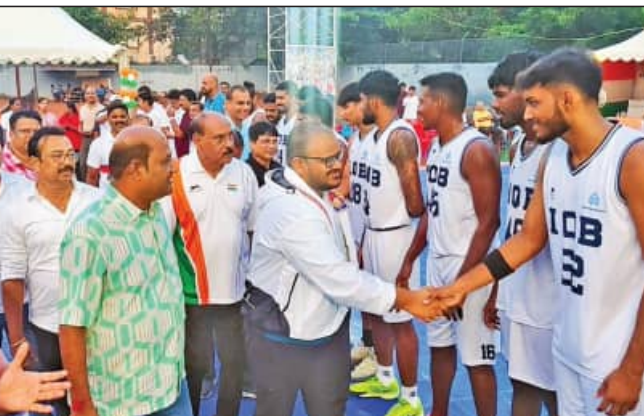
ବିଭାଗରେ ଆୟୋଜିତ ଏହି ସର୍ବଭାରତୀୟ ବାସ୍କେଟବଲ୍ ପ୍ରତିଯୋଗିତାରେ ଇଣ୍ଡିଆନ୍ ଓଭରସିକ୍ ବ୍ୟାଙ୍କ (ଗାମିଲନାହୁ), ଦକ୍ଷିଣପୂର୍ବ ରେଳବାଇ (କୋଲକୋଟା), ଶତଶତ ଓ ବିନାସପୁର ସମେତ ରାଉରକେଲା, କଟକ, ଓଡ଼ିଶା ରାଜ୍ୟ ଟିମ୍ ସମେତ ଗଞ୍ଜାମ ଦଳ ସାମିଲ ହୋଇଛନ୍ତି।

ବ୍ରହ୍ମପୁର, ୧୬।୮ (ସମ୍ପାଦକ) ଓଡ଼ିଶା ବାସ୍କେଟବଲ୍ ଆସୋସିଏସନର ସହଯୋଗରେ ତଥା ମତର୍ଣ୍ଣ ଯୁଥ କ୍ଲବ୍ ଓ ଆଲ୍ଲା ସ୍ପୋର୍ଟ୍ସ କ୍ଲବର ମିଳିତ ଆନୁକୂଲ୍ୟରେ ସ୍ପୋର୍ଟ୍ସ ଏରିନାରେ ପ୍ରଥମ ଇଣ୍ଡିପେଣ୍ଡେନ୍ସ୍ କପ୍ ବାସ୍କେଟବଲ୍ ଟୁର୍ଣ୍ଣାମେଣ୍ଟର ଆୟୋଜନ କରାଯାଇଛି।