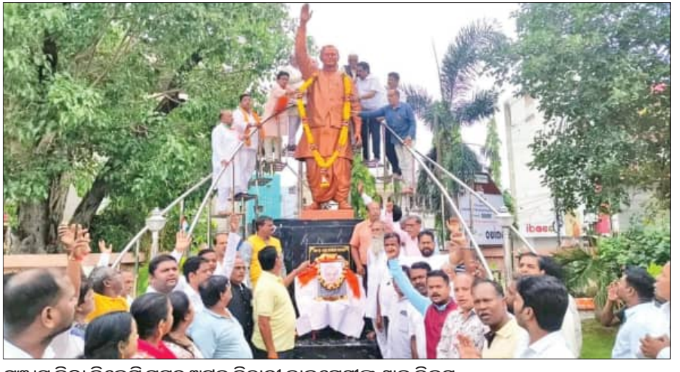
ଗଞ୍ଜାମ ଜିଲ୍ଲା ବିଜେପି ପକ୍ଷରୁ ଅଟଳ ବିହାରୀ ବାଳପୟୋଙ୍କ ଶ୍ରାଦ୍ଧ ଦିବସ