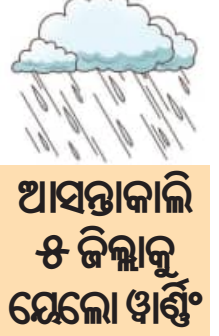
ଆସନ୍ତା ଆଉ ଏକ ଲଘୁତାପ ହେବାର ସମ୍ଭାବନା ରହିଛି। ଆସନ୍ତା ୧୯ ତାରିଖ ଯାଏଁ ପ୍ରବଳ ବର୍ଷା ସହ ଝଡ଼ି ପବନ ଓ ବିଜୁଳି ଘଡ଼ଘଡ଼ି ହେବା ନେଇ ପାଣିପାଗ ବିଭାଗ ଖବର ଦେଇଛି।