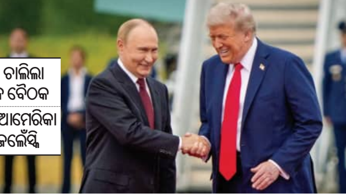
ଡିନି ଘଣ୍ଟା ଚାଲିଲା ଟ୍ରମ୍ପ-ପୁଟିନ ବୈଠକ

ୱାଶିଂଟନ, ୧୬।୮ (ଏକେଡି): ଆମେରିକା ରାଷ୍ଟ୍ରପତି ଡୋନାଲ୍ଡ ଟ୍ରମ୍ପ ଓ ରୁଷ ରାଷ୍ଟ୍ରପତି ଭ୍ଲାଦିମିର ପୁଟିନଙ୍କ ମଧ୍ୟରେ ବହୁଚର୍ଚ୍ଚିତ ଆଲୋଚନା ଶିଖର ବୈଠକ ଶେଷ ହୋଇଛି।