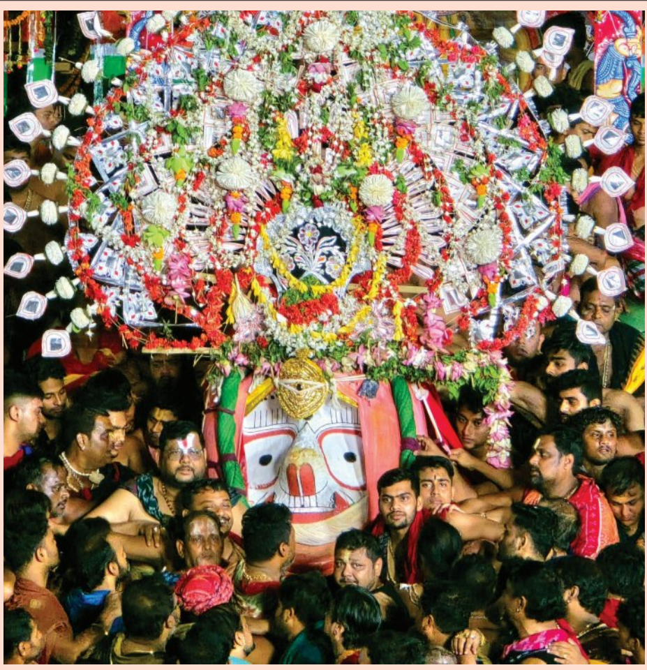
ରତ୍ନବେଦୀକୁ ବିଜେ କରୁଛନ୍ତି ମହାପ୍ରଭୁ ବଳଭଦ୍ର