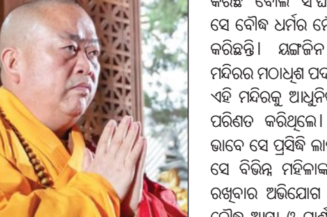
କାର୍ଯ୍ୟ ବୌଦ୍ଧ ସମ୍ପ୍ରଦାୟର ପ୍ରତିଷ୍ଠା ଓ ଭିକ୍ଷୁଙ୍କ ଛବିକୁ ଗମ୍ଭୀର ଭାବେ ଯତ୍ନ ପହଞ୍ଚାଇବା ସହ କଳକିତ

ଝେଙ୍ଗେଝେ, ୨୮।୭ (ଏକେନ୍ଦ୍ରି): ଚୀନର ଝେଙ୍ଗେଝେ ସହରରେ ଥିବା ପ୍ରସିଦ୍ଧ ଶାଓଲିନ୍ ବୌଦ୍ଧ ମନ୍ଦିରର ମହନ୍ତ ମହନ୍ତ ଶି ଯଜ୍ଞକିନଙ୍କୁ ପଦରୁ ବହିଷ୍କାର କରାଯାଇଛି। ଏକାଧିକ ମହିଳାଙ୍କ ସହ ସମ୍ପର୍କ ରଖିବା ଓ କେତେକ ଅଧିକାରୀଙ୍କ ସହ ଯାତ୍ରା ପିତା ହେବା ସହିତ ମନ୍ଦିର ସମ୍ପତ୍ତି ଆଉ ପାଣି ହତ୍ୟା କରିବା ଅଭିଯୋଗରେ ତାଙ୍କୁ ବରଖଣ୍ଡ କରାଯାଇଛି। ଚୀନର ତେଲି ରିପୋର୍ଟରେ ଏହି ସୂଚନା ଦିଆଯାଇଛି। ସରକାରୀ ଏକେନ୍ଦ୍ରିଗୁଡ଼ିକ ମାମଲାର ତଦନ୍ତ ଆରମ୍ଭ କରିଛନ୍ତି। ଛତିମଧ୍ୟରେ ଚୀନର ବୌଦ୍ଧ ସଂଘ ଶି ଯଜ୍ଞକିନଙ୍କଠାରୁ ତାଙ୍କ ଦାକ୍ଷା ପ୍ରମାଣପତ୍ର ଛତାଉନେଇଛନ୍ତି। ଯଜ୍ଞକିନ