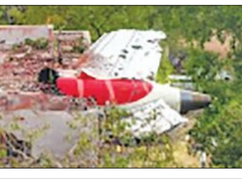
ଜରୁରୀ ଯାନ୍ତ୍ରିକ ସ୍ଥିତି ସୃଷ୍ଟି ହେଲେ ପାଇଲଟ୍ ସ୍ପିଡ୍ ବନ୍ଦ କରିବେ: ବିଶେଷଜ୍ଞ

ନୂଆଦିଲ୍ଲୀ, ୧୧୭ (ଏକେନ୍ଦ୍ର): ଅହମଦାବାଦ ବିମାନ ଦୁର୍ଘଟଣାର ପ୍ରାରମ୍ଭିକ ଯାଞ୍ଚରେ ବୋଇଲି ୭୮୭ ଡ୍ରମ୍ ଲାଇନରରେ କୌଣସି ଯାନ୍ତ୍ରିକ ତ୍ରୁଟି ଥିବା ଜଣାପଡ଼ି ନାହିଁ। 'ଝାଲ୍ ସ୍ପିଡ୍ କର୍ଣ୍ଣାଲ୍' ରିପୋର୍ଟରେ ଏହି ଦାବି କରାଯାଇଛି। ରିପୋର୍ଟ ଅନୁଯାୟୀ ବିମାନର ଇନ୍ଦନ ଇଞ୍ଜିନକୁ ଇନ୍ଦନ ଯୋଗାଣ ନିୟନ୍ତ୍ରଣ କରୁଥିବା ସ୍ପିଡ୍ ବନ୍ଦ କରିଦିଆ ଯାଇଥିଲା। ଏଥିପାଇଁ ଉଡ଼ାଣ ପରେ ଇଞ୍ଜିନକୁ ଶକ୍ତି (ଥ୍ରଷ୍ଟ) ଯୋଗାଣ ବନ୍ଦ ହୋଇ ଯାଇଥିଲା। ସାଧାରଣତଃ ଇଞ୍ଜିନ ଚାଲୁ କିମ୍ବା ବନ୍ଦ କରିବା, କୌଣସି ଜରୁରୀକାଳୀନ ସ୍ଥିତିରେ ରିପୋର୍ଟ କରିବା ପାଇଁ ପାଇଲଟ୍ ଏହି ସ୍ପିଡ୍ ବନ୍ଦ ହେବା କରିଥାନ୍ତି। ଅନ୍ୟପକ୍ଷରେ କେନ୍ଦ୍ର ସରକାର ଦୁର୍ଘଟଣାର ପ୍ରାଥମିକ ତଦନ୍ତ ରିପୋର୍ଟକୁ ଖୁବ୍ ଶୀଘ୍ର ସାର୍ବଜନୀନ କରିପାରନ୍ତି। ଏୟାରକ୍ରାଫ୍ଟ୍ ଆଞ୍ଚିତେଣ୍ଡ ଇନଭେଷ୍ଟିଗେସନ୍ ବ୍ୟୁରୋ (ଏଏଆଇବି) ଏହି ମାମଲାର ତଦନ୍ତ କରୁଛି। ନିୟମ ଅନୁଯାୟୀ ଦୁର୍ଘଟଣାର ୩୦ ଦିନ ଭିତରେ ଏହି ରିପୋର୍ଟ ଅପଲୋଡ୍ କରିବାକୁ ପଡ଼ିଥାଏ। ସୂଚନାଯୋଗ୍ୟ ଯେ