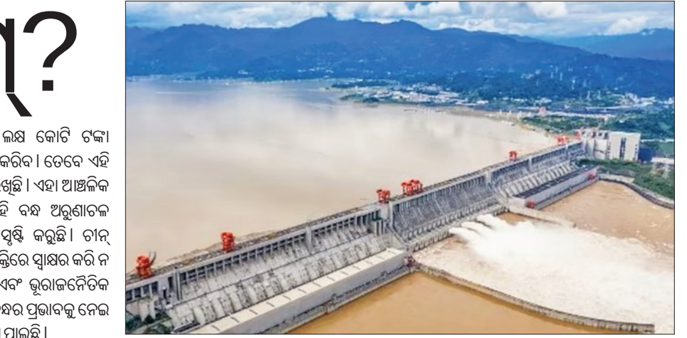
ପଞ୍ଜୀ ଟିକିତର ଅର୍ଥସହିଦିମାହାରୁ ଏହି ନଦୀର ଉତ୍ପତ୍ତି ହୋଇଛି। ଭାରତ ମଧ୍ୟ ଏଭଳି ସମସ୍ୟା ସ୍ଥିତିକୁ ସାମ୍ବାଳି କରିବାକୁ ଏକ ବହୁମୁଖୀ ପ୍ରକଳ୍ପ ଆରମ୍ଭ କରିବାକୁ ଯୋଜନା କରିଛି। ଏହି ପ୍ରକଳ୍ପ ହେଲେ ଚାନ୍ ପାଣି ଛାଡିଲେ ଭାରତ ଏହି ପାଣିକୁ ରୋକିବାରେ ସମର୍ଥ ହେବ। ଭାରତ ଏଥିପାଇଁ ଜଳ ଭଣ୍ଡାର କରିବା ସହ ସମାବନ୍ଧ ବନ୍ୟାକୁ ରୋକିବା ପାଇଁ ଚାନ୍ ନିୟନ୍ତ୍ରଣ କ୍ଷମତାକୁ

ପ୍ରତି ବଡ଼ ବିପଦ ସୃଷ୍ଟି କରୁଛି। ଚାନ୍ ଅନ୍ତର୍ଜାତୀୟ ଜଳ ବୁଝିରେ ସ୍ଵାକ୍ଷର କରି ନ ଥିବାରୁ ପରିବେଶ ଏବଂ ଭୂରାଜନୈତିକ ସ୍ଥିତି ଉପରେ ଏହି ବନ୍ଧର ପ୍ରଭାବକୁ ନେଇ ଗଭୀର ଚିନ୍ତା ପ୍ରକାଶ ପାଇଛି। ପଞ୍ଜୀ ଟିକିତର ଅର୍ଥସହିଦିମାହାରୁ ଏହି ନଦୀର ଉତ୍ପତ୍ତି ହୋଇଛି। ଭାରତ ମଧ୍ୟ ଏଭଳି ସମସ୍ୟା ସ୍ଥିତିକୁ ସାମ୍ବାଳି କରିବାକୁ ଏକ ବହୁମୁଖୀ ପ୍ରକଳ୍ପ ଆରମ୍ଭ କରିବାକୁ ଯୋଜନା କରିଛି। ଏହି ପ୍ରକଳ୍ପ ହେଲେ ଚାନ୍ ପାଣି ଛାଡିଲେ ଭାରତ ଏହି ପାଣିକୁ ରୋକିବାରେ ସମର୍ଥ ହେବ। ଭାରତ ଏଥିପାଇଁ ଜଳ ଭଣ୍ଡାର କରିବା ସହ ସମାବନ୍ଧ ବନ୍ୟାକୁ ରୋକିବା ପାଇଁ ଚାନ୍ ନିୟନ୍ତ୍ରଣ କ୍ଷମତାକୁ