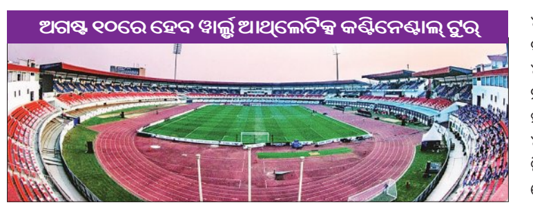
ଅଗଷ୍ଟ ୧୦ରେ ହେବ ଖାଲ୍ଡୁ ଆଥଲେଟିକ୍ସ କର୍ଣ୍ଣିନେସ୍‌ଆଲ୍ ଟୁର୍

ଦୀର୍ଘ ୮ ବର୍ଷ ପରେ ଆଜ୍ଞାନିକ କଳିଙ୍ଗ ଷ୍ଟାଡିୟମକୁ ଫେରିଛି ଏକ ବିଶ୍ୱସ୍ତରୀୟ ଦୌଡ଼କୁଦ ପ୍ରତିଯୋଗିତା । ଅଗଷ୍ଟ ୧୦ରେ କଳିଙ୍ଗ ଷ୍ଟାଡିୟମର ମୁଖ୍ୟ ପିଚ୍‌ରେ ଆୟୋଜିତ ହେବ ଖାଲ୍ଡୁ ଆଥଲେଟିକ୍ସ କର୍ଣ୍ଣିନେସ୍‌ଆଲ୍ ଟୁର୍ ଗ୍ରୋସ୍ ଜେଲ୍‌ମି ନିର୍ । ଖାଲ୍ଡୁ ଆଥଲେଟିକ୍ସ (ଡବ୍ଲ୍ୟୁଏ), ଆଥଲେଟିକ୍ସ ଫେଡେରେସନ ଅଫ୍ ଇଣ୍ଡିଆ (ଏଏସ୍‌ଆଇ) ଓ ରାଜ୍ୟ ସରକାରଙ୍କ କ୍ରୀଡ଼ା ବିଭାଗର ମିଳିତ ସହଯୋଗରେ ଆୟୋଜିତ ହେବାକୁ ଥିବା ଏହି ମେଗା ଇଭେଣ୍ଟରେ ଆୟୋଜକ ଭାରତ ସମଗ୍ର ୧୦ଟି ଦେଶର କ୍ରୀଡ଼ାବିତ୍‌ମାନଙ୍କୁ ଆକର୍ଷଣ କରିବ । ଶେଷ ଓ ପ୍ରଥମଦିନ ଲାଗି ୨୦୨୬ରେ କଳିଙ୍ଗ ଷ୍ଟାଡିୟମରେ ସିଆର୍ ଆଥଲେଟିକ୍ସ ରାମିଆନସିପ୍ ଅନୁଷ୍ଠିତ ହୋଇଥିଲା । ସେତେବେଳେ ଅନୁଷ୍ଠିତ ଏହି ଏଲିଟ୍ ଲେଭେଲ୍ ପ୍ରତିଯୋଗିତାରେ ୪୧୩୫ର ପାଖାପାଖି ୬୦୦ ଆଥଲେଟ୍ ଭାଗନେଇଥିଲେ ।