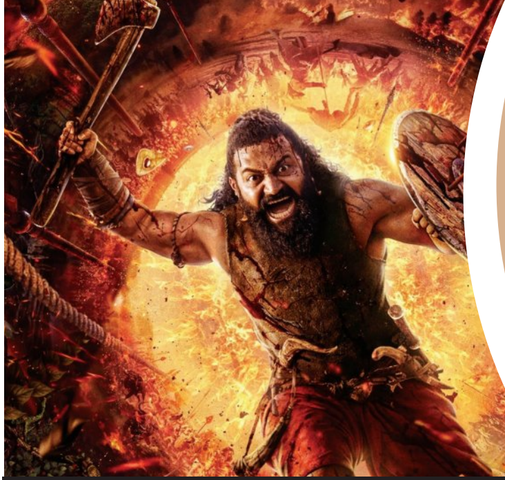
ଆସିଲା 'କାନ୍ତାରା: ଚାପୁର ୧' ପୋଷ୍ଟର