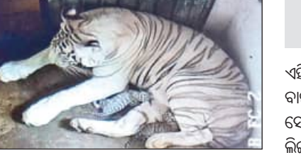
ବାଇଲେସର ସଫଳ ମିଳନ ପରେ ମୌସୁମୀ ଦ୍ୱିତୀୟ ଥର ପାଇଁ ମା' ହେବାର ସୂଚନା ମିଳିଛି। ଉଭୟ

ଛୁଆମାନଙ୍କ ଲିଙ୍ଗ ନିରୂପଣ ହୋଇପାରିନାହିଁ। ମା' ଛୁଆମାନଙ୍କର ଯତ୍ନ ନେଉଥିବା ଶାବକମାନଙ୍କୁ ସୁରୁ ଅଛନ୍ତି। ପ୍ରକାଶ ଆଉଟି, ୨୦୨୫ ଫେବୃଆରୀ ୨୭ ଏବଂ ୨୮ ତାରିଖରେ ମୌସୁମୀ ଏବଂ ସାଧାରଣ ରଙ୍ଗର ବାଉଁ