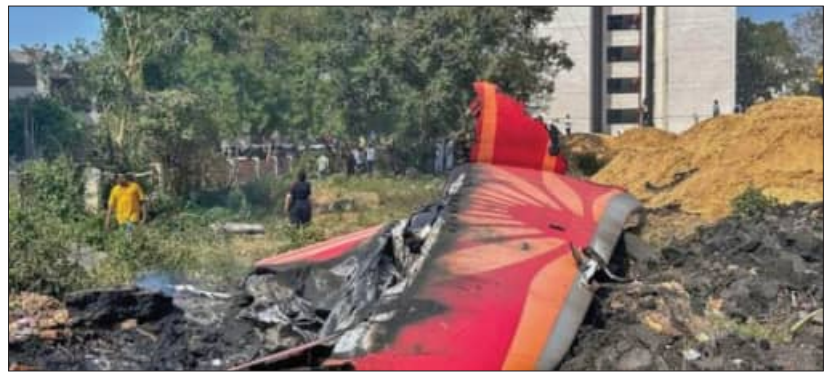
ଦୁର୍ଘଟଣାଗ୍ରସ୍ତ ବିମାନର ଅନ୍ତିମ ମୁହୂର୍ତ୍ତ