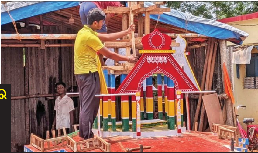
କାରିଗର । ଭକ୍ତ ଓ ଭାବରେ ଚାଲିଛି ରଥ ନିର୍ମାଣ କାର୍ଯ୍ୟ ।

ତଳା ତଳା ଆଖିରେ ଦର୍ଶନ ଦେବେ ଭକ୍ତଙ୍କୁ । କେବଳ ରଥ ଦୁହେଁ ପଥ ବି ପାଳିବିବିଭ ଭଗବାନଙ୍କ ସ୍ୱରୂପ । ବଡ଼ଭାଇ ବଳଭଦ୍ର ଓ ଭଉଣୀ ସୁଭଦ୍ରାଙ୍କୁ ସାଙ୍ଗରେ ନେଇ ମହାପ୍ରଭୁ ଯିବେ ମାଉସୀ ଘର । ତଳିତ ବର୍ଷ ଏକାମ୍ରକ୍ଷେତ୍ରରେ ଛୋଟ ବଡ଼ ମିଶି ପ୍ରାୟ ୫୪ଟି ରଥ ଗଢ଼ିବ ବୋଲି ସୂଚନା ରହିଛି । ଯଦିଓ ଏପର୍ଯ୍ୟନ୍ତ କୌଣସି ନିଷ୍ପତ୍ତି ହୋଇନାହିଁ ତଥାପି ବିଶେଷ ସୂତ୍ରରୁ ଏହା ଜଣାପଡ଼ିଛି । ରାଜଧାନୀରେ ଥିବା ବିଭିନ୍ନ ଶ୍ରୀଜଗନ୍ନାଥ ମନ୍ଦିରରେ ରଥଯାତ୍ରା ପାଇଁ ପ୍ରସ୍ତୁତି କୋରଦାର ଚାଲିଛି । ରଥ ନିର୍ମାଣ କାର୍ଯ୍ୟରେ ନିମଗ୍ନ