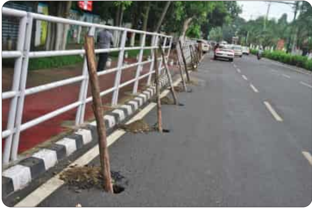
ଠିକାଦାର ପୋଷାଣ! ରାଜଭବନ-ପାଖର ହାତରୁ ରାସ୍ତାକଡ଼ରେ ଲୁହା ବ୍ୟାରିକେଟ୍ ଆଉଁସ୍‌ରୁ କାଠ ବାରିକେଟ୍ କାହିଁକି

ବସ୍‌ଗୁଡ଼ିକ (ଜାତୀୟ ରାଜପଥ ନମ୍ବର-୧୬ ରେ) ରସୁଲଗଡ଼ ରେଳସ୍‌ଟେସିଠାରୁ ଠିକ୍ ଠାରୁ ସର୍ଭିସ୍ ରୋଡ୍‌ରେ ଆସି ବାଣାବିହାର ଛକରୁ ଆରାମ୍ୟ ବିହାର ଛକରୁ ତାହାଣ ମୋଡ୍ ନେଇ ଆପୋଲୋ ହସ୍ପିଟାଲ୍ - ସୈନିକ ସ୍କୁଲ ଦେଇ ଯିବ। ଖାଣ୍ଡା ପଟୁ ଆସୁଥିବା ବସ ଗୁଡ଼ିକ (ଜାତୀୟ ରାଜପଥ ନମ୍ବର-୧୬ ରେ) ଜୟଦେବ ବିହାର ପୁ୍ୟ ଓଭର ବ୍ରିଜ୍ ଅତିକ୍ରମ କଲାପରେ ସର୍ଭିସ୍ ରୋଡ୍ ଆରାମ୍ୟ ବିହାର ଛକରେ ବାମ ମୋଡ୍ ନେବ। ପରେ ଆପୋଲୋ ହସ୍ପିଟାଲ୍ - ସୈନିକ ସ୍କୁଲ ରାସ୍ତା - ନାଲକୋ ଛକ - କଳିଙ୍ଗ ହସ୍ପିଟାଲ୍ ରାସ୍ତା - ରେଳସ୍‌ଟେ କଲୋନା ଦେଇ ଯିବ। ୨୦ ତାରିଖ ଦିନ ଅପରାହ୍ଣ ୩ ଘଟିକା ଠାରୁ ସନ୍ଧ୍ୟା ୬ ଘଟିକା ପର୍ଯ୍ୟନ୍ତ କିମ୍ବା କାର୍ଯ୍ୟକ୍ରମ ସମାପ୍ତ ହେବ। ପର୍ଯ୍ୟଟକ ବ୍ୟାପକ ଗ୍ରାମିଣ କଟକଣା ହେବାର ଅନୁମତି କରାଯାଇଛି। ପୁଲିସ୍ କଟକଣା କରିଥିବା ରାସ୍ତାରେ ନ ଯାଇ ଅନ୍ୟ ରାସ୍ତା ଦେଇ ଯାତାୟତ କରିବା ନିମନ୍ତେ ପୁଲିସ୍ ନିବେଦନ କରିଛି। ଏହି କଟକଣା କଟକଣାଗୁଡ଼ିକ ଜରୁରିକାଳୀନ ସେବାରେ ନିଯୋଜିତ (ଫାୟାର ଓ ଆମ୍ବୁଲାନ୍ସ) ଯାନବାହାନ ଗୁଡ଼ିକ ନିମନ୍ତେ ଉପରୋକ୍ତ କଟକଣା ଲାଗୁ ହେବ ନାହିଁ ବୋଲି ପୁଲିସ୍ କହିଛି।