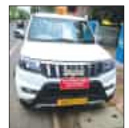
ତଦନ୍ତ ପାଇଁ କଳାହାଣ୍ଡିର ଜିଲ୍ଲାପାଳଙ୍କୁ ନିର୍ଦ୍ଦେଶ ଦିଆଯାଇଛି ।

ଭୁବନେଶ୍ୱର,୧୮।୬(ସମିପ): କଳାହାଣ୍ଡି ଜିଲ୍ଲାର ଜଣେ ଆଇଏସ୍‌ସି ପ୍ରୋବେସନର ସରକାରୀ ସୁବିଧାର ଅପବ୍ୟବହାର କରିବା ମହତ୍ତ୍ୱପୂର୍ଣ୍ଣ । ଗୋଟିଏ ଗାଡ଼ିରେ ନାଲିବତା ସାଙ୍ଗକୁ ଆଇଏସ୍‌ସି ପ୍ରୋବେସନର ଫ୍ଲୋଟ, ଲଗାଇବା ଘଟଣାରେ ତଦନ୍ତ ନିର୍ଦ୍ଦେଶ ଦିଆଯାଇଛି । ସାଧାରଣ ପ୍ରଶାସନ ବିଭାଗ ସ୍ୱତନ୍ତ୍ର ସଚିବ ଏହି ଘଟଣାରେ ପୂର୍ଣ୍ଣାବଳୀ ତଦନ୍ତ ପାଇଁ କଳାହାଣ୍ଡିର ଜିଲ୍ଲାପାଳଙ୍କୁ ନିର୍ଦ୍ଦେଶ ଦେଇଛନ୍ତି । ଆଇଏସ୍‌ସି ପ୍ରୋବେସନମାନେ ତାଲିମ ଗ୍ରହଣ କରୁଥିବା ସମୟରେ ସ୍ୱତନ୍ତ୍ର ଚିହ୍ନ କିମ୍ବା ସଙ୍କେତ ସହିତ ସରକାରୀ ଯାନବାହନ ଭଳି ସୁବିଧା ପାଇବାକୁ ହକଦାର ନୁହନ୍ତି । ଅଖିଳ ଭାରତୀୟ ସେବା (ଆଇଏସ୍‌ସି) ନିୟମ, ୧୯୬୮, ଏବଂ ଭାରତୀୟ ପ୍ରଶାସନିକ ସେବା (ପ୍ରୋବେସନର) ନିୟମ, ୧୯୫୪, ଆଇଏସ୍‌ସି ଅଧିକାରୀ ଏବଂ ପ୍ରୋବେସନରମାନଙ୍କ ଆଚରଣକୁ ନିୟନ୍ତ୍ରଣ କରେ । ଏହି ନିୟମଗୁଡ଼ିକ ଉଚ୍ଚ ନୈତିକ ମାନଦଣ୍ଡ, ସତ୍ୟତା ଏବଂ ବୃତ୍ତିଗତ ଆଚରଣ ବଜାୟ ରଖିବା ଉପରେ ଗୁରୁତ୍ୱାରୋପ କରେ । ପ୍ରୋବେସନରମାନଙ୍କୁ ନିର୍ଦ୍ଦିଷ୍ଟ ଭାବେ କିଛି ସୁବିଧା ଦିଆଯାଇ ନ ଥାଏ । ଯେଉଁଥିରେ ଆଇଏସ୍‌ସି ଅଧିକାରୀମାନେ ପାଇଥିବା ସରକାରୀ କାର ମଧ୍ୟ ଅନ୍ତର୍ଭୁକ୍ତ ।