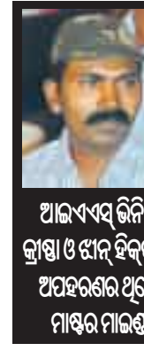
ଆଇଏସ୍‌ସି ବିନିଲ୍ କୁଖ୍ୟାଳ ଅପହରଣରେ ଥିଲେ ମାଓର ମାଲକାନଗିରି

ଅଞ୍ଜୁର ମରଣରାତ୍ରୁ ଠାବ କରିଥିଲେ । ଏହାସହ ଘଟଣାସ୍ଥଳରୁ ୨ଟି ଏକେ-୪୬ ରାଇଫଲ, ବହୁ ମାଓ ସାମଗ୍ରୀ ମଧ୍ୟ ଜବତ କରିଥିଲେ । ମୃତ ଅରୁଣା ପୂର୍ବରୁ ଛତିଶଗଡ଼ରେ ଯବାନଙ୍କ ସହ ଏକକାରଣରେ ବେଳେ ନିହତ ହୋଇଥିବା ମାଓନେତା ଚଳଚ୍ଚିତ୍ରକ ପଞ୍ଜା । ଆଜି ଯବାନଙ୍କୁ ଏହି ବନ୍ଦ ସଫଳତା ମିଳିବା ପରେ ଅଞ୍ଚଳରେ ବର୍ତ୍ତମାନ ମଧ୍ୟ ତଳାସି ଅଭିଯାନକୁ ଜାରି ରଖାଯିବା ସହ ଓଡ଼ିଶା-ଅଞ୍ଚ ସାମାନ୍ତ ସିଲ୍ କରାଯାଇଥିବା ଜଣାପଡିଛି ।