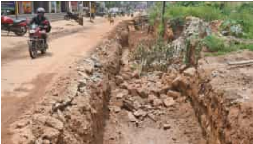
ଏକଲି ଏକ ଡ୍ରେନ୍ ବହୁ ଦିନ ହେବ ଖୋଳା ହୋଇ ରହିଛି। ପ୍ରକାର ବ୍ୟାରିକେଟ୍ କରାଯାଇ ନାହିଁ। ରାସ୍ତାକଡ଼ରେ ପ୍ରାୟ ୫-୬ ଫୁଟ ଉଚ୍ଚର ଏକ ଖାଲ ରହିଥିଲେ ମଧ୍ୟ କୌଣସି ଏତେ ବଡ଼ ଖାଲ ରହିବା ଦ୍ୱାରା ଲୋକେ ବିପଦ ସମ୍ମୁଖୀନ ହେଉଛନ୍ତି।

ଅବସ୍ଥାରେ ଯାତାୟତ କରୁଛନ୍ତି। ଏନେକ ଲୋକେ ଅସନ୍ତୋଷ ପ୍ରକାଶ କରୁଥିଲେ ମଧ୍ୟ ଠିକାଦାର କିମ୍ବା ଯନ୍ତ୍ରା କାହାରି ବି ଖାତିର ନାହିଁ। କଟକ ଭୁବନେଶ୍ୱର କାତାୟ ରାଜପଥ କଡ଼ରେ ମଧ୍ୟ ସମାନ ଅବସ୍ଥା ଦୃଷ୍ଟି ହୋଇଛି। ଏଠାରେ ଏକାମାସରୁ ଉର୍ଦ୍ଧ୍ୱ ହେବ ଆଉ କାମ ହେଉନାହିଁ। ଏହି ଖୋଳାଯାଇଥିବା ଡ୍ରେନ୍‌କୁ ବ୍ୟାରିକେଟ୍ କି କରାଯାଇ ନାହିଁ। କେବଳ ଏହି ମୁକ୍ତ ସ୍ଥାନ ନୁହେଁ ବରଂ ରାଜଧାନୀର ବହୁ ସ୍ଥାନରେ ଏଭଳି ସମାନ ସ୍ଥିତି ଚାଲି ରହିଛି। ବିଭାଗୀୟ ଯନ୍ତ୍ର ଠିକାଦାରଙ୍କ କାର୍ଯ୍ୟ ତଦାରଖ କରିବା କଥା ହେଲେ ଯନ୍ତ୍ରମାନେ ଘଟଣାସ୍ଥଳକୁ ଆସି ଯାଇ ନ ଥିବାରୁ ଏଭଳି ସମସ୍ୟା ସୃଷ୍ଟି ହୋଇଛି। ଠିକାଦାର କାମ ଖରାପ କରନ୍ତୁ କିମ୍ବା ନିୟମ ଉଲ୍ଲଙ୍ଘନ କରନ୍ତୁ। ପକ୍ଷରେ ଲୋକେ ହଇରାଣ ହେଉଛନ୍ତି। ମାଲିଆହି ଶିଶୁ ମୃତ୍ୟୁ ଘଟଣାରେ ଗୃହ ନିର୍ମାଣ ଏବଂ ନଗର ଉନ୍ନୟନ ମନ୍ତ୍ରୀ କୃଷ୍ଣଚନ୍ଦ୍ର ମହାପାତ୍ର ପ୍ରତିଶ୍ରୁତି ଦେଲେ ଯେ ୨ ଦିନ ମଧ୍ୟରେ ଡ୍ରେନ୍ ଗୁଡ଼ିକର ବ୍ୟାରିକେଟ୍ କରାଯିବ। ନ ହେଲେ କାର୍ଯ୍ୟାନୁଷ୍ଠାନ ଗ୍ରହଣ କରାଯିବ। ହେଲେ କାର୍ଯ୍ୟାନୁଷ୍ଠାନ କେବଳ ୨ ଦିନ ପାଇଁ ସୀମିତ ରହିଲା। ସାତ ଦିନ ପରେ ଠିକାଦାର ଯେଉଁ ମୁକୁଳାକୁ ସେହି ମୁକୁଳା।